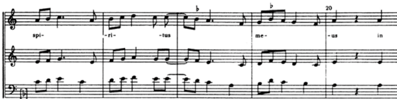
Przykład techniki fauxbourdon (Mikołaj z Radomia, Magnificat , t. 16–20) 13

Wraz z rozwojem muzyki wielogłosowej śpiew gregoriański zaczął powoli zatracać swoją pierwotną funkcję proklamacji tekstu na rzecz obecności w jednym z głosów jako cantus firmus . Do najcenniejszych dzieł reprezentujących europejski poziom kultury muzycznej i nowoczesne środki techniki kompozytorskiej należy pierwsze rdzennie polskie wielogłosowe opracowanie Magnificat autorstwa Mikołaja z Radomia, pochodzące z pierwszej połowy XV wieku (nie znamy dat życia kompozytora). O jego twórcy nie wiemy prawie nic, poza tym, że był jedynym znanym polskim kompozytorem średniowiecznym tworzącym muzykę świecką i religijną w stylach burgundzkim, włoskim i niderlandzkim, co świadczy o otwartości naszego kraju na międzynarodowe zdobycze kultury muzycznej. Dzieło Magnificat , obok panegiryku na cześć pary królewskiej Hystoriographi aciem mentis , jest jego najbardziej znanym utworem. Trzygłosową obsadę wykonawczą stanowią „alt, chór mieszany i dwa puzony, dwie wiolonczele ad lib.”. Utwór zasługuje na zainteresowanie przede wszystkim dlatego, że w pionierski sposób wykorzystuje technikę fauxbourdon . Są to równoległe pochody akordów w pierwszym przewrocie przesuwane względem siebie w jednym kierunku. Inną charakterystyczną cechą jest bardzo przemyślana i wewnętrznie spójna koncepcja formalna, w sferze melodyki mocno nawiązująca do śpiewu gregoriańskiego 12 .