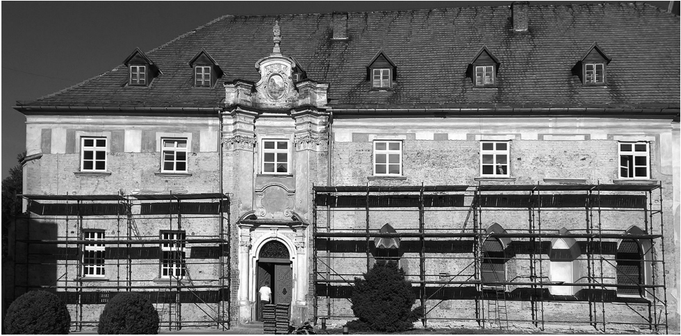
Il. 1. Elewacja wschodnia opactwa cysterskiego w Łądzie podczas badań architektonicznych w 2019 roku

Pierwsza wzmianka dotycząca klasztoru pojawia się w 1233 r. w sfałszowanym dokumencie księcia wielkopolskiego Władysława Odonica, w którym to dokumencie wymienione są nadania księcia poczynione na rzecz klasztoru pw. NMP i św. Mikołaja biskupa 5 . Kolejne przekazy mówią o klasztorze jako o miejscu przekazania sakry biskupiej: w 1255 roku Boguchwałowi z „Cierzelina” 6 , a 1286 r. Janowi Herburtowi II 7 . Istnieje także informacja o dacie dziennej konsekracji kościoła – 11 października, brakuje jednak przy niej roku 8 . Kolejny dokument związany z budową klasztoru pochodzi z 1399 r. i zapisano, że został sporządzony in stuba murata monasterii Landensis 9 . O architekturze klasztornej u schyłku średniowiecza informują także notatki Edmunda od Krzyża z 1580 r. sporządzone po wizytacji kościoła i klasztoru: „loca regularia omnia, ecclesiae et claustrum fornices relictas, ab initio imperfectas, multa in aedificii reparanda” 10 .