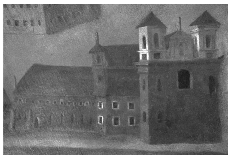
Il. 2. Klasztor od wschodu wg Adama Swacha z około roku 1714. Z lewej – część fresku, z prawej – fragment obrazu olejnego wiszącego w krużgankach klasztornych

wydana monografia omawiająca wiele problemów związanych z najnowszymi badaniami średniowiecznych zabytków opactwa łądzkiego 28 . W tym tomie autorka przedstawiła kolejną próbę wydzielenia najważniejszych faz budowlanych opactwa 29 .