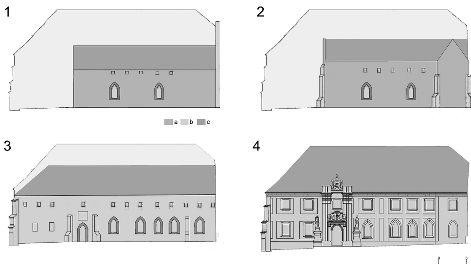
Il. 5. Elewacja wschodnia budynku klauzury. Wyniki badań architektonicznych w 2019 roku. Próba rekonstrukcji faz budowy: 1 – wczesny gotyk, 2 – gotyk I, 3 – gotyk II, III, 4 – barok, a – cegły, b – tynki, c – dach, oprac. E. Łużyniecka

zwieńczoną spłaszczonymi łękami odcinkowymi. Łęki znalazły się w części nadbudowanej, a osadzone w starym murze parapety umieszczono wyżej od poprzednich. Tylko jedno tego typu okno zachowało się w całości i zostało odkryte na północ od obecnej strefy wejściowej. Przy południowym jej pilastrze został odsłonięty relikw zapewne pierwotnej przypory, która wzmacniała południowo-wschodnie naroże skrzydła.