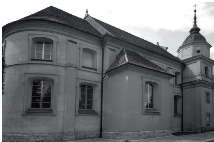
Il. 3. Kościół parafialny pw. św. Trójcy we Włoszakowicach od strony północnej.

/ Na kosztowne ogrody i pyszne pałace, / Na mury, szkoły i tym podobne struktury, / które wždy długo trwają i pamiątkę nosią 60 . W Satyrze drugiej na młodź utratną pisał: „Że się nad swoje siły i dostatki piąć chce, / I zrównać z możniejszymi, co już niepodobna. A tymczasem fabryki i ojcowskie budynki / Lecą, gniją kosztowne pałace, kościoły. Pan synek niedba o nic, choć ma czasem za co poratować i pokryć 61 . Zbieżne poglądy reprezentowali współcześni lub wcześniej od Opalińskiego tworzący pisarze. Sebastian Petrycy z Pilzna dowodził, że można pan, budując, powinien zachowywać „wielkość, zacność, piękność i podziw nakładów swoich”, wzbudzając cześć i szacunek. Poglądy te obydwaj zaczerpnęli zapewne z pism Arystotelesa, należących do obowiązkowych lektur uczniów jezuickich kolegów pragnących poznać arkana retoryki 62 .