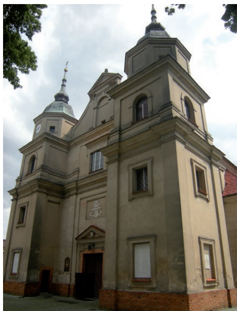
Il. 4. Fasada kościoła parafialnego pw. św. Trójcy we Włoszakowicach.