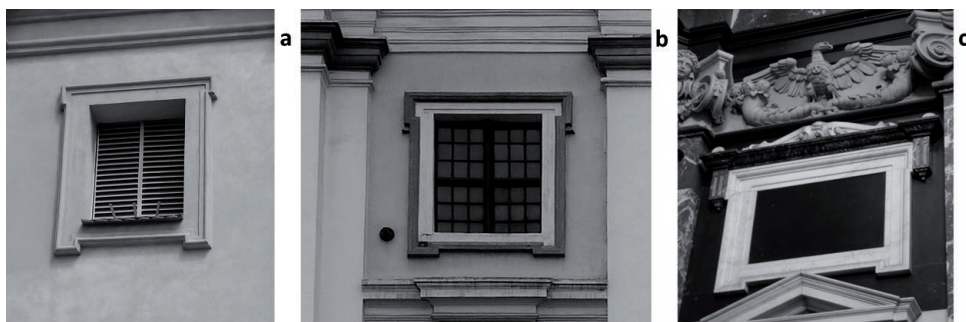
Il. 6. a) Okno w nawie kościoła parafialnego pw. św. Trójcy we Włoszakowicach b) okno w fasadzie kościoła karmelitów bosych pw. św. Teresy w Wilnie c) fragment dekoracji we wnętrzu kaplicy św. Kazimierza przy katedrze wileńskiej.

malarza najważniejszą cechą budownictwa mieszkalnego 69 . Pojęcie to w takim znaczeniu pojawiło się już wcześniej u innych teoretyków architektury, m.in. Sebastiana Serlio 70 . Można przyjąć, że Opaliński mógł czerpać inspirację z pracy Rubensa.