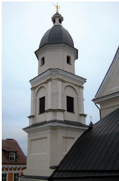
Il. 5. Wieża kościoła karmelitów bosych pw. św. Teresy w Wilnie.

na 139 rycinach wykonanych na podstawie rysunków artysty zawarto opisy oraz wizerunki fasad i planów pałaców genueńskich patrycjusza, a także kościołów S. Maria in Carignano, teatynów i jezuitów 66 . Rzuty i przekroje budowli zaprezentowane przez Rubensa zyskały dużą popularność wśród czytelników, czego dowodzi ich recepcja w budownictwie świeckim, ale też w pracach francuskich i niemieckich teoretyków architektury 67 . Sama koncepcja ukazywania budowli w postaci rzutów, fasad i przekrojów wywodziła się natomiast z pomysłów francuskich autorów, takich jak Jacques Androuet du Cerceau, Pierre Le Muet czy Louis Savot 68 . Prezentowane pałace charakteryzowała szczególna zwartość i funkcjonalne rozplanowanie. Rubens we wstępie do pracy podkreślił, że wybrane przez niego budowle wznoszono w ten sposób ze względu na commoditá , czyli wygodę właścicieli, będącą według