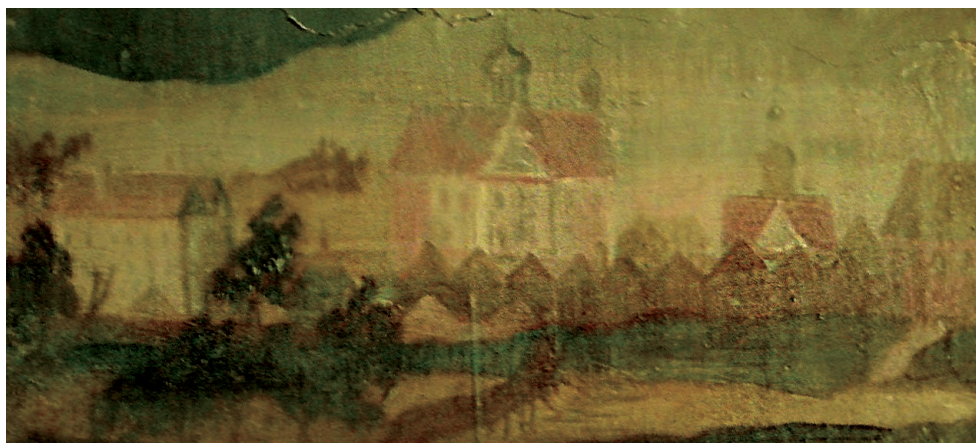
Il. 1. Widok Sierakowa na skrzydle bocznym ołtarza głównego w kościele parafialnym w Lutomiu z lat 40. XVII.

z ogrodem 25 . Opaliński preferował wyraźnie zwarte, symetrycznie rozplanowane założenia rezydencjonalne, a szczególną uwagę przykładał do wyposażenia i wystroju wnętrz wzorowanego być może na komnatach zamków królewskich w Krakowie i Warszawie.