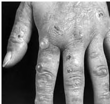
Fot. 2: Porfiria skórna

wystarczy by na twarzy i innych odkrytych częściach ciała powstały ropiejące pęcherze 29 . W odmianie przewlekłej następuje tzw. bliznowacenie, wypadanie włosów (lub rzadziej ich nadmierny wzrost) i pogrubienie skóry w miejscach narażonych na światło. (por. fot.2)