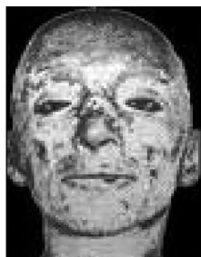
Fot. 3: Twarz chorego na porfirię

Szkodliwe substancje nagromadzone w tkankach odpowiedzialne są również za silnie czerwoną fluorescencję uzębienia chorych osób. Ponadto może dochodzić do obkurczanie dziąseł, przez co szyjki zębów ulegają odsłonięciu, i zęby w tym kły zdają się być dłuższe niż są. Chorobie towarzyszyć mogą także postępujące deformacje twarzy powstające w wyniku zmian zapalno-martwiczych prowadzących do pojawienia się zniekształcających blizn. Spotykane są również przypadki utraty nosa czy palców, powstania wyjątkowo szpecących blizn, ściągnięcia warg i dziąseł. Ponieważ produkty metabolizmu porfiryn wydalane są z moczem lub kałem, te przybierają czerwoną barwę 30 . (por. fot.3)