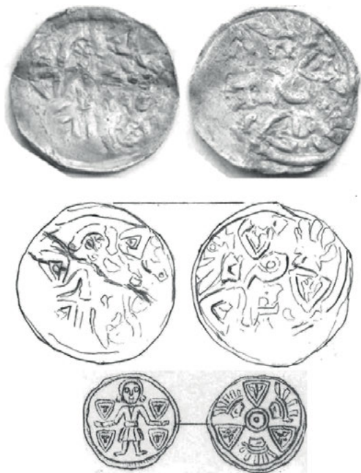
Ryc. 6. Międzyrzecz. „Denar podrabiany”. Da. 135/Bft 242. Rys. monety z Międzyrzecza i rys. Bft 242

6. Marchia Brandenburska/Księstwo Saksońsko-Wittenberskie/Hrabstwo Anhalckie ?, dynastia askańska?, denar ok. 1295–1300 r. (ryc. 6) Da. AS (Brb.), s. 156, nr 135 (ok. 1300); Da. 135 III/3 2 ; Bft 242; Thormann 242 3