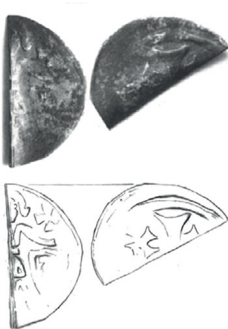
Ryc. 4. Międzyrzecz. Denar Da. 127/Bft 572

centralnego krzyża. Stempel lekko przesunięty. Przykrawędna obwódka liniowa odbita na połowie przedzielonego denara.