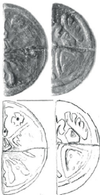
Ryc. 3. Międzyrzecz. Denar Da. 113/Bft 571

Z fotografii można odczytać, że przepołowienie nastąpiło w wyniku regularnego przecięcia. Monetę przelamano z pewnością po odkryciu.