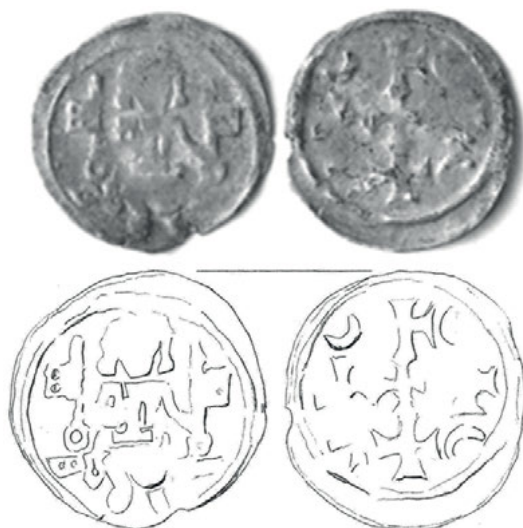
Ryc. 1. Międzyrzecz. Denar Da. 79/Bft 339

1. Marchia Brandenburska, dynastia askańska, denar, ok. 1275 r. (ryc. 1) Da. 79 (ok. 1275)/Bft 339