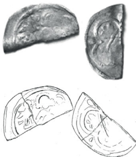
Ryc. 2. Międzyrzecz. Denar Da. 111/Bft 565

Av. Stojąca na wprost postać z rozłożonymi rękoma. Nad każdą dłonią orzeł (lub sokół) skierowany głową do wewnątrz. Poniżej po jednym hełmie z orlim skrzydłem, również każdy skierowany ku postaci. Przy krawędzi obwódka liniowa odbita na całym obwodzie połówki. Stempel lekko przesunięty. Pęknięcie w poprzek połówki. Stempel dosyć słabo czytelny. Cięcie nastąpiło w poprzek postaci.