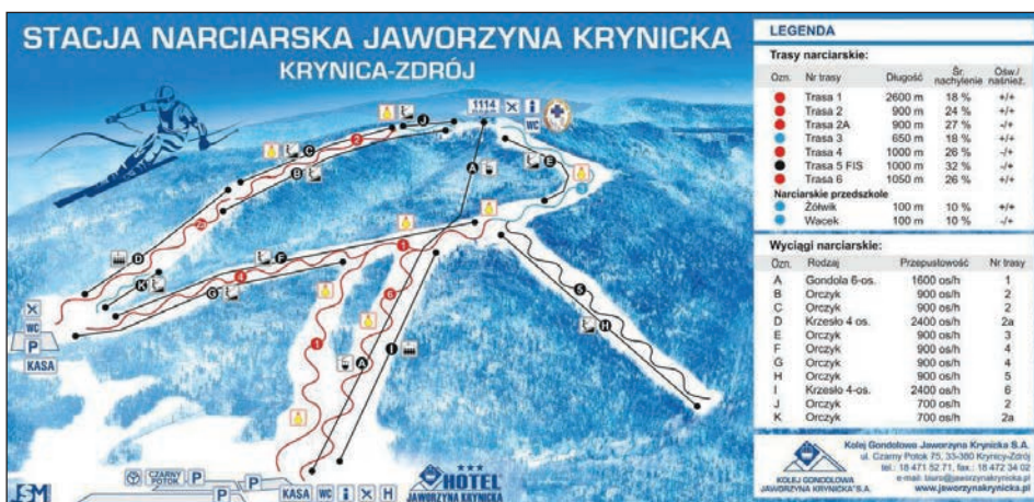
Ryc. 3. Plan stacji narciarskiej Jaworzyna Krynicka

Tak samo jak zmienia się obraz uzdrowiska, zmienia się obraz stacji narciarskich. W kurortach zaczynają dominować ludzie młodzi poszukujący nie tyle leczenia sanatoryjnego, co regeneracji organizmu w obiektach SPA (Dorocki, Brzegowy, 2014). Uwarunkowania kulturowe oraz dominujący model rodziny w Polsce wpływają na coraz większe zainteresowanie pobytami w uzdrowiskach samotnych kobiet oraz kobiet z dziećmi. Dlatego tak znaczący udział w większości kurortów mają obecnie ośrodki oferujące usługi typu spa and welles dla kobiet. Również funkcjonowanie w analizowanych ośrodkach przedszkoli narciarskich dla dzieci lub tzw. kącików malucha z wykwalifikowaną kadrą pedagogiczną potwierdza duży udział rodziców z dziećmi wśród klientów wyciągów narciarskich. Do górskich miejscowości uzdrowiskowych przybywają osoby poszukujące wypoczynku, rekreacji i zabawy. Szczególnie widoczne jest to w trakcie wzrostu przyjazdów w okresie weekendów zimowych oraz ferii.