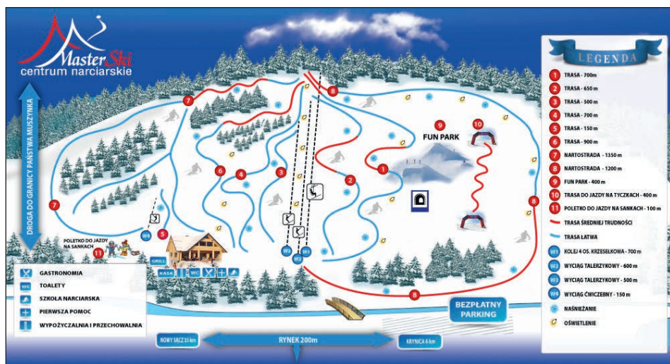
Ryc. 2. Plan stacji narciarskiej MasterSki w Tyliczu