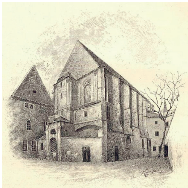
W 1903 r.