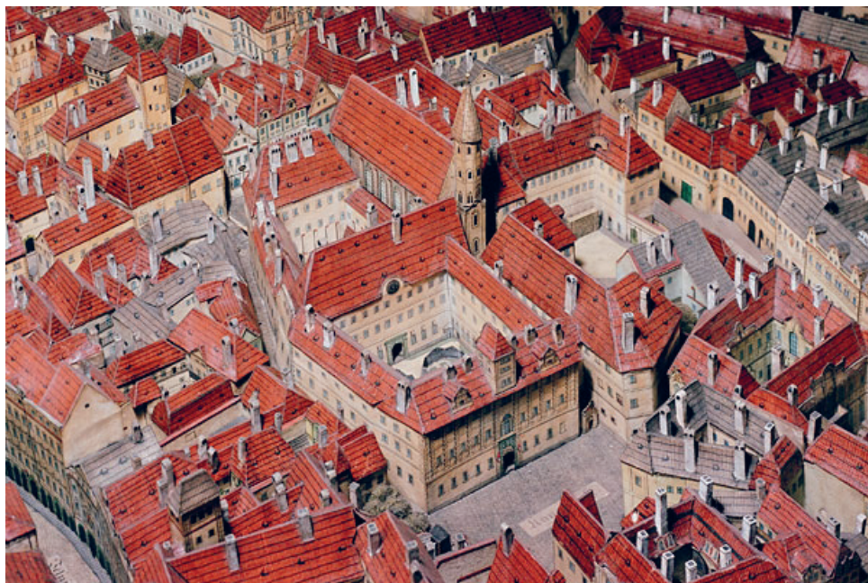
Na makiecie wg stanu z XVIII w.