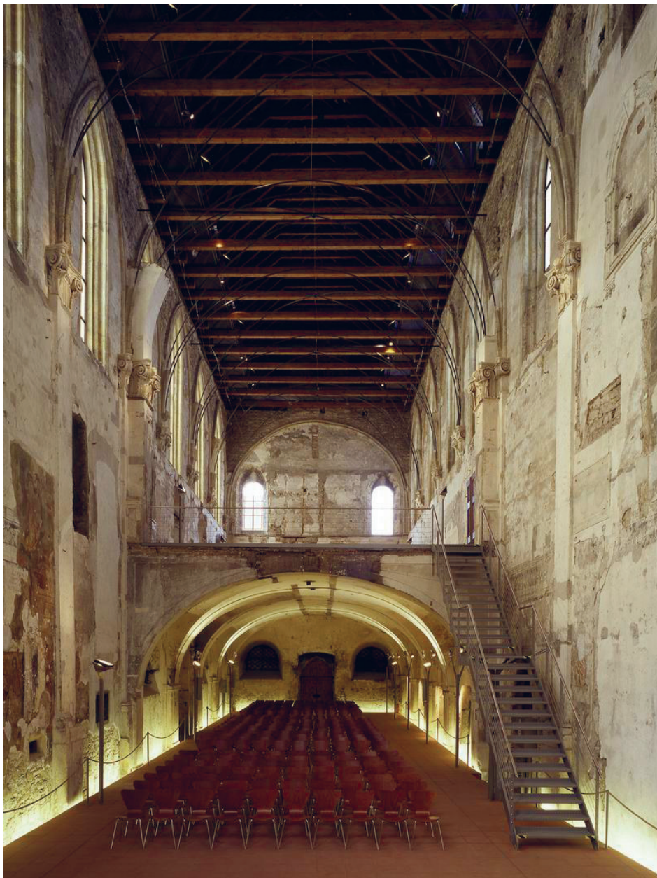
Widok na chór zakonny