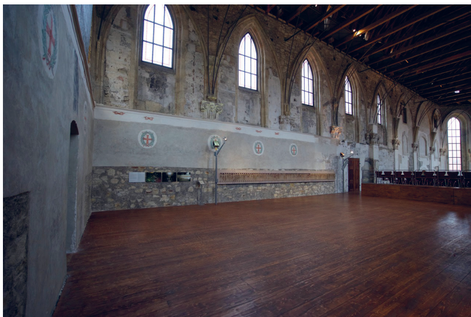
Dawny chór mniszek