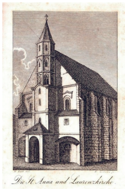
W XIX w.