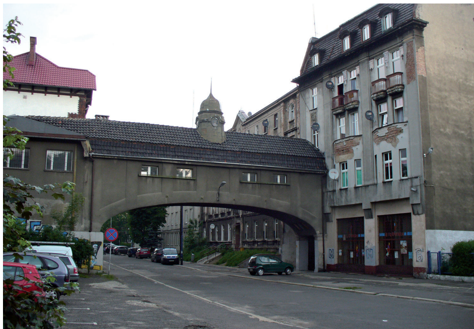
Fot. 1. Budynek dawnej stacji emigracyjnej z przewiązką (stan w 2013 r.)