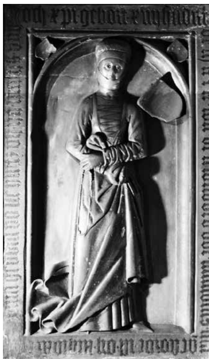
Il. 4: Żagań

postaci. Inskrypcja przebiega w bordiurze wzdłuż krawędzi płyty, zaczynając się w lewym górnym rogu, a kończąc w płycinie wzdłuż ramy po prawej stronie zmarłej na długości ramienia–dłoni. Z powodu odkucia inskrypcji pozostały w tym miejscu nierówności i zagłębienia, które starano się zamaskować pokrywając je zieloną farbą lub jakimś innym środkiem. W wyniku tego zabiegu końcowa treść inskrypcji znajdująca się w płycinie uległa całkowitemu zniszczeniu. Poza uszkodzeniami w obszarze bordiury i inskrypcji, ogólny stan zachowania zabytku należy ocenić jako dobry. Płyta została wykonana z piaskowca o wymiarach: wysokość 205 cm, szerokość 118 cm. Inskrypcji jest wykonana w języku niemieckim, majuskułą i minuskułą gotycką; litery wklęsłe o wysokości 9–11 cm.