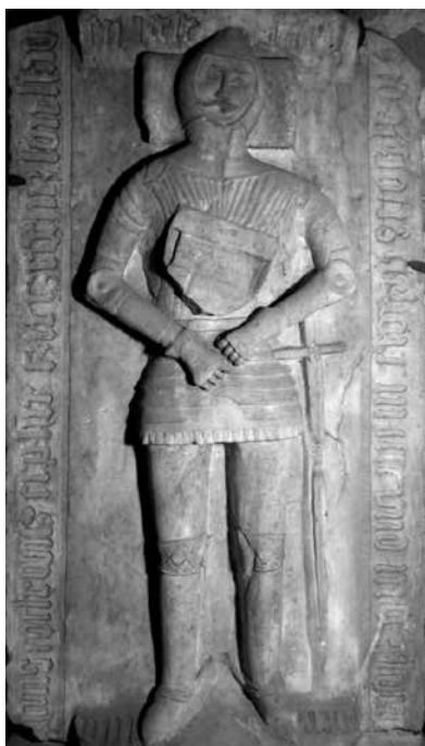
Il. 1 Siedlnica

Płyta figuralna z przedstawieniem w centralnej części postaci rycerza w pełnej zbroi płytowej w pozycji pionowo leżącej (poduszka pod głową) z rękoma założonymi na pasie. Napierśnik osłonięty marszczonym kaftanem z zawieszoną tarczą gotycką z herbem Kotwicz. U boku miecz, przy trzewikach ostrogi. Na głowie czepiec kolczy i hełm otwarty o ostrym dzwonie. Powyżej głowy wezłowie w formie gzysmu o trójkątnym przekroju. U dołu pod stopami podobny gzysm jako wspornik. Inskrypcja przebiega wzdłuż krawędzi płyty, zaczynając się w prawym górnym rogu i jest przerwana elementami przedstawienia postaci. Warto przy tym podkreślić, że omawiana płyta nie zachowała się w najlepszym stanie i wykazuje drobne ubytki oraz inne uszkodzenia.