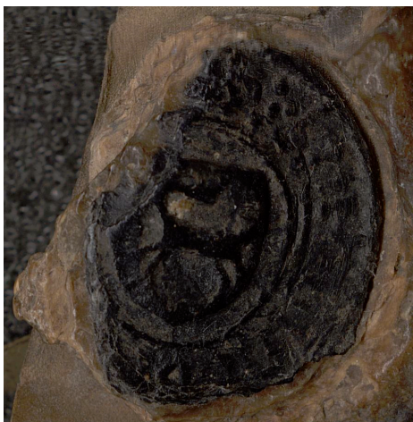
Fot. 5. Pieczęć Lutolda, syna Bieniasza, 1448 r. AGAD, ZDP, nr 3518