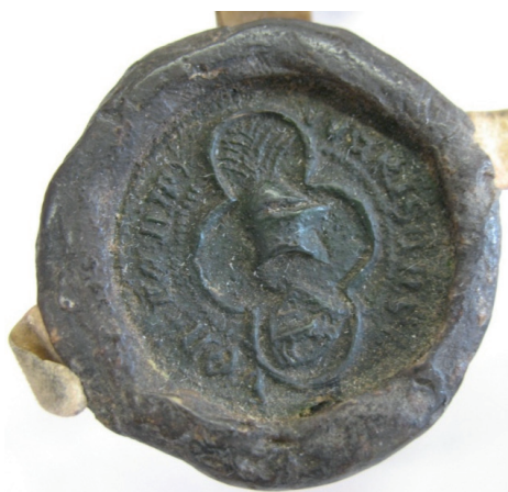
Fot. 1. Pieczęć Wierusza z Wieruszowa i Kątów, 1426 r. AP Wrocław, Rep. 66, nr 463

już na początku XVI wieku zastąpiono go nowym. W tym pierwszym widzieć należy bezspornie czternastowieczne jeszcze sigillum Wieruszowa, ponieważ brak dowodów na jego wymianę po 1426 roku. Dopiero na przełom XV i XVI wieku datować zatem można, wbrew stanowisku historyków, powstanie typariusza z najstarszym wizerunkiem odmienionego herbu miasta, uaktualniającego treść ikonograficznego przekazu poprzez połączenie symboliki z jednej strony odwołującej się bezpośrednio do założycieli miasta i reprezentującej zwierzchność feudalną (kozioł), z drugiej zaś będącej formą manifestacji miejskiej samodzielności (fasada kościoła z dwiema wieżami).