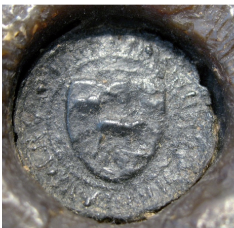
Fot. 3. Pieczęć Bernarda, syna Lutolda, 1397 r. ANKr, ZR. Dok. perg., nr 89