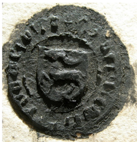
Fot. 4. Pieczęć Klemensa Wierusza, 1447 r. AP Wrocław, DmWr., nr 3241