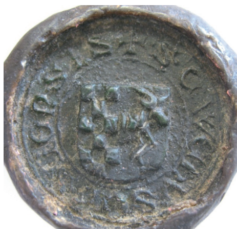
Fot. 2. Pieczęć miasta Wieruszowa, 1426 r. AP Wrocław, Rep. 66, nr 463