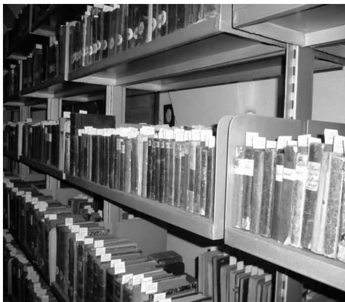
Fot. 4. Fragment biblioteki na pierwszym piętrze – kolekcja starodruków. The fragment of the library on the first floor – the collection of antique books.