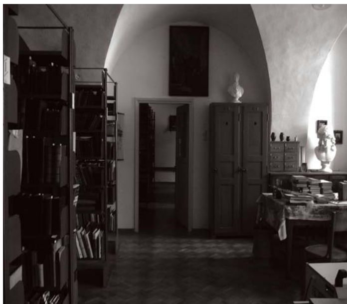
Fot. 2. Fragment biblioteki na parterze – druki XIX i XX-wieczne, w głębi księgozbiór szkolny. The fragment of the library on the ground floor – prints of the 19th and 20th centuries, in the background-the school book collection.