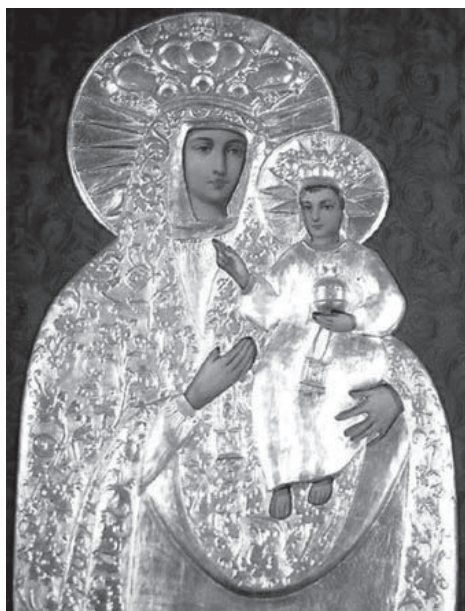
8. MB Szkaplerzna – parafia MB Królowej Polski w Zahutyniu