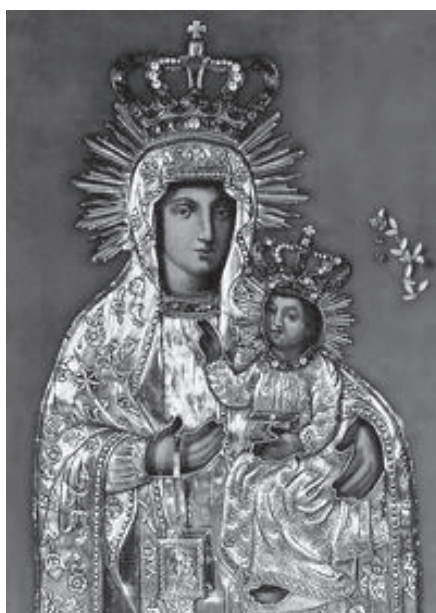
6. MB Szkaplerzna (XVII w.) – sanktuarium MB Szkaplerznej w Tomaszowie Lubelskim