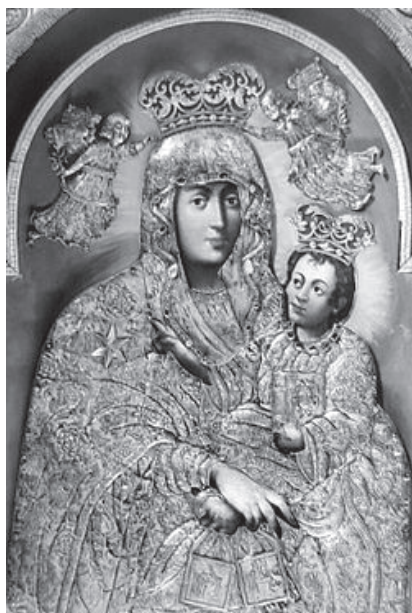
4. MB Szkaplerzna (1700 r.) – katedra św. Marcina i Mikołaja w Bydgoszczy