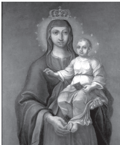
9. MB Szkaplerzna (XVIII w.) – Stalowa Wola-Rozwadów