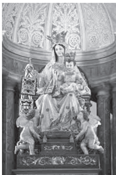
12. Figura MB Szkaplerznej – klasztor karmelitów bosych Stella Maris na Górze Karmel w Hajfie