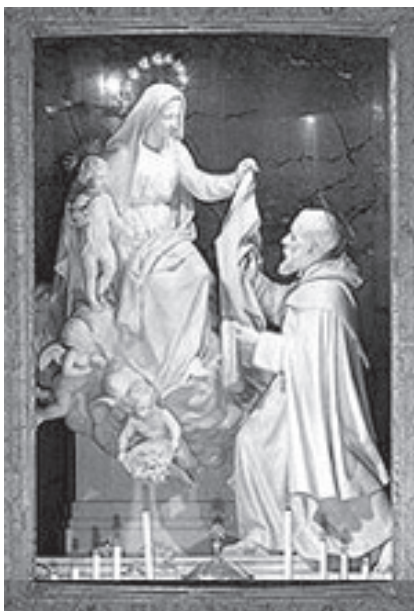
3. NMP przekazuje szkaplerz św. Szymonowi (XVII w.) – rzeźba Giovanniego Lorenzo Berniniego