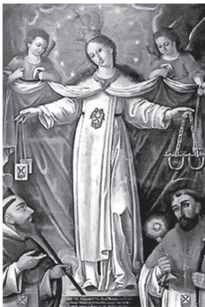
11. Muzeum Sztuki Katalońskiej w Barcelonie