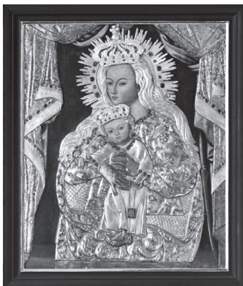
7. MB Szkaplerzna Bolszowiecka (XVI w.) – kościół św. Katarzyny w Gdańsku