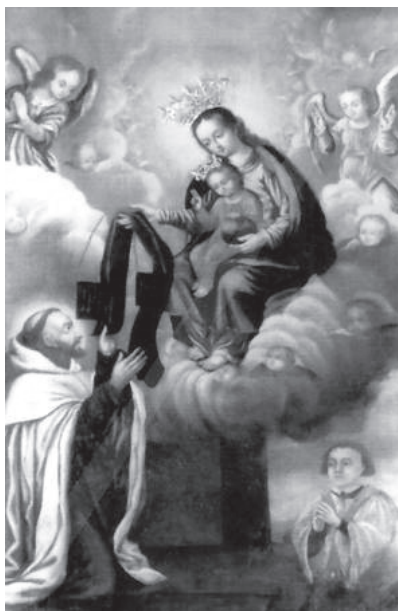
1. NMP przekazuje szkaplerz zakonny i bracki św. Szymonowi (1760 r.) – sanktuarium Matki Bożej Szkaplerznej w Dobrej.