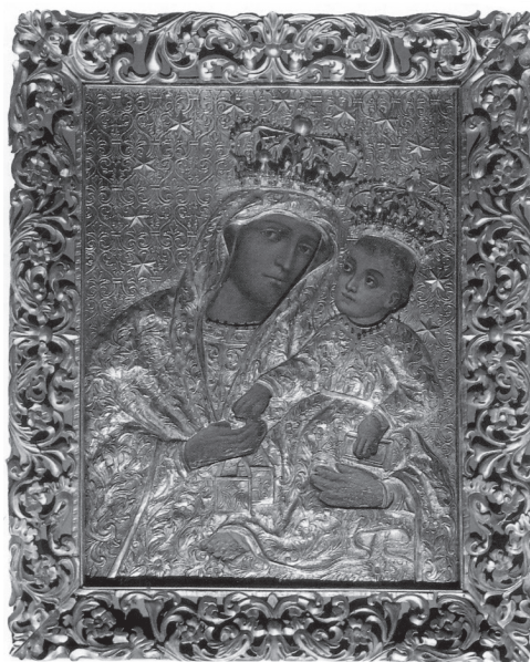
5. MB Szkaplerzna (XVII w.) – kościół farny w Łańcucie