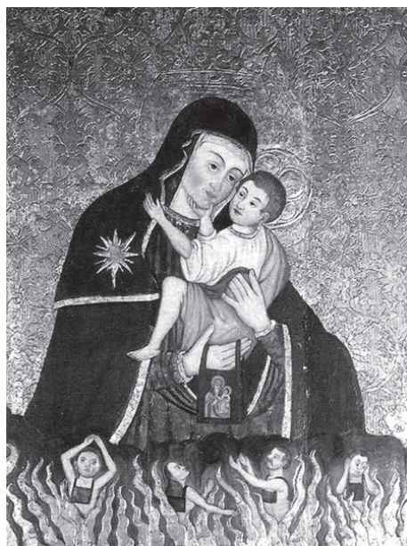
10. MB Szkaplerzna Trembowelska (XVI/XVII w.) – kościół św. Katarzyny w Gdańsku