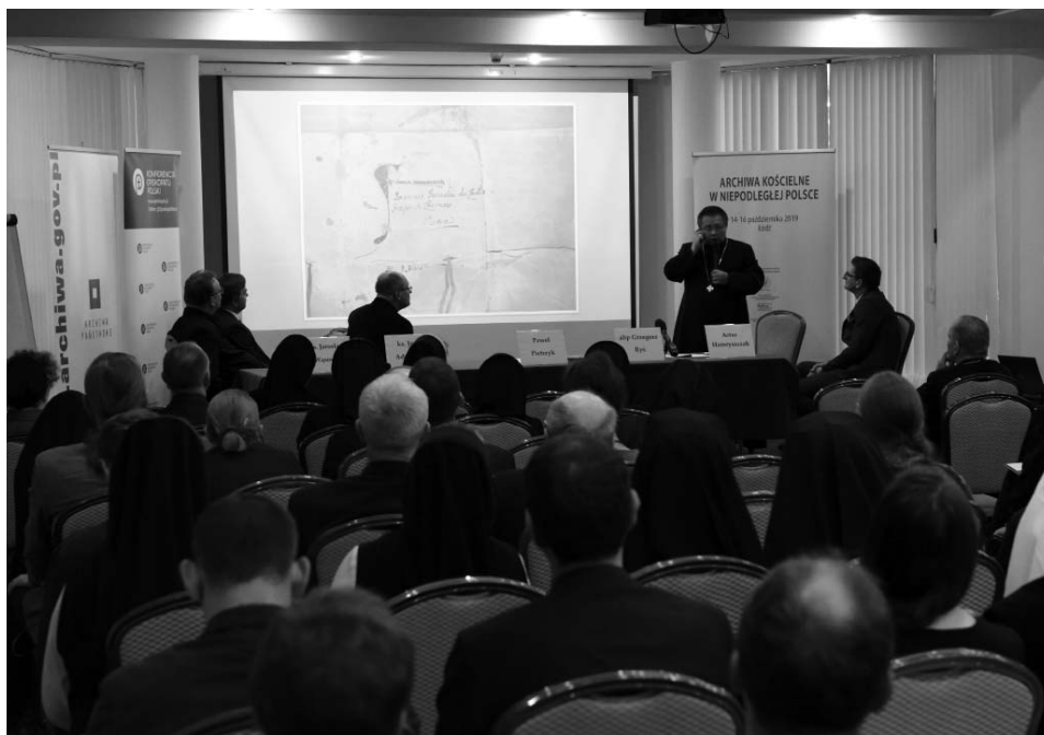
Fot. 3. Wykład abpa dr hab. Grzegorza Rysia Ze skarbów archiwalnych prehistorii łódzkiego Kościoła.