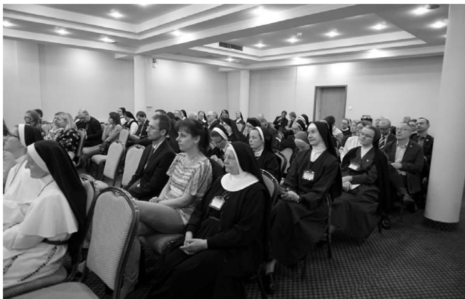
Fot. 6. Uczestnicy konferencji Archiwa kościelne w niepodległej Polsce .