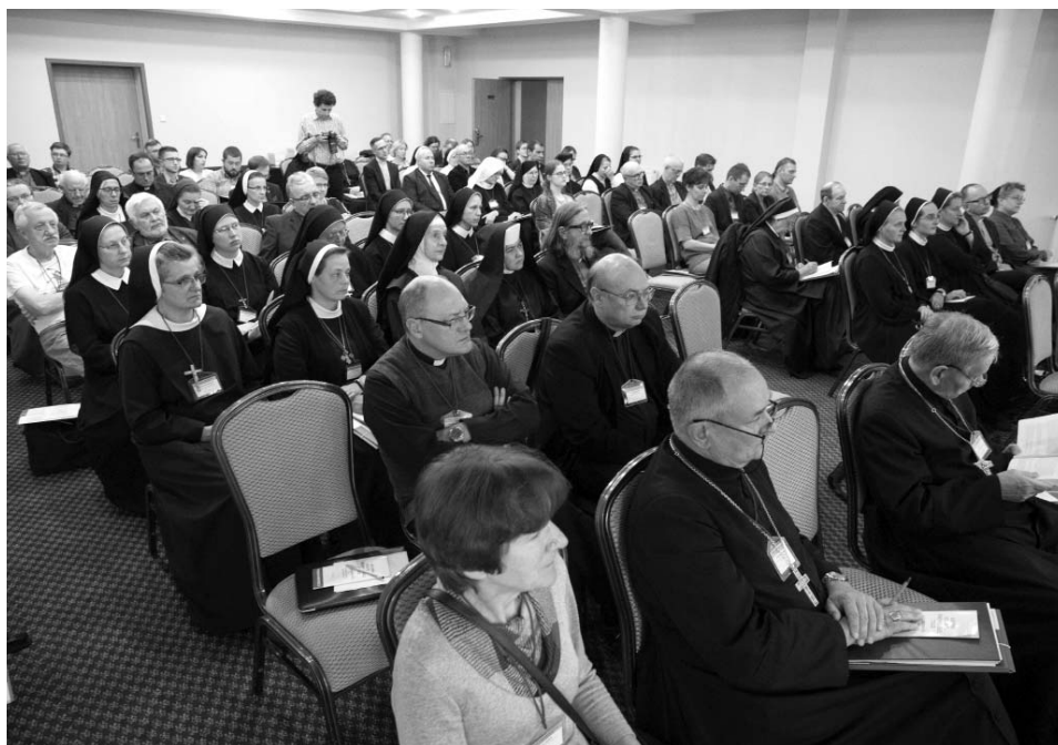
Fot. 5. Uczestnicy konferencji Archiwa kościelne w niepodległej Polsce .