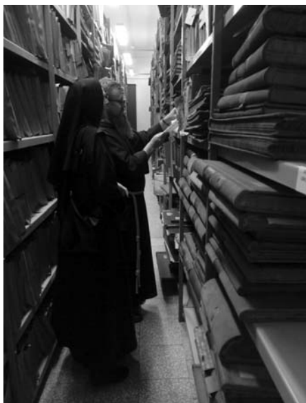
Fot. 8. Uczestnicy konferencji w magazynach Archiwum Państwowego w Łodzi.