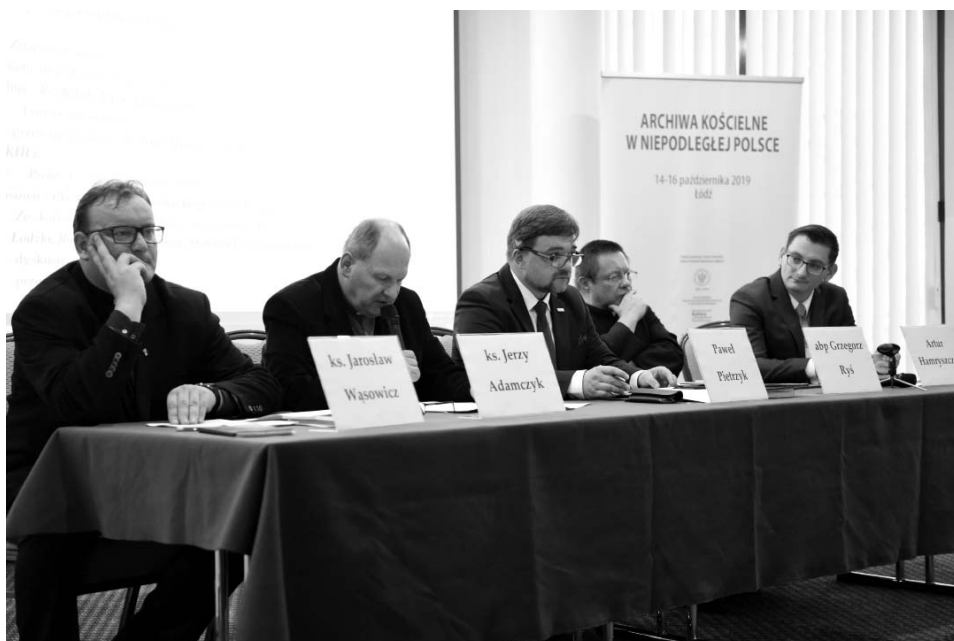
Fot. 2. Wykłady inauguracyjne konferencji Archiwa kościelne w niepodległej Polsce .