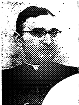
4. Włocławek 1950