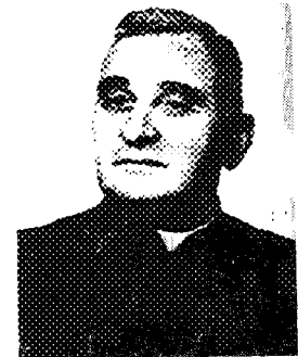
8. Lublin 1978