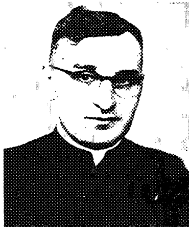
6. Włocławek 1960