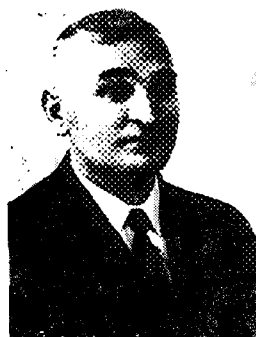
7. Lublin 1970