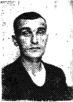
2. Paryż 1945