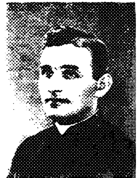
5. Włocławek 1955