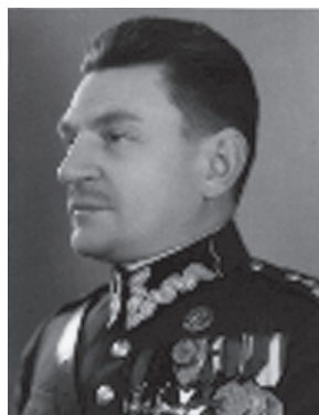
Henryk Józef Bagiński

Ur. 19 stycznia 1888 r. w Klwowie (pow. Opoczno). W 1912 r. ukończył Szkołę Politechniczną we Lwowie. Założyciel organizacji niepodległościowych, w latach 1911–1912 komendant Polskich Drużyn Strzeleckich. Współtwórca skautingu w Polsce. Jako dowódca pododdziału saperów służył w formacjach polskich w armii rosyjskiej i na wschodzie: w Brygadzie Strzelców Polskich (1916–1917), Dywizji Strzelców (DS) Polskich (1917) i sztabie I KP. 28 lutego 1918 r. usunięty z I KP przez gen.