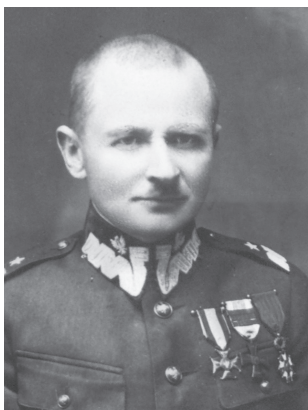
Marian Włodzimierz Kukiel

W maju tr. awansowany do stopnia pułkownika SG. Od kwietnia tr. dowódca 51 pp, od czerwca XXIV BP. Po wojnie m.in. szef Oddziału III MSWojsk.