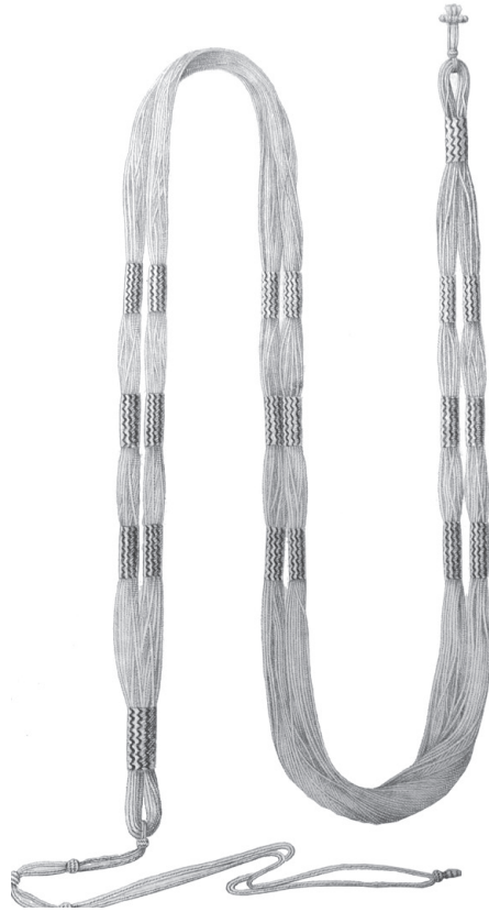
Ryc. 4. Pas włóczkowy.

Chorągiew Piechoty Węgierskiej Buławy Polnej Koronnej posiadała etatowo dwóch fajfrów oraz dwóch doboszy. 136 Podobnie jak w regimencie pieszym, tak w chorągwi węgierskiej za czasów hetmana wielkiego koronnego Potockiego muzycy posiadali odwrócone kolory – szafirowe suknie wierzchnie podszyte kirem w tym samym kolorze i czerwone żupaniki wraz ze spodniami. Kolory te noszono aż do 1752 r. 137 Później Wacław Rzewuski ujedynił barwę muzyków