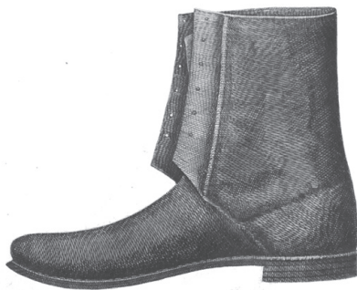
Ryc. 3. Buty węgierskie.

Żołnierze nosili „buty węgierskie”. W 1752 r. kosztowały one 4 zł. 121 W specyfikacji z 1754 r. opisano je jako „Buty czarne, sznurkowane, krojem węgierskim o dwóch podszwach”. 122 Owa podwójna podeszwa stanowi polski odpowiednik „ Doppelsohle ” – czyli podpodeszwy. Z kolei w 1755 r. określono je jako but „na obcasach niemiecki”. 123 Przypuszczać możemy, iż krojem buty te nie zmieniły zasadniczo wyglądu, gdyż wspomniany opis z 1755 r. wzmiankował m.in. trzy łokcie sznurka włóczkowego w cenie 2 gr za łokieć do „obsznrkowania” cholew tychże butów (rok później sznurek kosztował 1,5 gr 124 ), co zgadza się z charakterystyką obuwia zamawianego w 1765 r. – buty te miały być „na abcasach, krojem węgierskim y sznurkowane cholewy”. 125 Buty węgierskie ze względu na kształt (cholewy sięgały za kostkę), były droższe od trzewików noszonych przez żołnierzy Regimentu Pieszego Buławy Polnej Koronnej. Jeden z wariantów takich butów posiadających bardzo wysoko usytuowane kwatery, czyli cholewkę sięgającą nawet 16 cm od podeszwy, opisane jako „ Hungarische art ” przedstawiono w „ Allgemeiner Aufriss... ” z drugiej połowy XVIII w. 126 Buty takie odpowiadają zarówno opisowi źródłowemu, jak i grafice Raspego. Na początku lat pięćdziesiątych XVIII w. kosztowały między 4 a 5 zł, następnie ich cena wzrosła do 5,5 (1756), 6 (1760–1764), a później nawet 7,5 zł za sztukę.