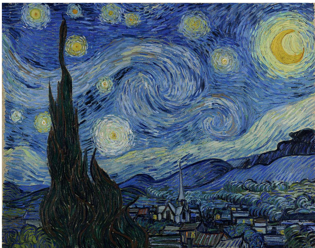
Il. 1. Vincent van Gogh, Gwiaździsta noc (1889). Museum of Modern Art, Nowy Jork.

Myśląc o holistyczności i elastyczności koncepcji Wojtak oraz o możliwości jej wykorzystania do realizacji celów mediolingwistyki, dostrzegłyśmy wizualizacyjny potencjał nie tylko multisensorycznej i animacyjnej formy prezentacji malarstwa Van Gogha, lecz także samego tego malarstwa do zwizualizowania zarówno przestrzeni komunikacji medialnej, jak i sposobu myślenia o tej komunikacji przez Wojtak. Zdając sobie sprawę, że przełożenie koncepcji naukowej na język dzieła malarskiego jest pomysłem kontrowersyjnym, ryzykujemy z nadzieją, że wraz z czytelnikami niniejszego artykułu stworzymy wspólnotę wyobraźni opartą na fundamencie multimodalnej interpretacji obrazu Vincenta van Gogha Gwiaździsta noc .