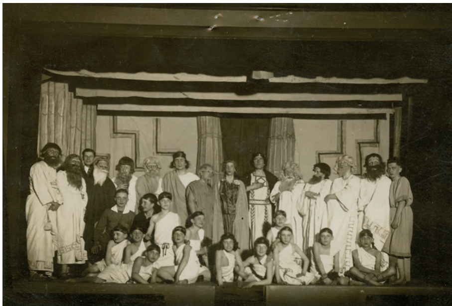
Fot. 2. Zdjęcie z przedstawienia teatralnego Król Edyp przygotowanego z okazji 50-lecia istnienia Towarzystwa Czytelniczego w Gimnazjum Mariackim, marzec 1928 r.

Na przestrzeni dziesięcioleci zmieniały się nazwy i program działania towarzystwa mającego na celu popularyzację książki i czytelnictwa. Pod koniec XIX w., występuje ono pod nazwą Deklamations-Verein der Gymnasiasten. Funkcjonowało również jako Gesang-und Deklamationsverein i Musik- und Leseverein 22 . Jak wskazuje nazwa – recytacje łączono z występami wokalnymi. Programy muzyczno-dramatyczne odbywały się częstokroć poza murami szkonymi. Gościny udzielał uczniom m.in. szczeciński Dom Koncertowy, co, zważywszy na rangę tej instytucji, może świadczyć o pewnym prestiżu, jakim cieszyły się szkolne organizacje w lokalnym środowisku 23 . Swoje podwoje udostępniały gimnazjalistom również inne szczecińskie instytucje i stowarzyszenia. Miejsca, w jakich prezentowali się członkowie koła poza szkołą,