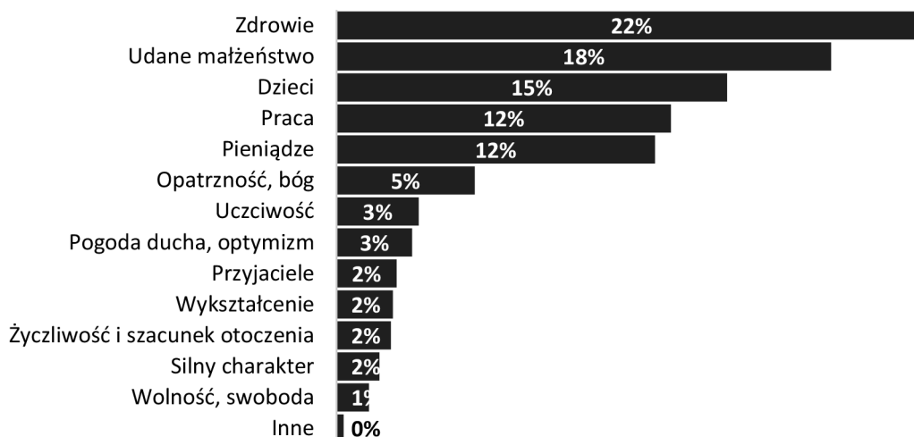
Rysunek 2. Najważniejszy warunek udanego, szczęśliwego życia (zaznacz maksymalnie 3) w deklaracjach Polaków w 2015 roku