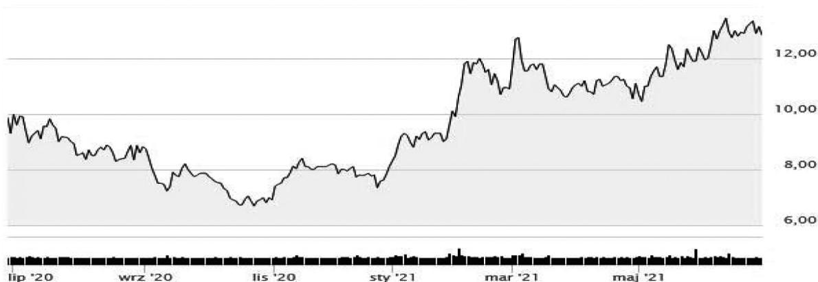
Rysunek 1. Wykres notowań akcji Unibeb S.A. Bielsk Podlaski w latach 2020–2021