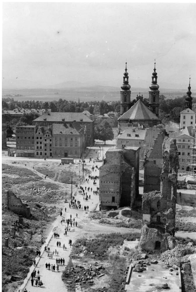
II.29. Widok z wieży kościoła św. Jakuba na śródmieście Nysy, druga połowa lat 50. XX w.