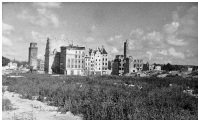
II.30. Śródmieście Nysy po odbudowie i pracach rozbiórkowych, widok w kierunku baszty bramy Ziębickiej, druga połowa lat 50. XX w.

Na pierwszym planie zarośnięty plac po rozebraniu południowo-wschodniej pierzei Rynku i zabudowy przy ul. Bolesława Krzywoustego (widoczna z lewej strony w głębi cała baszta bramy Ziębickiej). W centrum od lewej: odbudowany Dom Wagi Miejskiej z przyległymi kamieniczkami, ruiny wieży ratuszowej, żelbetowa konstrukcja dawnego domu towarowego Carla Bergmanna. Datę precyzuję ze względu na stan zabudowy. Dawny widok: Krawczyk, Syntetyczne omówienie , ryc. 4.