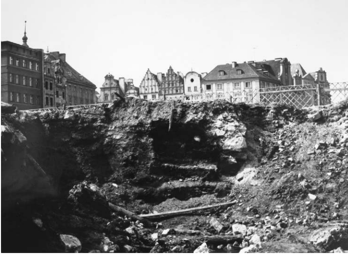
II.42. Zachowane i odbudowane (środkowe) domy przy ul. Celnej, odbudowane kamieniczki przy ul. Brackiej i w Rynku, 1958 r.

Na pierwszym planie wykopaliska archeologiczne po rozebraniu zabudowy jednej strony ul. Celnej. Na wprost ul. Bracka, za nią (w bok) odbudowane kamienice nr 22–26 w południowo-zachodniej pierzei Rynku.