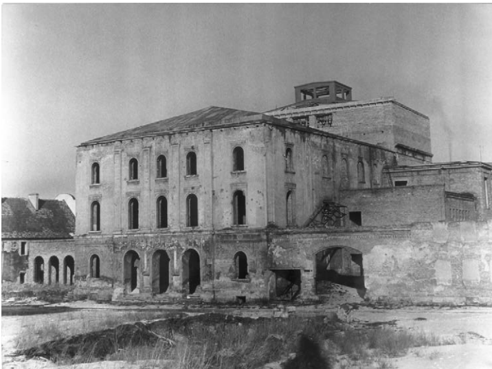
II.43. Budynek dawnego Teatru Miejskiego w trakcie kolejnej próby odbudowy, 1960 r.

Źródło: MPN, AF, sygn. 1675/6. Nysa, badania archeologiczne w rejonie ul. Celnej, Kramarskiej i Rynku, 1958 r., Stanisław Kramarczyk.