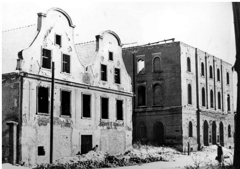
II.16. Odbudowana bliźniacza kamieniczka przy ul. Wałowej i budynek dawnego Teatru Miejskiego, 1958 r.