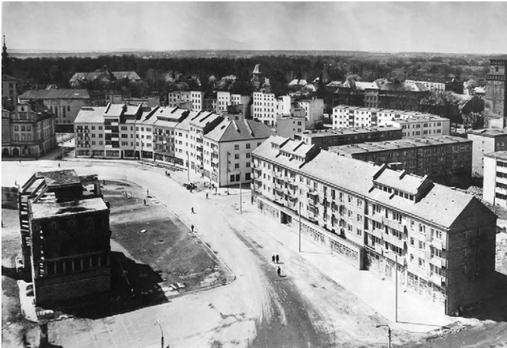
II.47. Rynek po zabudowaniu zachodniej i północnej pierzei, ok. 1963 r.

Źródło: MPN, AF, sygn. 516. Nysa w trakcie odbudowy, widok na Rynek, po 1945 r. (1950–1960), b.a.