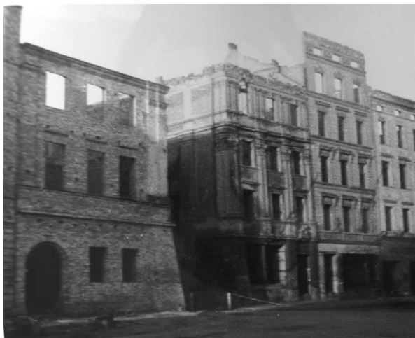
II.13. Odbudowa domu nr 26 w południowo-zachodniej pierzei Ryнку, początek lat 50. (?) XX w.

Z lewej: odbudowywana kamienica na rogu Ryнку (nr 26) i ul. św. Piotra. Po prawej: uszkodzone domy nr 27–29 w Ryнку (dzisiaj już nie istniejące).