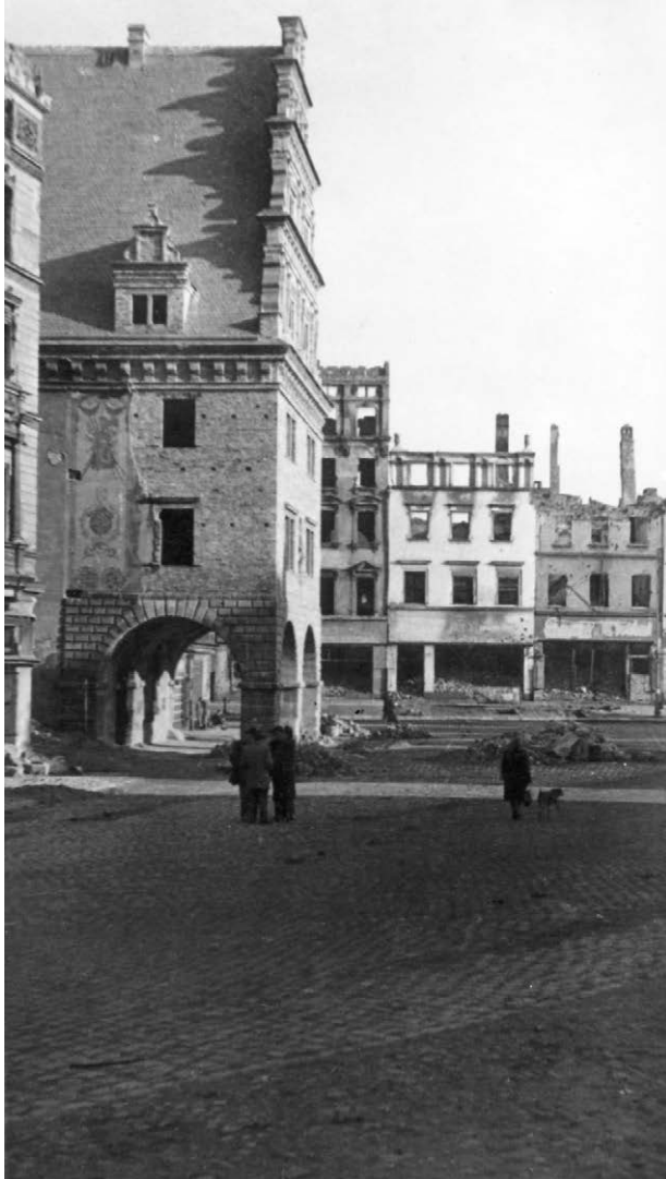
II.10. Odbudowany Dom Wagi Miejskiej na tle ruin południowo-wschodniej pierzei Rynku, lata 50. XX w. (przed 1957 r.)

Z lewej zachodnia pierzeja zabudowy śródrzykowej – fragment kamienicy złotnika Dalischa i odbudowany w stanie surowym Dom Wagi Miejskiej. Datę precyzuję ze względu na stan zabudowy (zachowane jeszcze ruiny domów w południowo-wschodniej pierzei Rynku). Dawny widok zob. Zbigniew Zalewski, Nysa na dawnej pocztówce , Opole [2003], ryc. 32, stan w czasie radzieckiej komendantury: Franz-Christian Jarczyk, Neisse. Kleine Stadtgeschichte in Bildern , Würzburg 1994, s. 103; Krzysztof Pawlik, Rok 1945 na ziemi nyskiej , [w:] Ziemia nyska – wielokulturowa historia regionu , Opole 2002, s. 64.