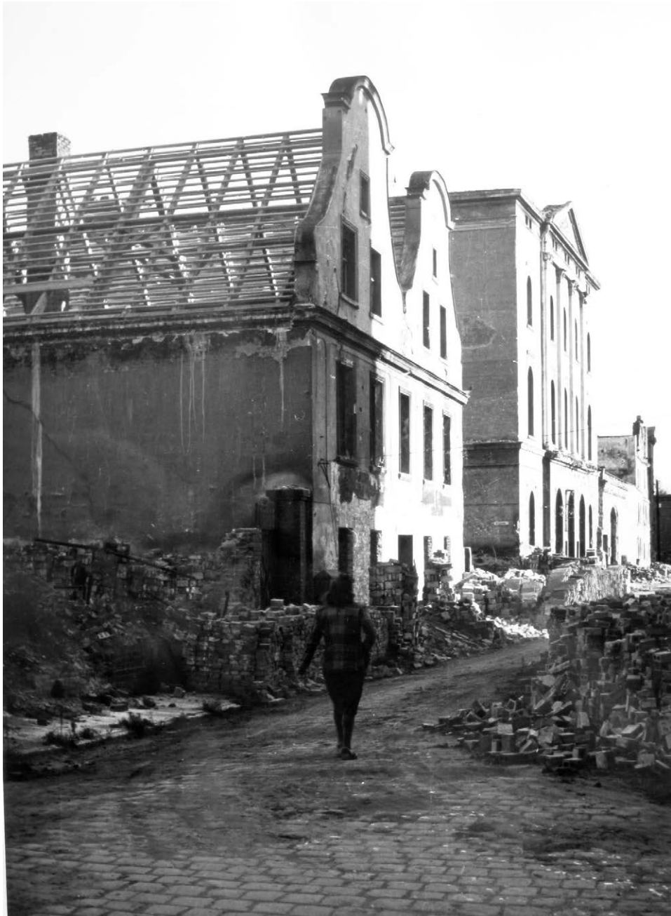
II.15. Odbudowa bliźniaczej kamieniczki przy ul. Wałowej, ok. 1949 r. (?)

Za remontowaną kamieniczką (z założoną konstrukcją dachową) budynek dawnego Teatru Miejskiego (jeszcze ze szczytem). Datę precyzuję ze względu na stan obiektów.