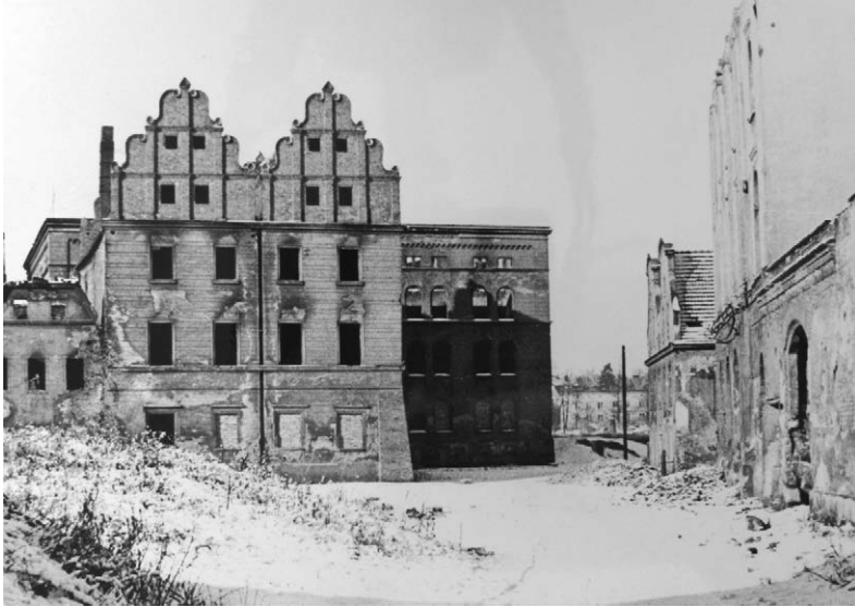
II.5. Zabudowa przy ul. ks. Kądziołki i ul. Wałowej, lata 40./50. (?) XX w.

Z lewej zabytkowe domy przy ul. ks. Józefa Kądziołki – nr 7 w ruinie (dzisiaj już nieistniejący) i nr 9 (z dwoma szczytami) budynek dawnej kapituły kolegiackiej. Z prawej ul. Wałowa – dawny Teatr Miejski i bliźniacza kamieniczka. W głębi dawne koszary przy ul. Daniela Chodowieckiego, na miejscu których wybudowano później szkołę „tysiąclatkę”.