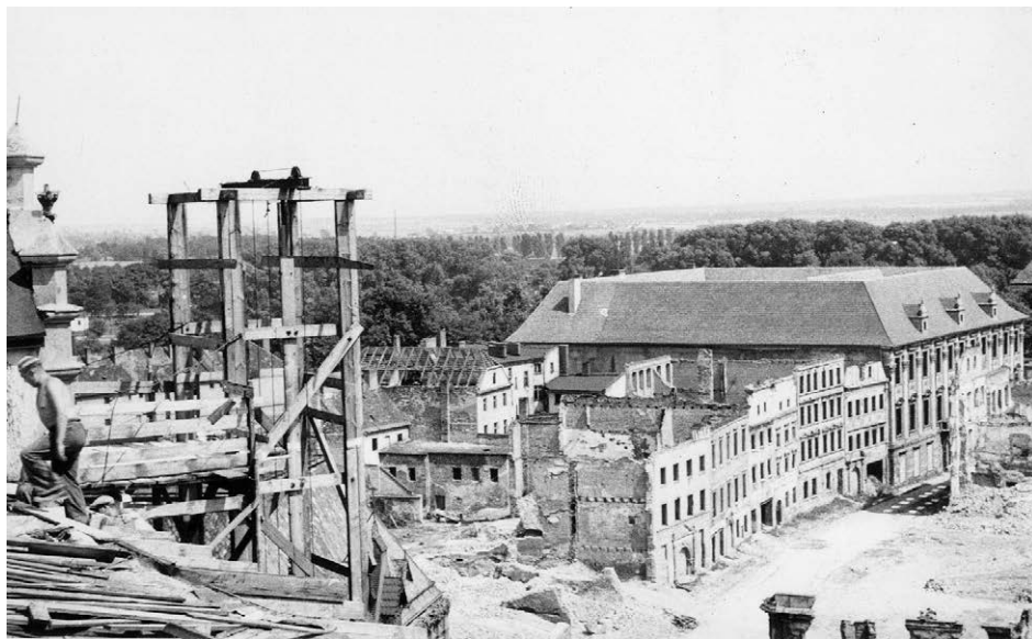
II.19. Odbudowa i postępująca destrukcja zabudowy ul. Biskupa Jarosława, ok. 1949–1950 r. (?)

W głębi pałac biskupi po pracach zabezpieczających. Lokalizację i datę ustalam ze względu na kontekst architektoniczny. Dawny widok zabudowy ulicy: Sikorski, Nysa , s. 14.