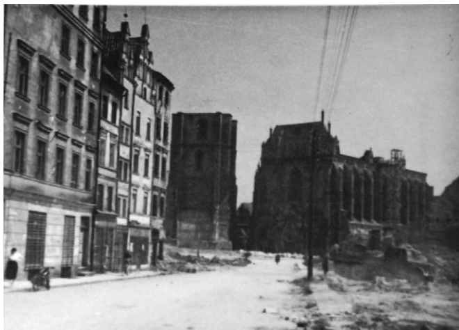
II.25. Rynek po pracach rozbiórkowych – widok na gotycką dzwonicę i kościół św. Jakuba, przed marcem 1957 r.

Z lewej południowa pierzeja zabudowy śródrynkowej. Datę poprawiam ze względu na stan zabudowy (rozebrano już południowo-wschodnią pierzeję Rynku, a kościół jeszcze bez spadzistego dachu). Dawny widok zob. Zalewski, Nysa na dawnej pocztówce , ryc. 26; Nysa jakiej nie znamy. 50 lat w obiektywie Józefa Drzazgi , wyd. 3, Nysa 2007, s. 16.