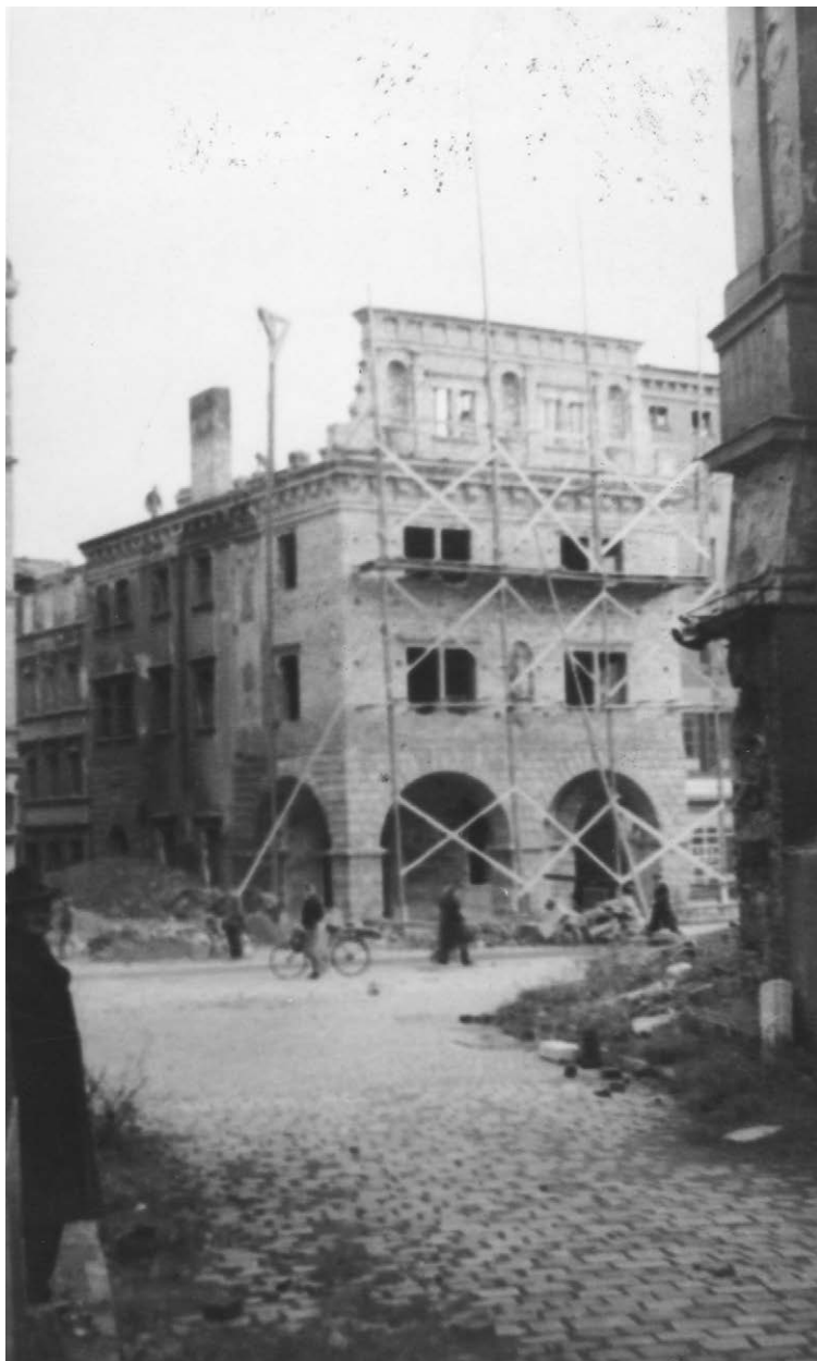
II.7. Odbudowa Domu Wagi Miejskiej, 1947–1948 r.

Widok od strony ul. św. Piotra (uszkodzony narożny dom – Rynek 26). W głębi za Domem Wagi Miejskiej kamienice przy ul. Sukienniczej (nieistniejące dzisiaj). Dawny widok: Czesław Thullie, Zabytki architektoniczne Ziemi Śląskiej na tle rozwoju architektury w Polsce , Katowice 1965, s. 215.