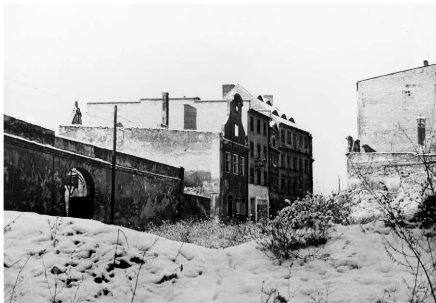
II.22. Ulica Tkacka po pracach rozbiórkowych, lata 50./60. XX w. Z lewej mur z bramą na dziedziniec dawnego Seminarium św. Anny. Dzisiaj w miejscu kamienic stoją bloki mieszkalne.