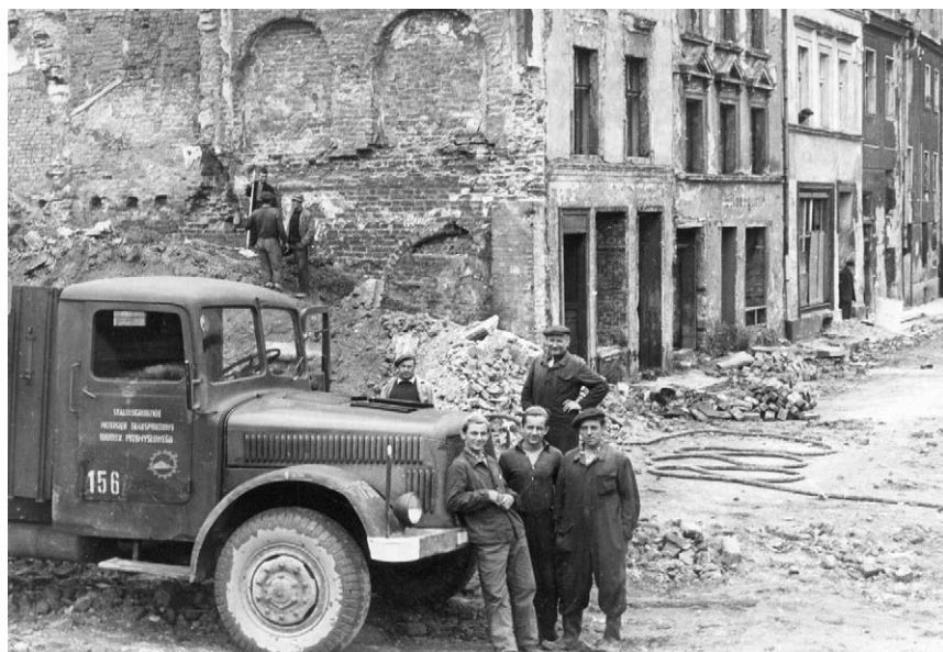
II.21. Prace rozbiórkowe w śródmieściu, 1953–1956 r. Podstawą datowania jest widoczny na zdjęciu samochód ciężarowy Stalinogrodzkiego Przedsiębiorstwa Transportowego Budownictwa Przemysłowego. Źródło: PŚJ. Ruiny, lata 50. [?] XX w., b.a.