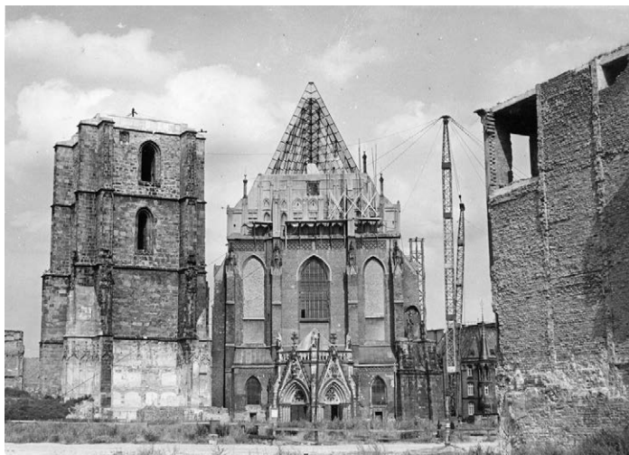
II.38. Drugi etap odbudowy kościoła św. Jakuba, widok od strony Rynku, 1957/58 r.

Źródło: MPN, AF, sygn. 1798,3. Dach, kościół św. Jakuba i św. Agnieszki, lata 50. (?) XX w., Józef Drzazga.