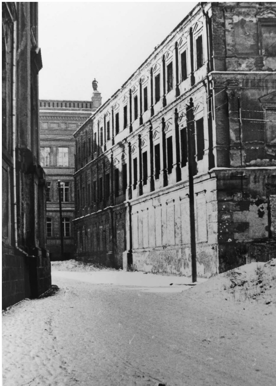
II.32. Seminarium św. Anny (Rynek Solny) po zabezpieczeniu konserwatorskim, lata 50. XX w.

Z lewej fragment bryły kościoła pojezuickiego Wniebowzięcia Najświętszej Marii Panny, z prawej gmach dawnego Seminarium św. Anny. W głębi elewacja ocalałego Domu Macierzystego Zgromadzenia Sióstr Świętej Elżbiety przy ul. Kramarskiej.