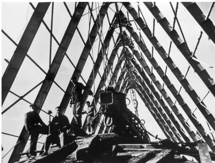
II.37. Montaż stalowej konstrukcji dachu kościoła św. Jakuba, 1957 r.