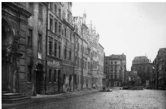
II.24. Widok z ul. Brackiej na Rynek i kościół św. Jakuba, lata 40./50. XX w.

Ul. Bracka, ul. Celna, lata 50./60. XX w., Stanisław Kramarczyk.