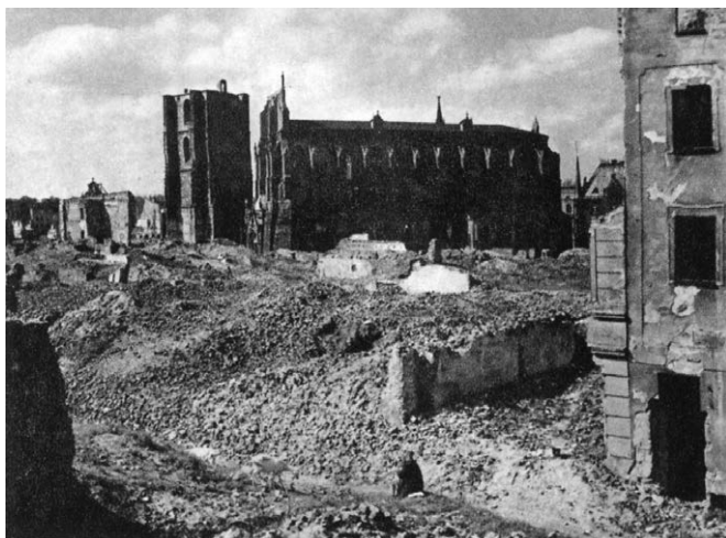
II.26. Śródmieście po pracach rozbiórkowych, przed marcem 1957 r.

Źródło: MPN, AF, sygn. 1432. Dzwonnicza przy kościele św. Jakuba, kościół św. Jakuba i św. Agnieszki, Rynek, lata 50./60. [!] XX w., Stanisław Kramarczyk.