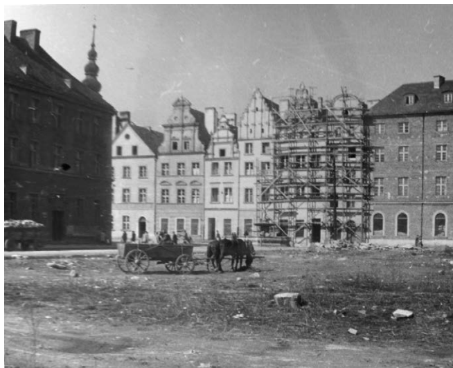
II.23. Renowacja kamieniczek przy ul. Brackiej, lata 50./60. XX w.

Z lewej zachowany dom na rogu ul. Celnej i Brackiej. Na wprost kamieniczki przy ul. Brackiej (przed nimi fontanna Trytona) oraz odbudowany narożny dom ul. Brackiej i Rynku. Z prawej pusty plac po rozebraniu jednej strony ul. Celnej.