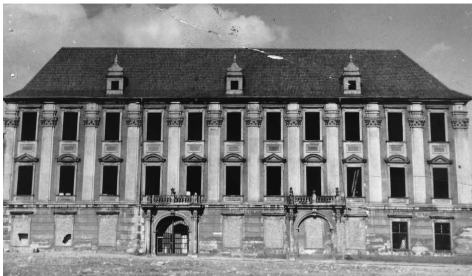
II.20. Pałac biskupi po pracach zabezpieczających, lata 50. (?) XX w.

Główna fasada pałacu biskupiego w Nysie (skrzydło zachodnie, z 1729 r., przy ul. Biskupa Jarosława) po pracach zabezpieczających.