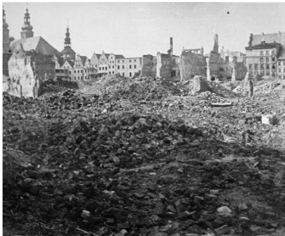
II.27. Śródmieście Nysy po odbudowie i pracach rozbiórkowych, widok od ul. Tkackiej, druga połowa lat 50. XX w.

Na pierwszym planie gruz z rozebranych kamienic pierzei południowo-wschodniej Rynku. W głębi od lewej bryła i dwie wieże kościoła św. Piotra i Pawła, wieża dawnego klasztoru Bożogrobców, odbudowane kamienice przy ul. Brackiej, odbudowane kamienice i ruiny domów w południowo-zachodniej części Rynku. Z prawej zabudowa śródrzynekowa – widoczny spadzisty dach odbudowanego Domu Wagi Miejskiej. Datę precyzują ze względu na stan zabudowy, w kwietniu 1955 r. stało w Rynku jeszcze 30 domów: Dokument Stanisława Kramarczyka dotyczący zniszczeń w śródmieściu Nysy (1955) , ze zbiorów Muzeum Powiatowego w Nysie, „Nyskie Szkice Muzealne”, 9 (2016), s. 194.