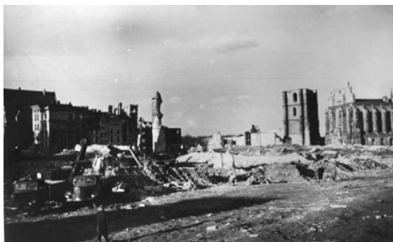
II.28. Śródmieście po rozebraniu południowo-wschodniej pierzei Rynku, widok w stronę ul. Wrocławskiej, lata 50. XX w. (przed marcem 1957 r.)

Źródło: MPN, AF, sygn. 1749/2. Nysa, Śródmieście po pracach rozbiórkowych, widok z ul. Tkackiej. Po 1945 r. [?], Stanisław Kramarczyk.