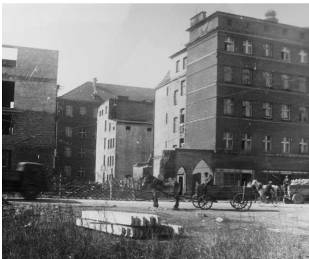
II.35. Budowa bloku mieszkalnego przy ul. Celnej 10, 1956–1957 r.

Źródło: MPN, AF, sygn. 1741. Ulica Celna, lata 50. [?] XX w., Stanisław Kramarczyk.