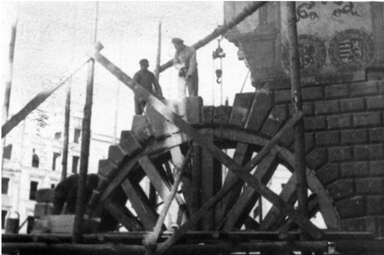
II.6. Pierwszy etap odbudowy Domu Wagi Miejskiej, 1947 r.

Źródło: MPN, AF, sygn. 1714. Teatr, ul. ks. Kądziołki, ul. Wałowa, lata 50. XX w., Stanisław Kramarczyk.