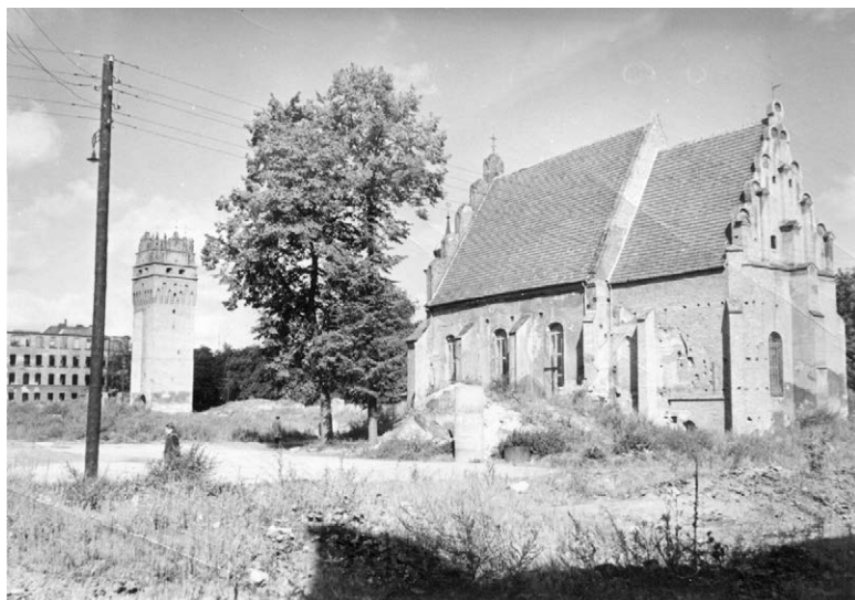
II.17. Odbudowany dawny kościół św. Barbary po rozebraniu okolicznej zabudowy, druga połowa lat 50. (?) XX w.