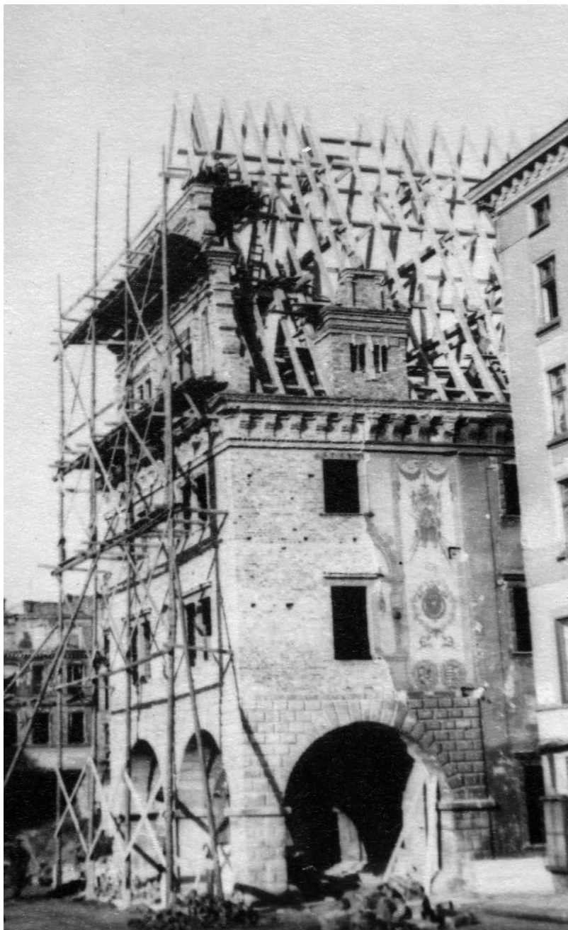
II.8. Odbudowa Domu Wagi Miejskiej, widok od strony południowej, 1947–1948 r. Z prawej na pierwszym planie jedna z ocalałych kamieniczek zabudowy śródrzynekowej. W głębi wypalona kamienica w Rynku.

Źródło: MPN, AF, sygn. 1055. Nysa, Dom Wagi Miejskiej w czasie odbudowy, ok. 1947–1948 r., Stanisław Kramarczyk.