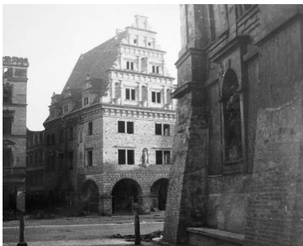
II.14. Odbudowane w Ryнку obiekty – Dom Wagi Miejskiej i dom nr 26, początek lat 50. (?) XX w.