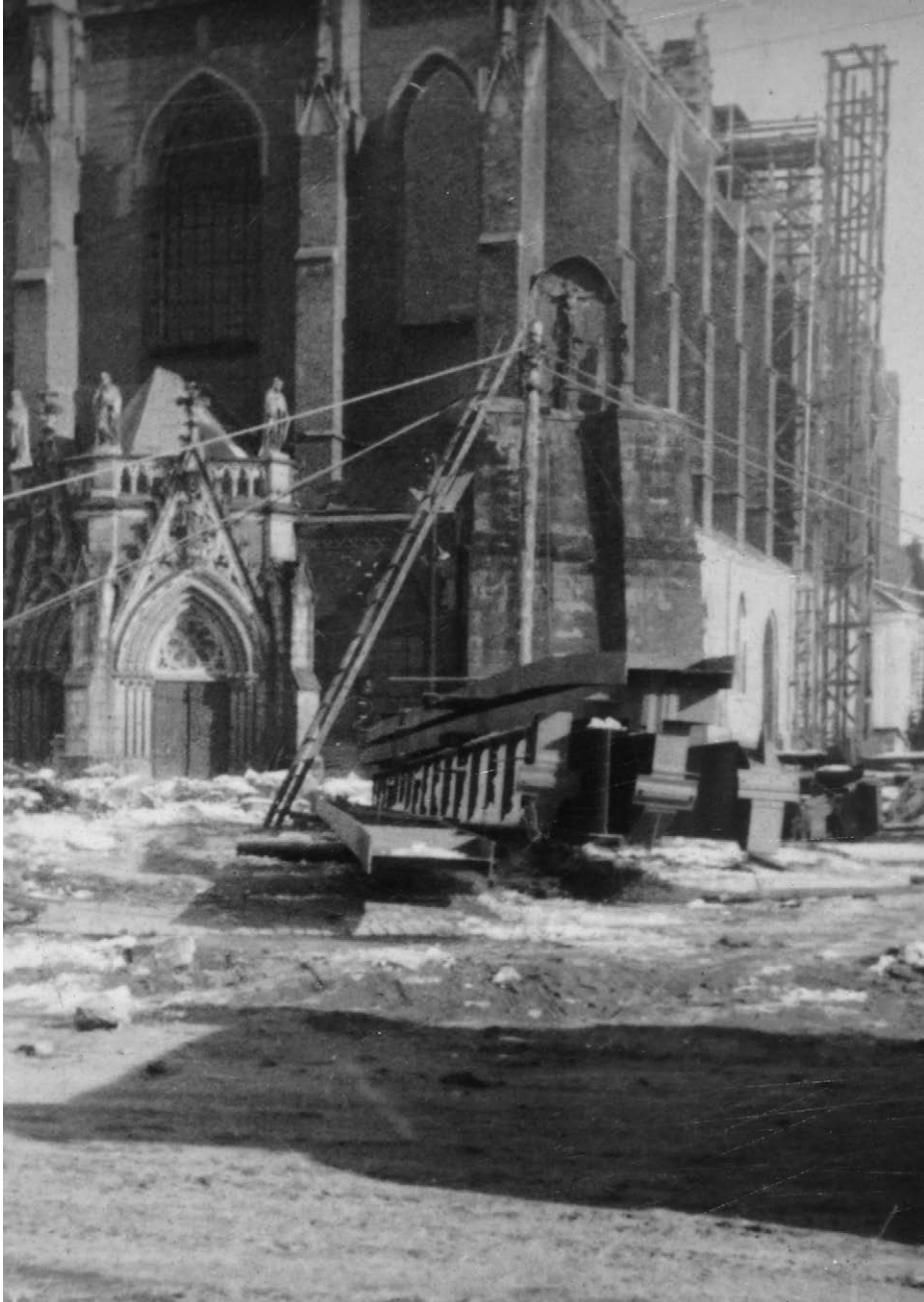
II.36. Drugi etap odbudowy kościoła św. Jakuba, widok od strony Rynku, 1956 r. Widok na fasadę główną i nawę południową kościoła. Datę precyzuję ze względu na stan prac (nie ma jeszcze konstrukcji stalowej na dachu).