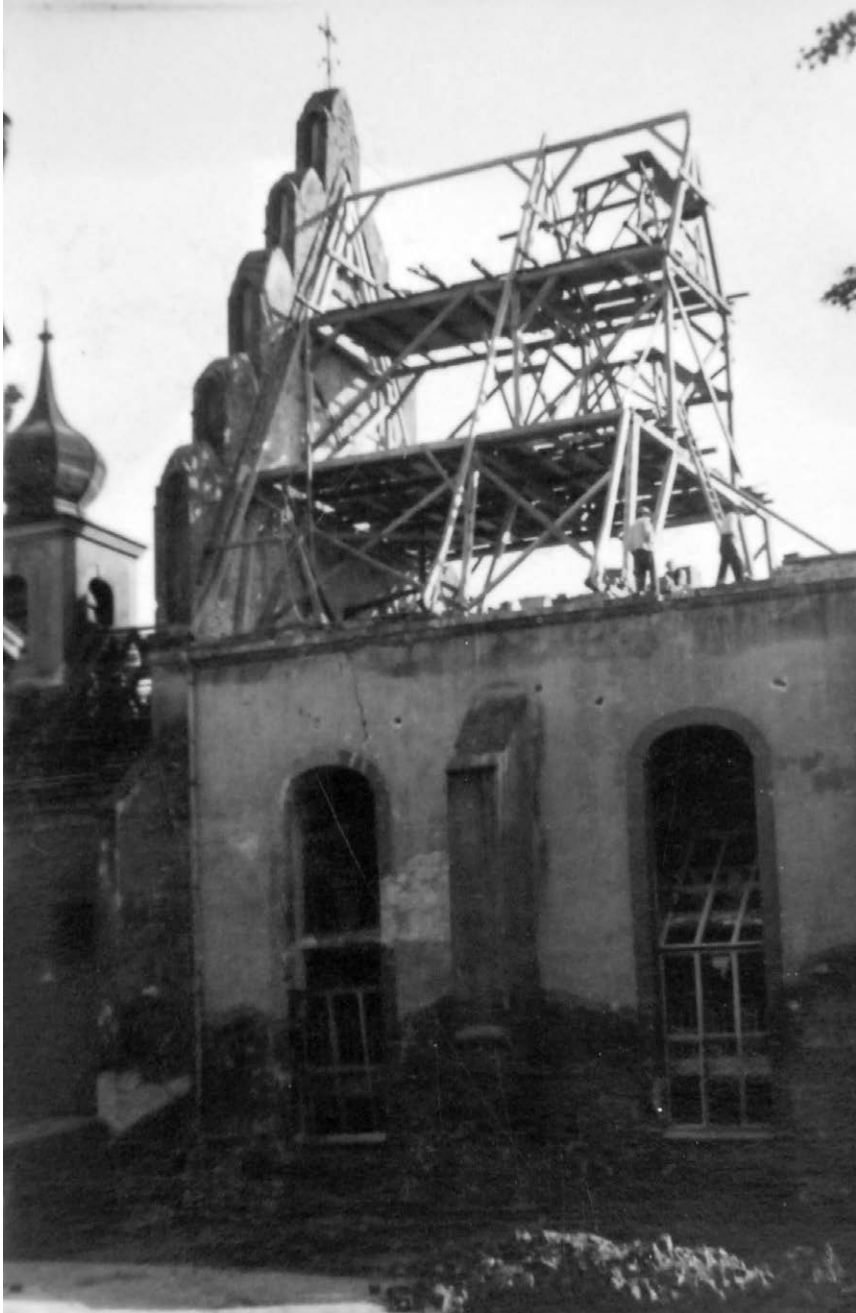
II.2. Odbudowa dachu kościoła św. Barbary, 1947 r. (?)

Datę poprawiam ze względu na widoczny z lewej na pierwszym planie fragment zabudowy.