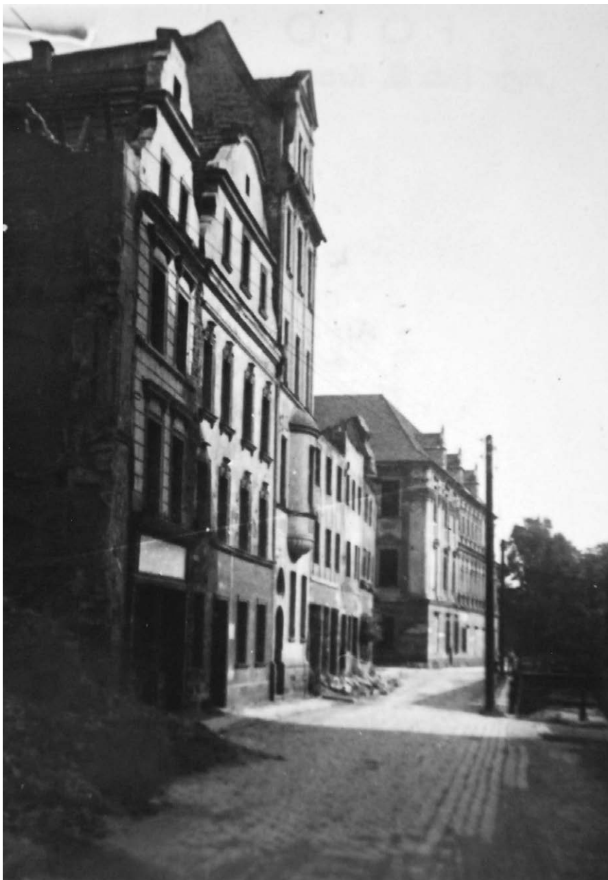
II.33. Ulica Grodzka po odbudowie, lata 50./60. XX w.

Od lewej odbudowane kamienice, w głębi pałac biskupi po pracach zabezpieczających. Odbudowana kamienica na rogu ul. Grodzkiej i Biskupa Jarosława została później rozebrana i postawiono tam blok mieszkalny.