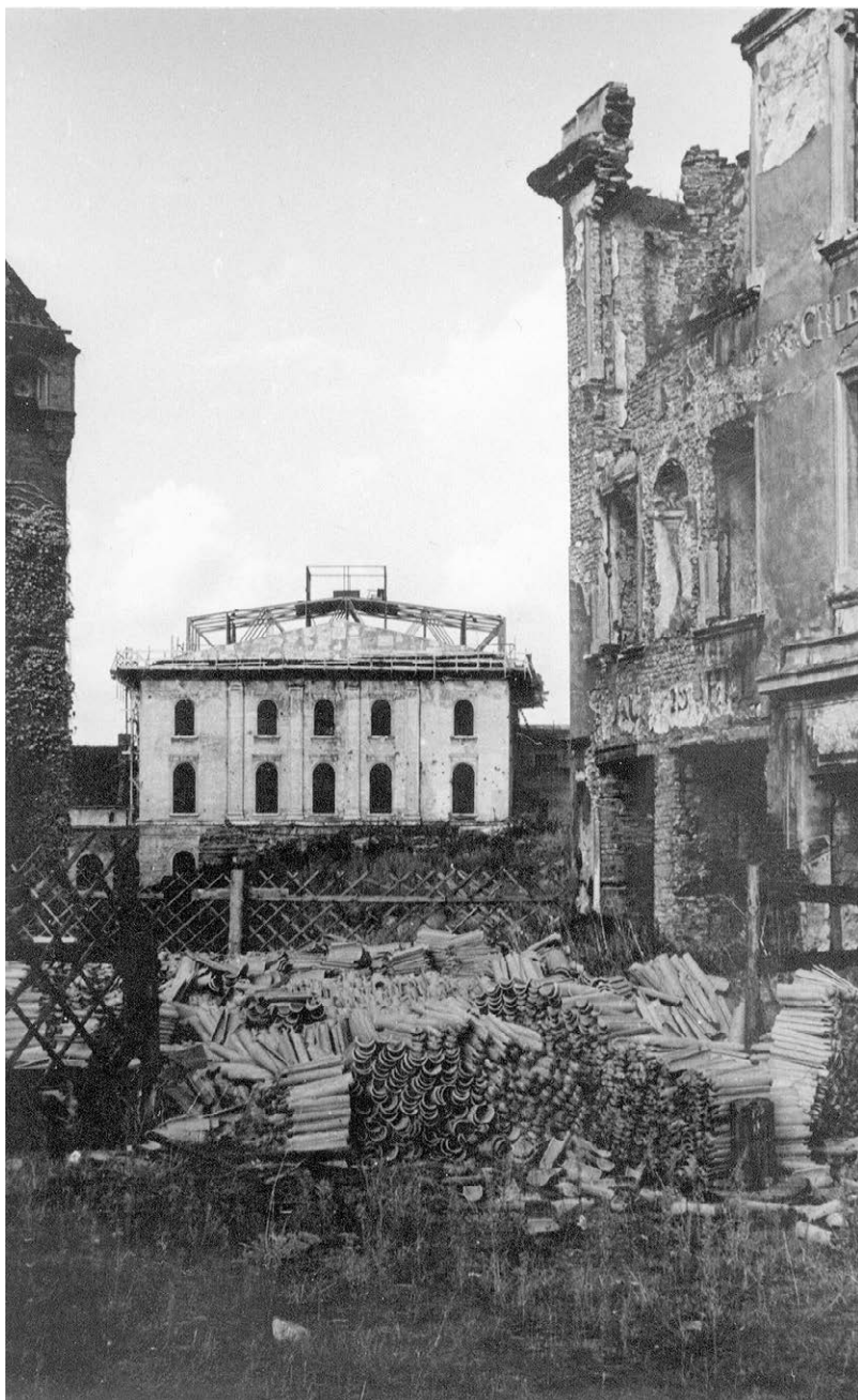
II.18. Budynek dawnego Teatru Miejskiego w trakcie odbudowy, 1958 r. (?)

Na pierwszym planie dachówki ułożone obok ruiny kamienicy przy ul. Wałowej lub ul. Biskupa Jarosława. W głębi koszary przy ul. Daniela Chodowieckiego, na miejscu których wybudowano później szkołę „tysiąclatkę”.