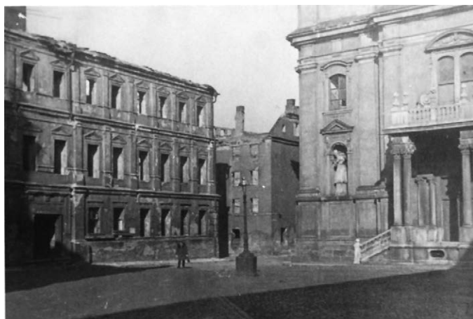
II.31. Rynek Solny, lata 50. (?) XX w.

Źródło: MPN, AF, sygn. 1458. Nysa, widok na zniszczone śródmieście z Domem Wagi i wieżą ratusza, lata 50. [?] XX w., Stanisław Kramarczyk.