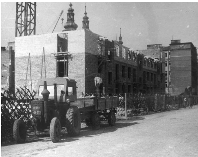
II.34. Budowa bloku mieszkalnego przy ul. Celnej, 1956–1957 r.

W tle dwie wieże kościoła św. Piotra i Pawła, wieża dawnego klasztoru Bożogrobców. Precyzuję datę na podstawie stanu zabudowy i reportażu E. Pochronia z 1957 r. (jest tam fot. J. W. Brzozy z prawie ukończonej budowy tego i sąsiedniego bloku przy ul. Celnej).