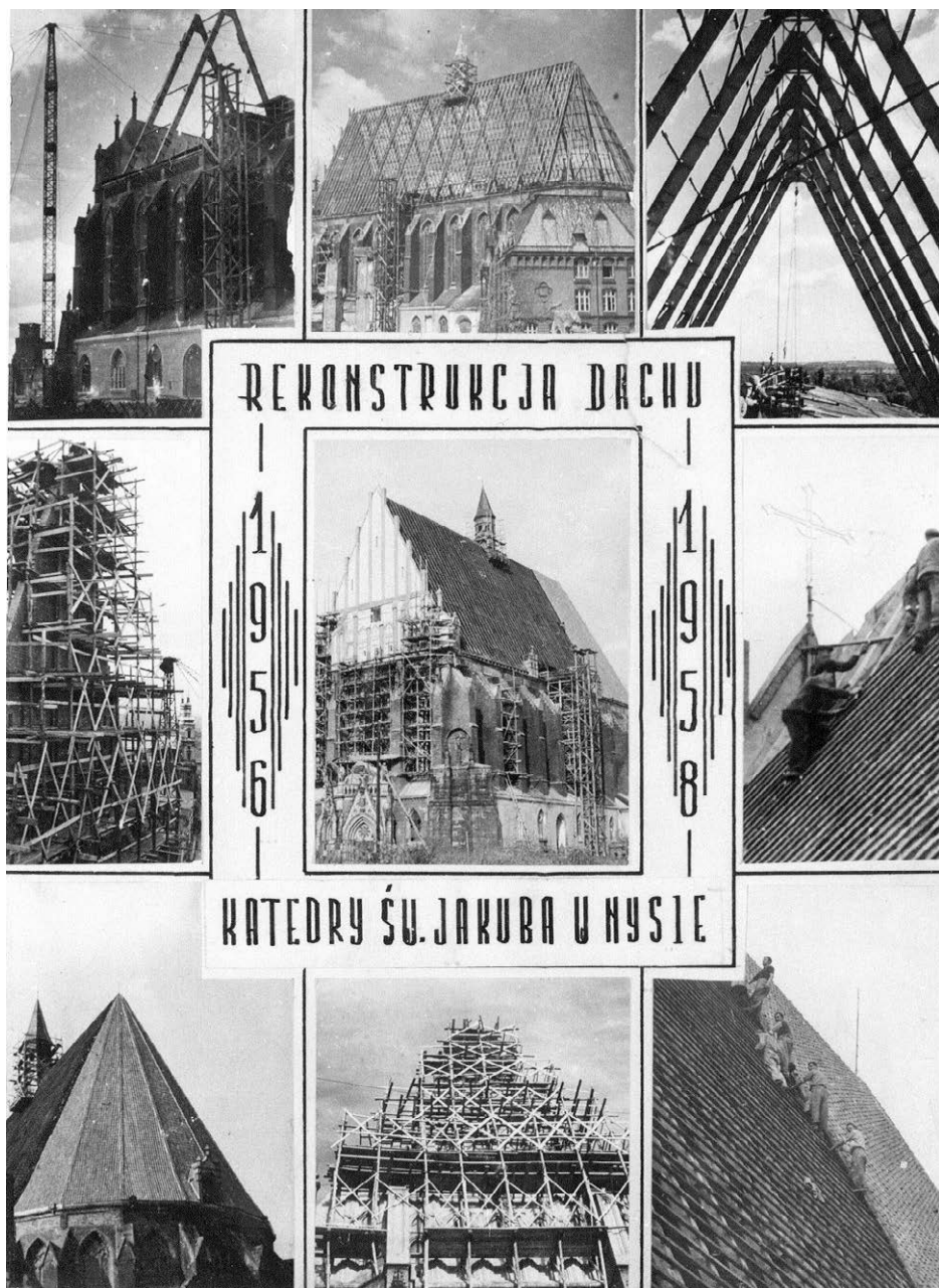
II.41. Rekonstrukcja dachu kościoła św. Jakuba w Nysie, lata 1956–1958

Czarno-biała widokówka prezentująca etapy rekonstrukcji dachu kościoła. Na widokówce użyto słowa katedra, tak bowiem przez kilka powojennych dekad nazywano w Nysie ten kościół.