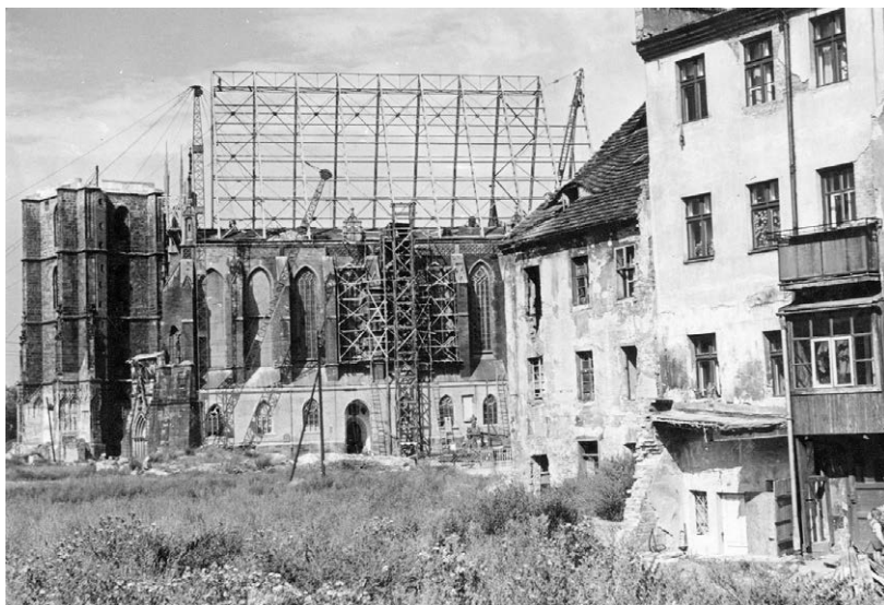
II.40. Drugi etap odbudowy kościoła św. Jakuba, widok od ul. Tkackiej, 1957/58 r.

Na pierwszym planie z prawej domy przy ul. Tkackiej. Za nimi kościół św. Jakuba (z zamontowaną stalową konstrukcją dachu) i gotycka dzwonnica. Datę ustalą na podstawie stanu prac (zob. Sznura, Katedra św. Jakuba ).