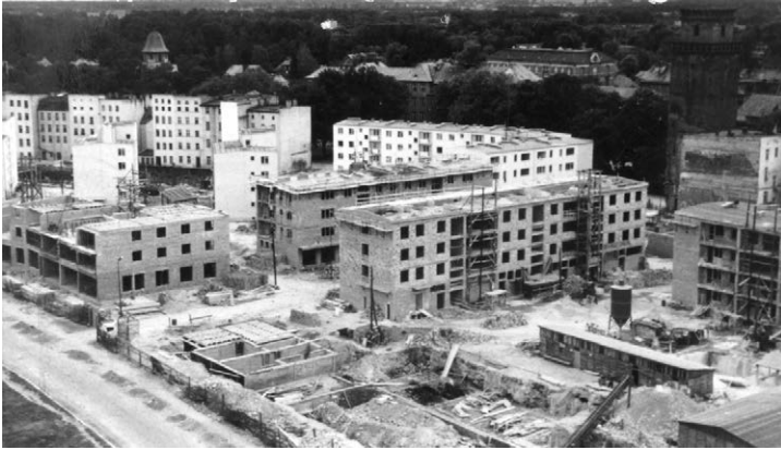
II.46. Nowa zabudowa w śródmieściu, przełom lat 50. i 60. XX w.

Na pierwszym planie fundamenty pod zabudowę i domy wznoszone w północnej części Rynku. Z prawej (od Rynku w kierunku baszty bramy Ziębickiej) bloki mieszkalne budowane przy ul. Bolesława Krzywoustego i Królowej Jadwigi. Od tejże baszty w lewo – nowe domy przy ul. Fryderyka Szopena. W głębi zachowane budynki przy ul. Bohaterów Warszawy i Norwida.