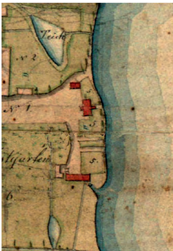
FIG. 9. A manor house with separate avant-corps on a regulatory-restitution map drawn up by Demmler from 1831. Source 3

Jedną z ważnych konsekwencji reformy uwłaszczeniowej było zmniejszenie liczby gospodarstw w samej Lednogórze. Zmiany w strukturze osadniczej wsi możemy zaobserwować także dzięki mapie z 1863 roku, wykonanej na podstawie mapy Demmlera z 1831 roku (ryc. 11). Widzimy na niej w pełni już odłączone Moraczewo, zmniejszoną liczbę zagród w Lednogórze oraz zmienione zabudowania zespołu dworskiego [źródło 6] (ryc. 11).