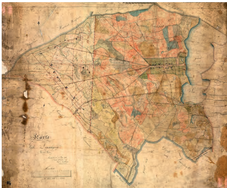
RYC. 3. Lednogóra na mapie uwłaszczeniowo-regulacyjnej Demmlera z 1831 roku. Oprac. D. Tomczyk. Źródło 3