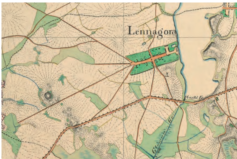
Ryc. 2. Lednogóra na fragmencie mapy z 1830 roku. Źródło 2