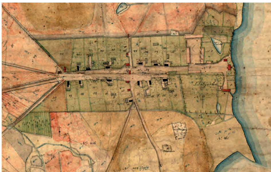
Ryc. 4. Zabudowania wsi Lednogóra, folwark oraz zespół dworski. Fragment mapy uwłaszczeniowo-regulacyjnej Demmlera z 1831 roku.

FIG. 4. The buildings of Lednogóra village, a grange and a manor house. A part of the regulatory-restitution map drawn up by Demmler from 1831.