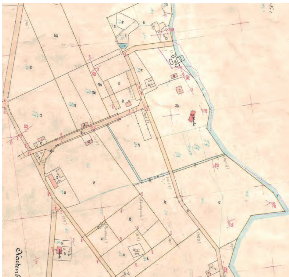
RYC. 12. Fragment mapy katastralnej wsi Lednogóra z 1893 roku. Źródło 5