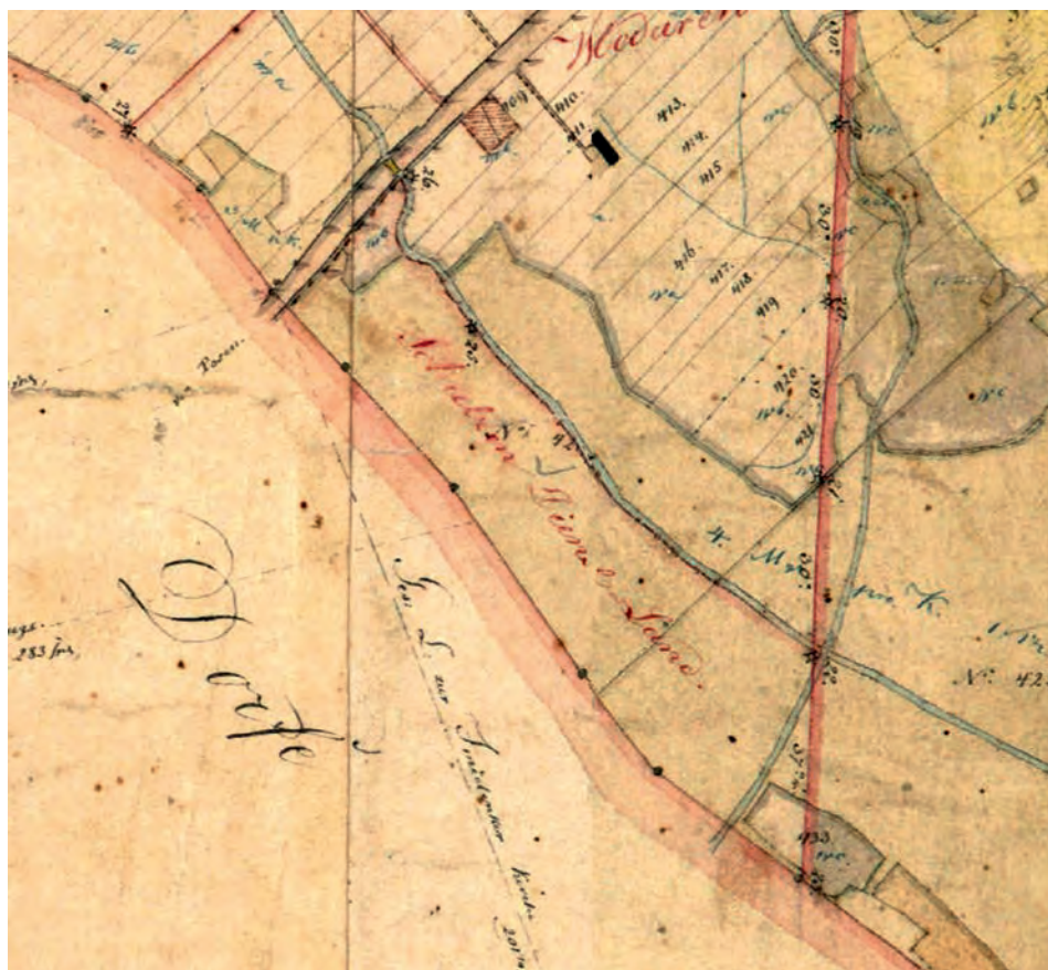
RYC. 8. Grunty sołtysie w Moraczewie ( schulzen dienst land ) na mapie uwłaszczeniowo-regulacyjnej Demmlera z 1831 roku.

FIG. 8. Village administrator's land in Moraczewo ( schulzen dienst land ) on a regulatory-restitution map drawn up by Demmler from 1831.