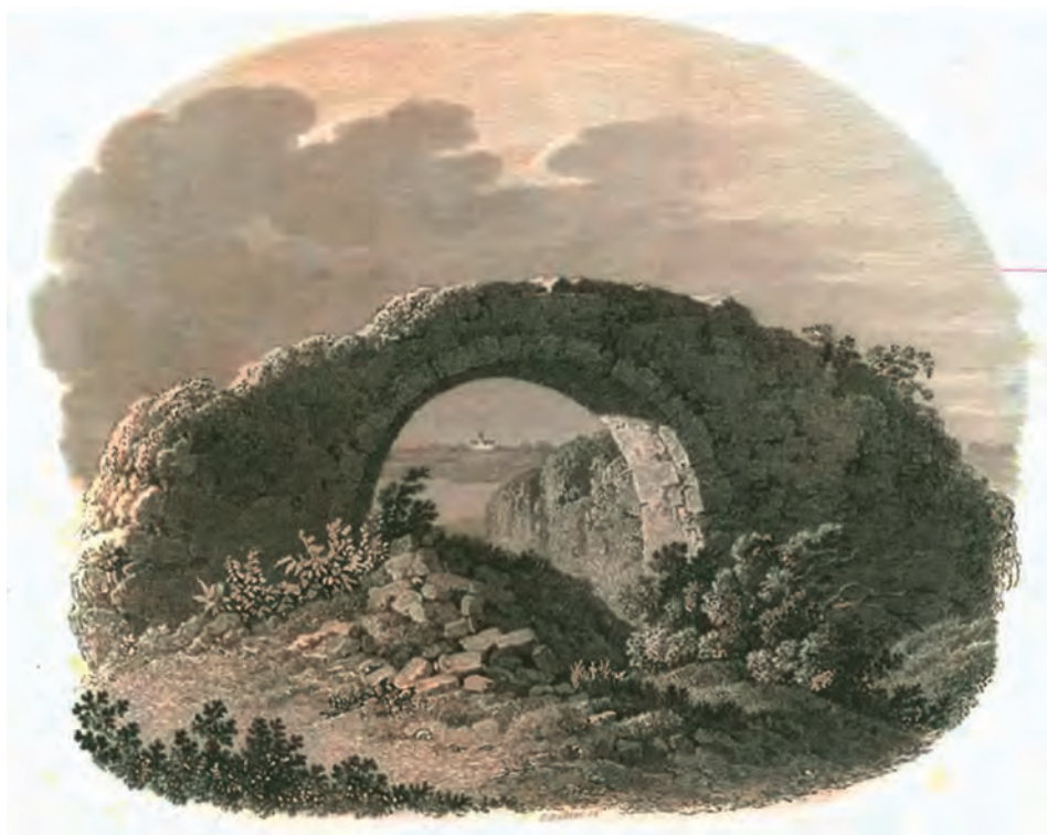
Ryc. 10. Arkada Lednicka na ilustracji ze Wspomnień Wielkopolski Edwarda Raczyńskiego [1843]. W prześwicie arkady – dwór lednogórski