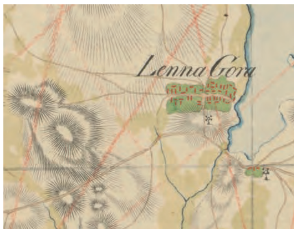
RYC. 1. Lednogóra na fragmencie mapy Davida Gilly'ego z końca XVIII wieku.

(ryc. 2). Widzimy na niej nazwę Piaski Kr.[ug] , wskazującą na istnienie w tym miejscu karczmy. Wśród zabudowań właściwej wsi z łatwością można rozpoznać nad brzegiem jeziora zabudowę folwarczną, usytuowaną wokół obszernego prostokątnego podwórza. Na południe od zabudowań miejscowości zaznaczono wiatrak. Interesującym szczegółem są także wyraźnie odwzorowane wały grodziska wczesnośredniowiecznego w Moraczewie. W zachodniej części ówczesnej Lednogóry znajdował się las.