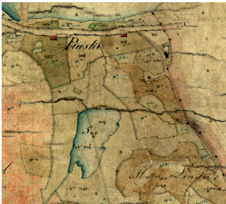
RYC. 5. Przysiółek Piaski w Lednogórze na mapie uwłaszczeniowo-regulacyjnej Demmlera z 1831 roku. Źródło 3