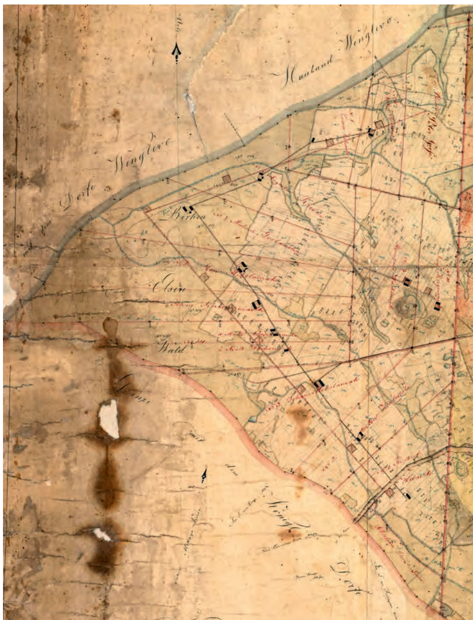
RYC. 7. Nowo utworzone gospodarstwa włościańskie w Moraczewie, na mapie uwłaszczeniowo-regulacyjnej Demmlera z 1831 roku.