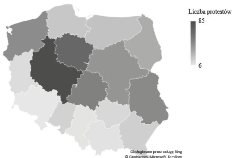
Mapa 1. Protesty rolników w Polsce 2012–2022 w województwach [bez Warszawy]

Z tego powodu zdecydowaliśmy się prezentować dane bez protestów, które odbyły się w Warszawie (mapa 1). Poza oczywistym walorem przejrzystości taki sposób obrazowania danych geograficznych pozwala wysnuwać wnioski w kontekście posiadanych zasobów przez organizacje rolnicze oraz sposobu ich mobilizacji.