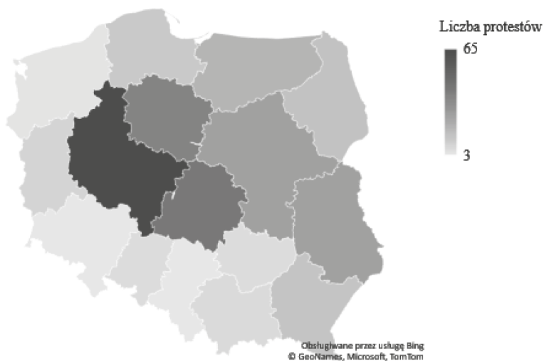
Mapa 2. Protesty Agrounii w Polsce 2012–2022 w województwach (bez Warszawy)