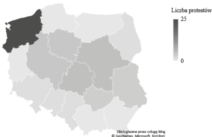
Mapa 4. Protesty NSZZ RI S w Polsce 2012–2022 w województwach [bez Warszawy]