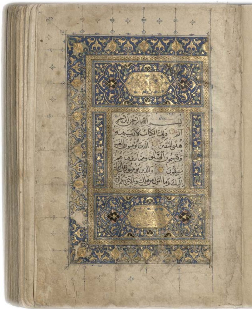
Il. 3. Początek sury II; zdobienia nawiązują do szkoły z Szirazu. BK 2676