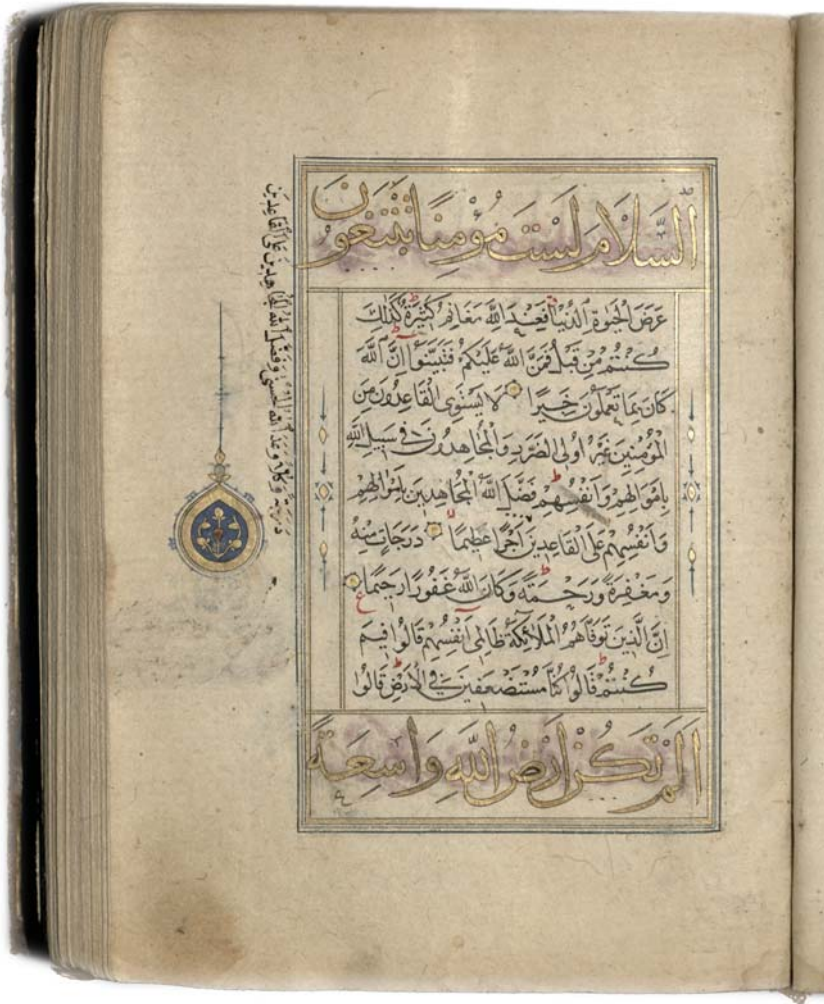
Il. 4. Fragment sury IV; na marginesie ozdobna šamsa oraz fragment uzupełnionego tekstu. BK 2676