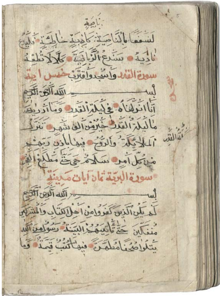
Il. 1. Sura XCVII i początek sury XCVIII, BK 1716