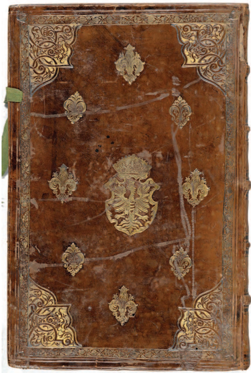
Il. 10. Oprawa z superekslibrisem (dedykacyjnym?) króla Stefana Batorego, intrologator anonimowy, Kraków, prawdopodobnie 1584; Biblioteka Królewska w Sztokholmie