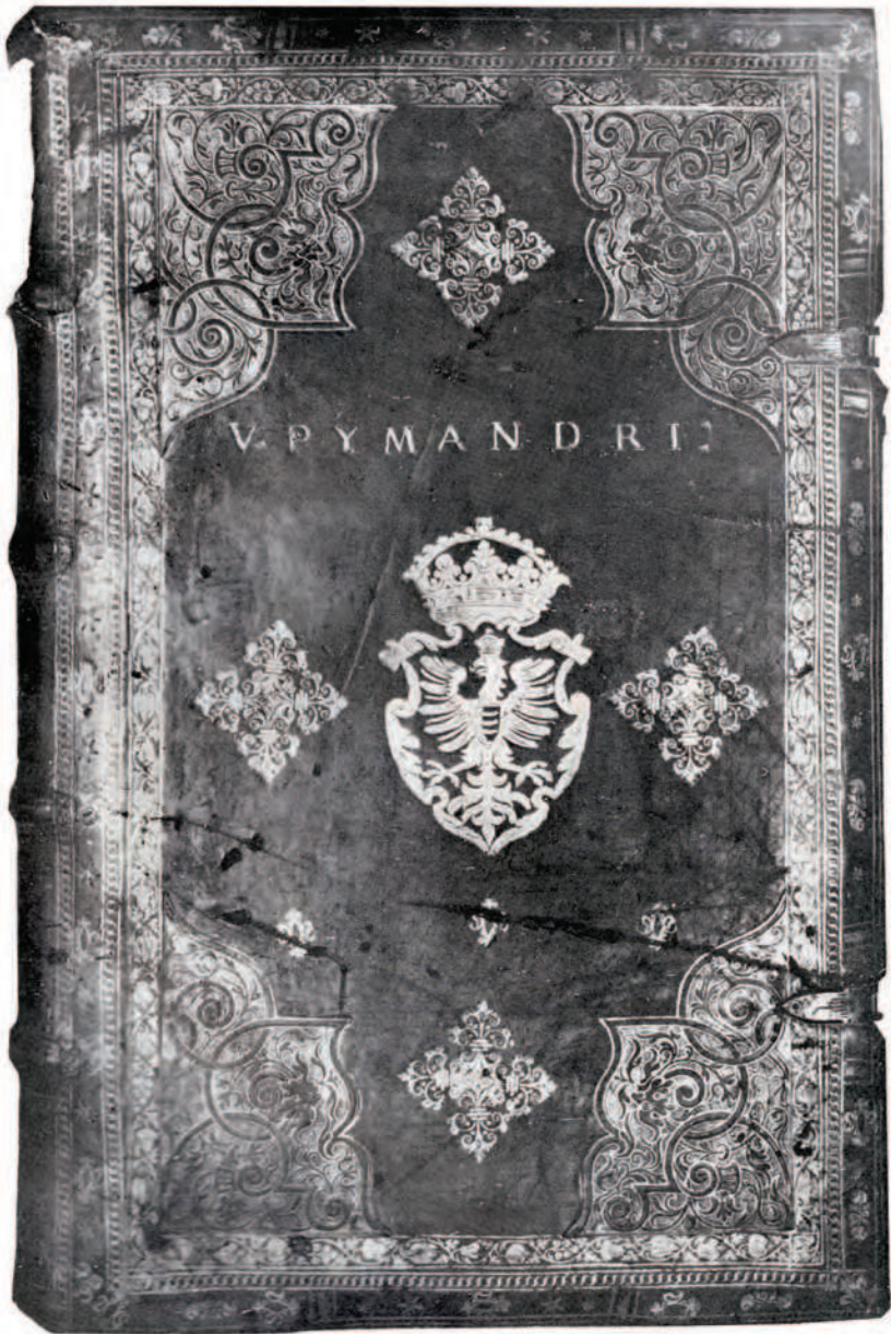
Il. 11. Oprawa z supereklibrisem (dedykacyjnym?) króla Stefana Batorego, introligator anonimowy, Kraków, prawdopodobnie 1586; dawne zbiory Biblioteki Kapitulnej w Gnieźnie