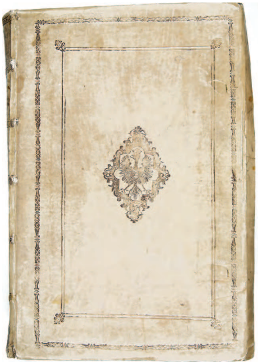
Il. 9. Oprawa z superekslibrisem króla Stefana Batorego, introligator anonimowy, Kraków?, po 1576; Muzeum Narodowe w Krakowie