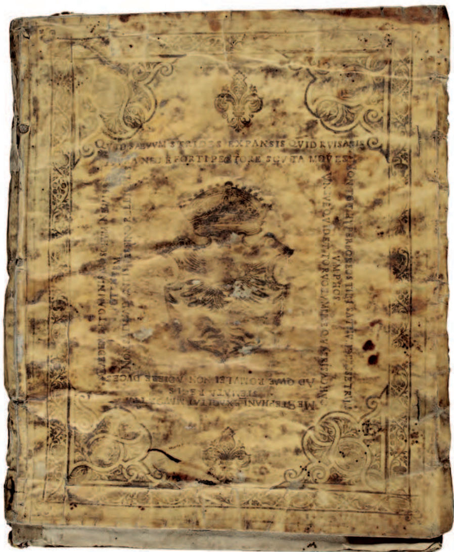
Il. 12. Oprawa z supereklibrisem dedykacyjnym króla Stefana Batorego, introligator anonimowy, Kraków, 1583; Biblioteka Wyższego Seminarium Duchownego we Włocławku