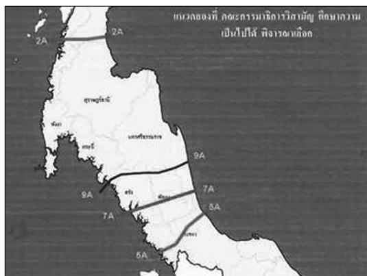
Rys. 3. Mapa potencjalnych tras budowy Kanału Kra.

W przeszłości brano pod uwagę 12 miejsc przekopania kanału, jednak po dokładniejszym rozpatrzeniu tych propozycji wybrano 4 jako najbardziej ekonomiczne i korzystne dla Tajlandii. Przedstawia je poniższa mapa.