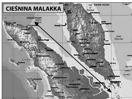
Rys. 1. Mapa Cieśniny Malakka.

Cieśnina Malakka, mająca ok. 402 km szerokości u swego północnego krańca, a ok. 16 km przy południowym, oddziela indonezyjską wyspę Sumatra od Półwyspu Malajskiego, na którego końcu znajduje się bogaty Singapur. Setki rzek uchodzących do cieśniny porośnięte są namorzynami i tworzą bagniste brzegi oraz dziesiątki wysp, raf i mielizn, będących doskonałą kryjówką dla współczesnych piratów.