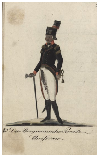
Fot. 1. Projekt paradnego munduru górniczego, 1804