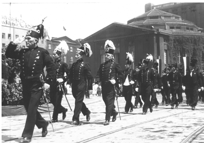
Fot. 4. Górniczy w czasie parady z okazji 15-lecia II Rzeczypospolitej w Katowicach, 1937