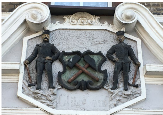
Fot. 3. Górnicy w mundurach freibergskich. Kartusz kamienicy w Chorzowie.