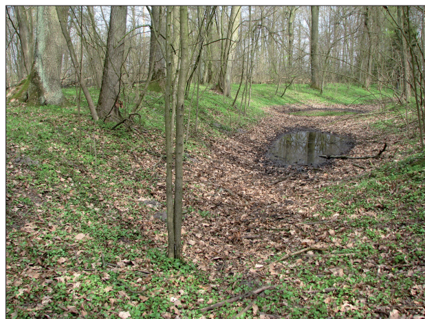
Ryc. 4. Dzieńcioły, pow. łosicki. Widok na dodatkowy wał obwodowy zarejestrowany w fosie wewnętrznego grodziska Dawne Okopy .

W północno-wschodniej ćwiartce majdanu usytuowany jest niewielki, pierścieniowaty gródek. Od przestrzeni użytkowej właściwego grodziska jest on odcięty dodatkowym rowem (Ryc. 3:19), który łączy się z opisaną powyżej wewnętrzną fosą okalającą majdan właściwego grodziska (Ryc. 3:14). Kształt najmniejszej fortyfikacji jest idealnie okrągły, a jej średnica wraz z wałami to ok. 40 m (Ryc. 3:20), przy współczesnej szerokości majdanu szacowanej na 18 m (Ryc. 3:21). Wysokość wału