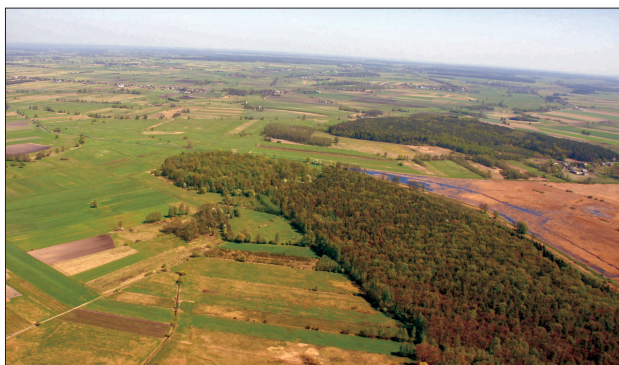
Ryc. 2. Dzięcioły, pow. łosicki. Widok grodziska Dawne Okopy od południowego zachodu.

Ryc. 2. Dzięcioły, Łosice County. View to the Dawne Okopy stronghold from SW.