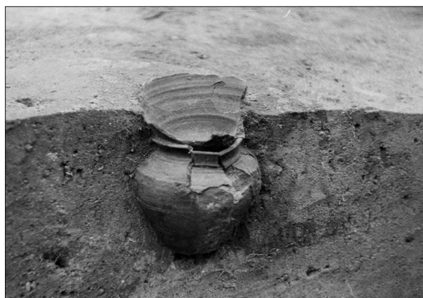
Ryc. 3. Ż d ź a r ó w, pow. sochaczewski, stan. 1. Naczynia toczona na kole wkopane w strop grobu 103.