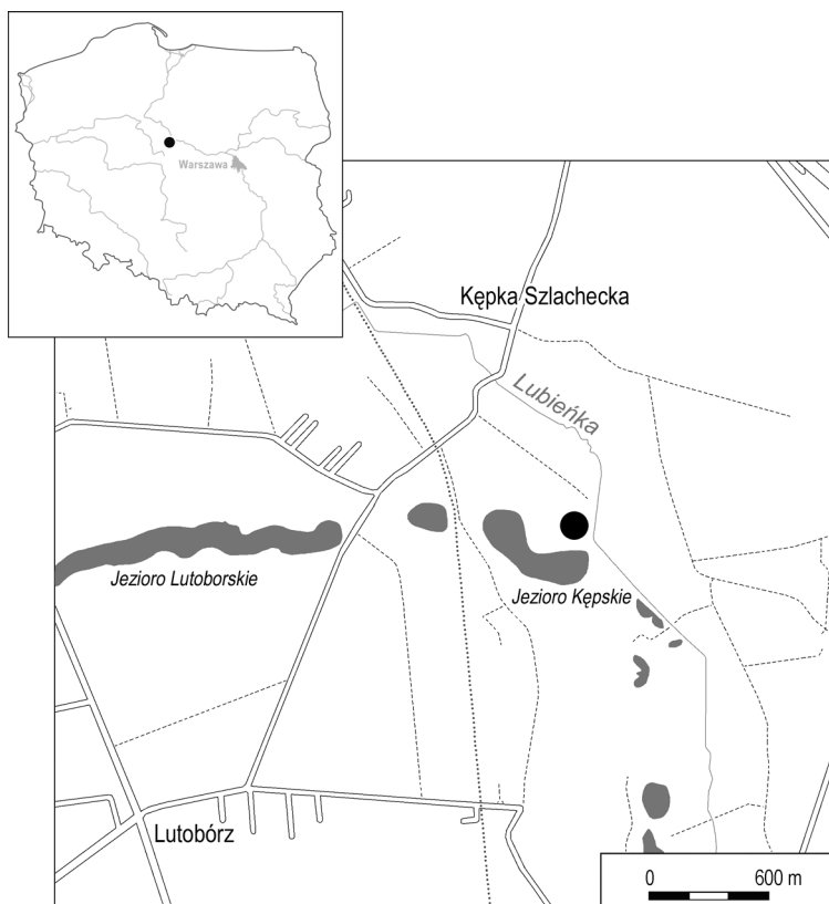
Ryc. 1. Kępka Szlachecka, pow. włocławski. Lokalizacja cmentarzyska. Oprac.: T. Purowski Fig. 1. Kępka Szlachecka, Włocławek County. Location of the cemetery. Graphics: T. Purowski