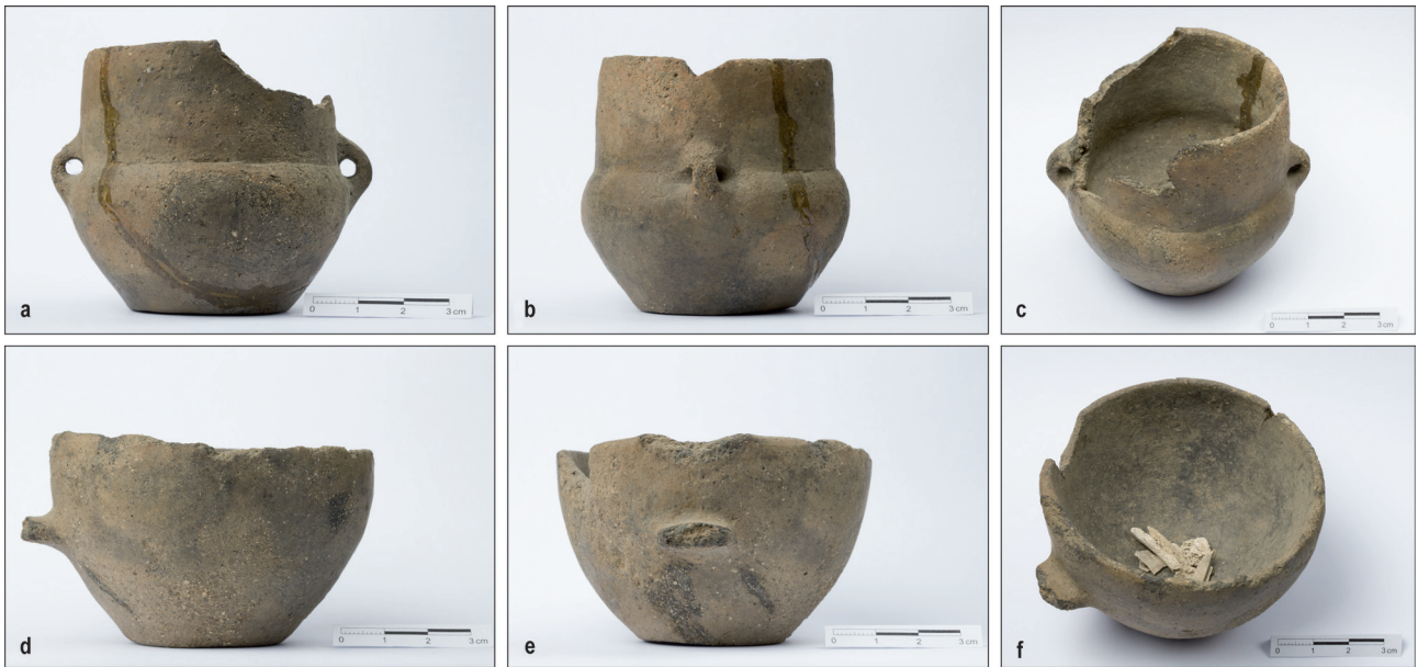
Ryc. 2. Kępka Szlachecka, pow. włocławski. Naczynia gliniane: a–c – amfora; d–f – czerpak/kubek. Fig. 2. Kępka Szlachecka, Włocławek County. Clay pots: a–c – amphora; d–f – ladle/mug.

(Ryc. 2:a–c). 2. Zachowany niemal w całości niewielki czerpak lub kubek 2 (brakuje większej części uszka oraz drobnych fragmentów wylewu). Uszko łączyło brzusec z krawędzią wylewu (pierwotnie wystawało ponad tę krawędź). Dno jest płaskie i niewyodrębnione. Powierzchnie zewnętrzna i wewnętrzna są wygładzone i mają barwę brązowo-szarą. Wys. 4,8–5,3 cm, średn. dna ok. 4,0 cm, wylewu 8,0 cm (Ryc. 2:d–f). 3. Kilka drobnych przepalonych kości ludzkich (Ryc. 2:f).