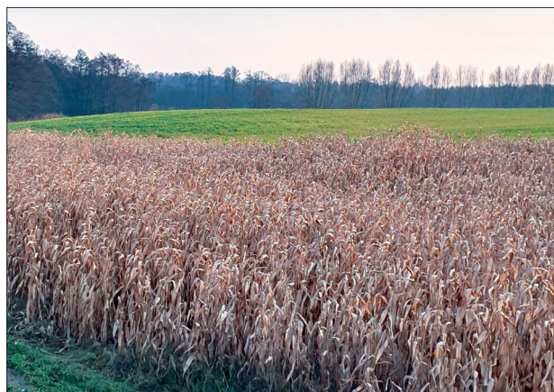
Ryc. 4. Kępka Szlachecka, pow. wrocławski. Widok na stanowisko 6.

AFFELSKI J., IGNACZAK M. 2018: Cmentarzysko płaskie społeczności kultury łużyckiej , [w:] P. Chachlikowski, A. Romańska (red.), Przeszłość wpisana w kamień. Obrzędowe i siedliskowe formy użytkowania stanowisk 9 i 10