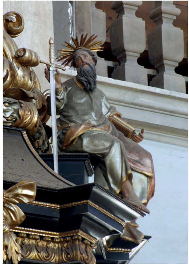
6 Georg Schrötter, Figura św. Pawła, ambona w kościele Świętej Rodziny w Chełmsku Śląskim, 1686. Fot. Artur Kolbiarz

Zakres ich obowiązków znajduje wyraźne odzwierciedlenie w wysokości honorariów. Zdecydowanie najczęściej zarabiał Kose, który nierzadko pobierał wynagrodzenia rzędu stu i więcej talarów 76 , a w wyjątkowych