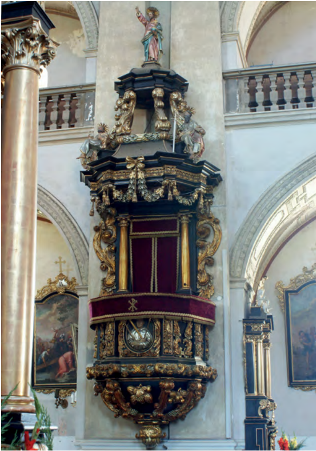
5 Stephan Kose (snycerka i stolarka), Georg Schrötter (rzeźba figuralna), ambona w kościele Świętej Rodziny w Chełmsku Śląskim, 1686.