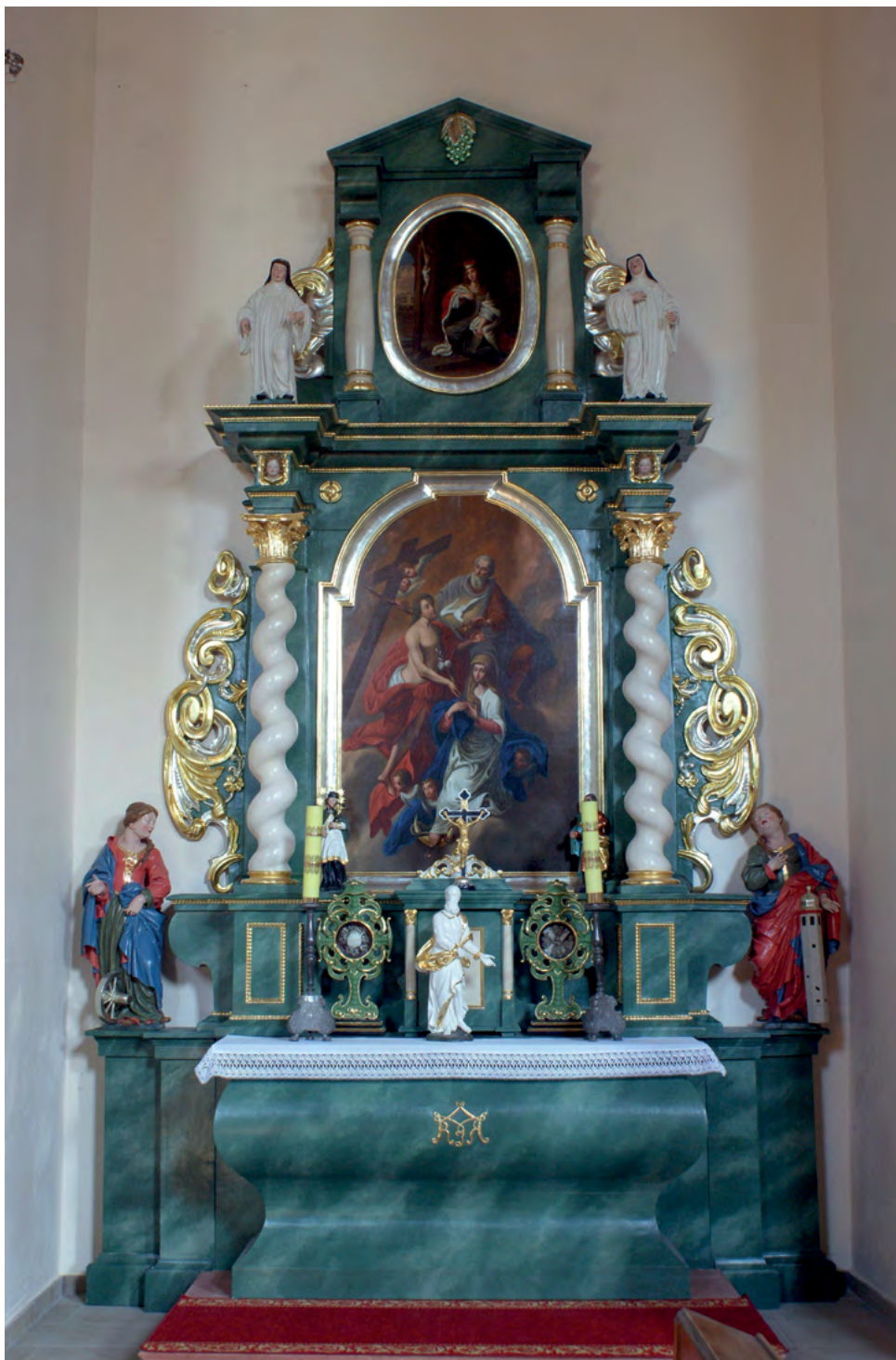
2 Matthäus Knote (atryb. dolnej kondygnacji z głównymi figurami), ołtarz Wniebowzięcia Najświętszej Marii Panny w kościele Narodzenia Najświętszej Marii Panny w Okrzeszynie, ok. 1662–1668.

dominium krzeszowskich mnichów – nie zachowały się ani w oryginalnej postaci, ani w pierwotnym kontekście. Żadnej z nich nie wymieniają protokoły wizytacyjne z lat 1667–1668. Najbardziej prawdopodobne wydaje się ich przeniesienie około 1728 r., z burzonego w tym czasie średniowiecznego kościoła opackiego w Krzeszowie.