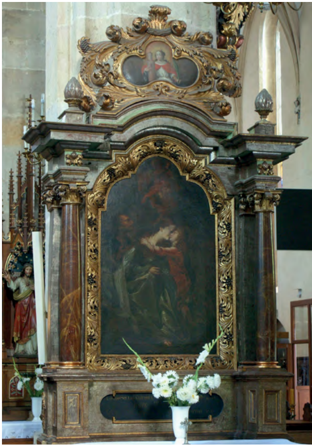
7 Stephan Kose lub Christoph Hoffmann, ołtarz Świętej Rodziny w kościele św. Marcina w Jaworze, 1695.

Jest to tym bardziej prawdopodobne, że w tym czasie w Lubawce istniał tylko jeden warsztat stolarski 109 . Zupełnie enigmatyczną postacią pozostaje natomiast rzeźbiarz Jung z Chełmska Śląskiego, wprowadzony