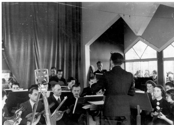
Ilustracja 4. Transmisja koncertu Gdy zadźwięczą mandoliny w wykonaniu Orkiestry Koła Mandolinistów „Hejnał” z Pawilonu Targów Wschodnich we Lwowie z dnia 12 września 1937 roku.