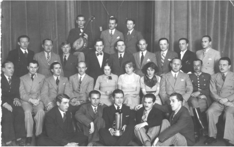
Ilustracja 8. Uczestnicy konkursu kompozytorskiego Wesołej Lwowskiej Fali z dnia 30 września 1934 roku.