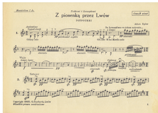
Ilustracja 10. Fragment głosu mandoliny IA z potpourri Z piosenką przez Lwów .