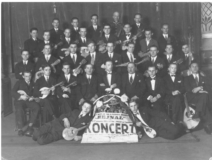
Ilustracja 2. Koncert „Hejnalu” w Sali Stowarzyszenia „Gwiazda” w dniu 27 października 1928 roku.