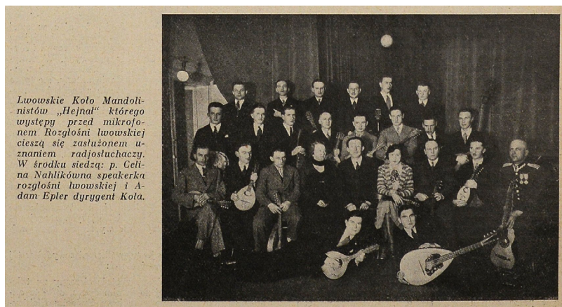
Ilustracja 3. Radiowe zdjęcie „Hejnału” z 1931 roku.

zainauguowało swoją działalność 15 stycznia 1930 roku 31 , a już 17 maja 1931 roku w czasopiśmie „Radio” ukazało się zdjęcie orkiestry wraz z podpisem: „Lwowskie Koło Mandolinistów »Hejnał« którego występy przed mikrofonem Rozgłośni lwowskiej cieszą się zasłużonym uznaniem radiosłuchaczy” 32 .