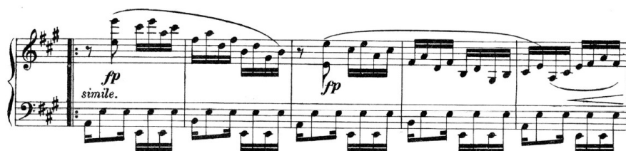
Przykład 2. Alberto Nepomuceno, Galhofeira op. 13 nr 4, t. 5–9

Jak zauważa do Lago, Milhaud wykorzystał do skonstruowania maxixe materiał zaczerpnięty z twórczości kompozytorów latynoamerykańskich 33 . Wśród użytych kompozycji autor wymienia Galhofeira A. Nepomuceno (1894), Cateretê do Almofadinha P. L. Halliera oraz Ferramenta E. Nazaretha (1905). Z uwagi na fakt, że Milhaud niejednokrotnie wspominał, iż grywał przy pianinie utwory wymienionych twórców celem zrozumienia istoty muzyki brazylijskiej, inspiracja ta jest oczywista. Linii melodycznej pochodzącej z Cateretê do Almofadinha 34 towarzyszy akompaniament naśladujący brazylijskie kompozycje fortepianowe.