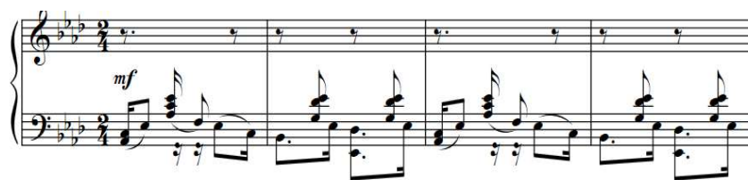
Przykład 3. Ernesto Nazareth, Ferramenta , początek utworu