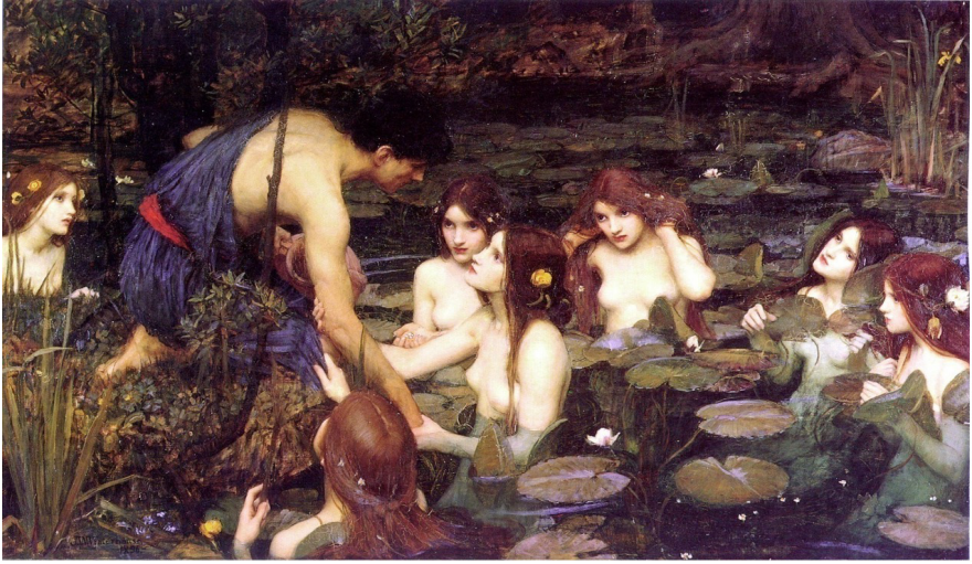
Ilustracja 1. J.W. Waterhouse, Hylas i nimfy