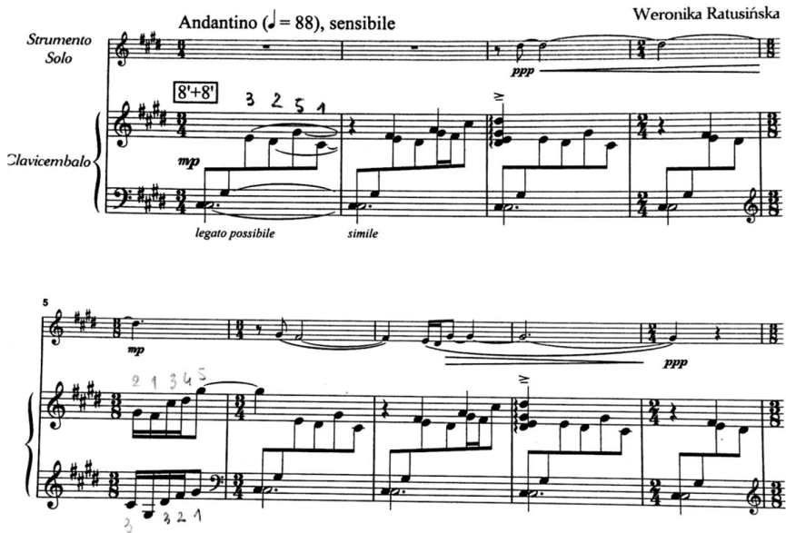
Przykład 2. W. Ratusińska-Zamuszko, Nereidy – styl brisé