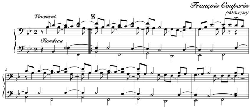
Przykład 1. F. Couperin, Les Barricades mystérieuses – styl brisé