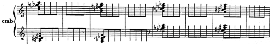
Przykład 5. H.M. Górecki, Koncert na klawesyn i orkiestrę op. 40 – akordowa struktura motoryczna

Zaprezentowane niżej przykłady (przykłady 5. i 6.) pokazują charakterystyczną dla muzyki klawiszowej fakturę motoryczną, w której całe piony akordowe są w szybkim tempie powtarzane.