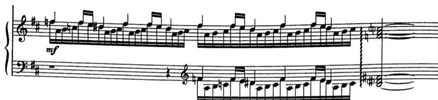
Przykład 13. W. Ratusińska-Zamuszko, Oready – Circulatio