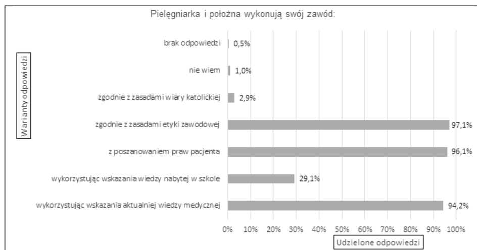
Rycina 1. Odpowiedzi ankietowanych na pytanie wielokrotnego wyboru: „Pielęgniarka i położna wykonują swój zawód...”

Na pytanie o to, z ilu rozdziałów składa się ustawa, prawidłowej odpowiedzi udzieliło 16,9% (n = 35) ankietowanych, a 96% (n = 198) wiedziało, że zawody pielęgniarki i położnej są samodzielne. W jaki sposób pielęgniarki i położne powinny wykonywać swój zawód prawidłowo odpowiedziało ponad 90% badanych (zgodnie z zasadami etyki zawodowej, z poszanowaniem praw pacjenta i wykorzystując wskazania aktualnej wiedzy medycznej) (rycina 1).