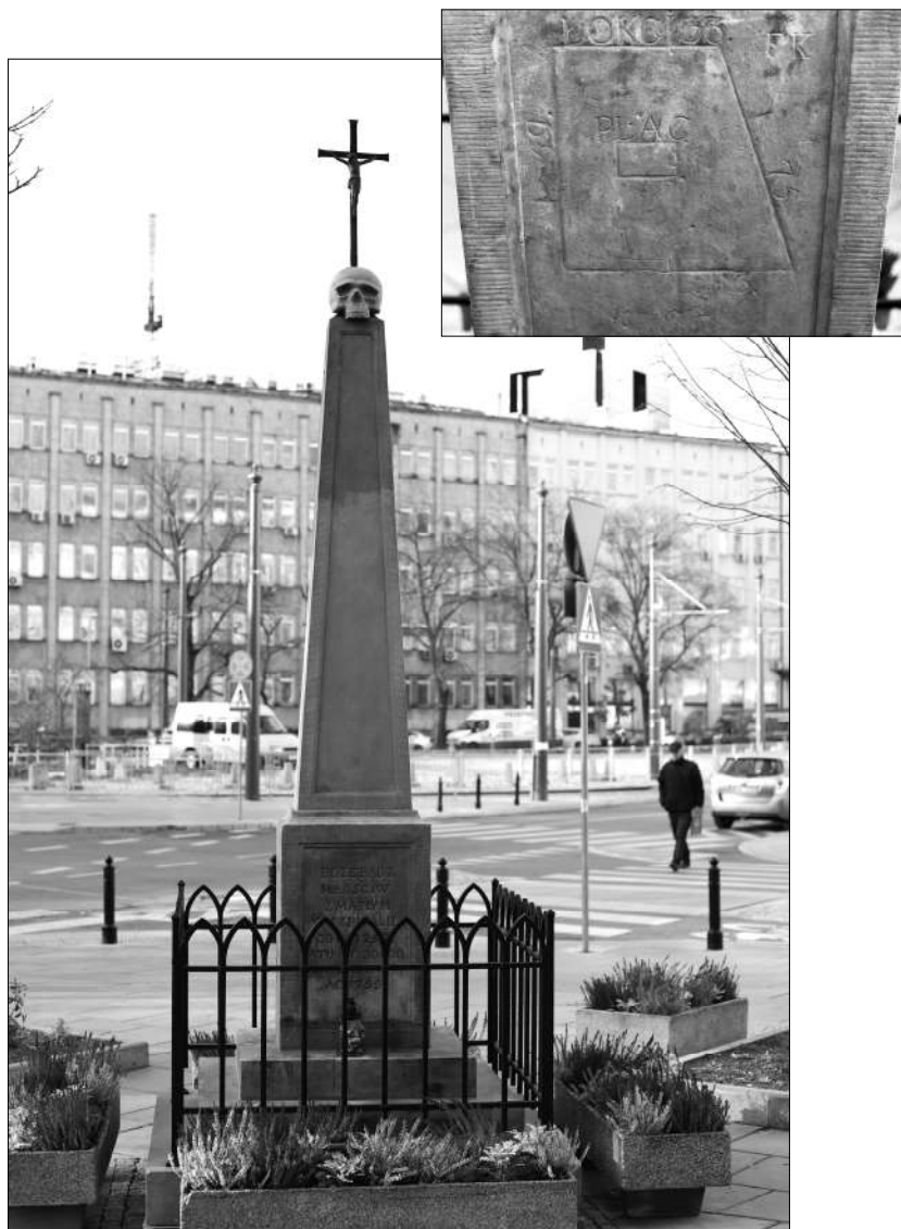
Fot. 8. Pamiątkowy pomnik przy ulicy Lindego i Nowogrodzkiej w Warszawie