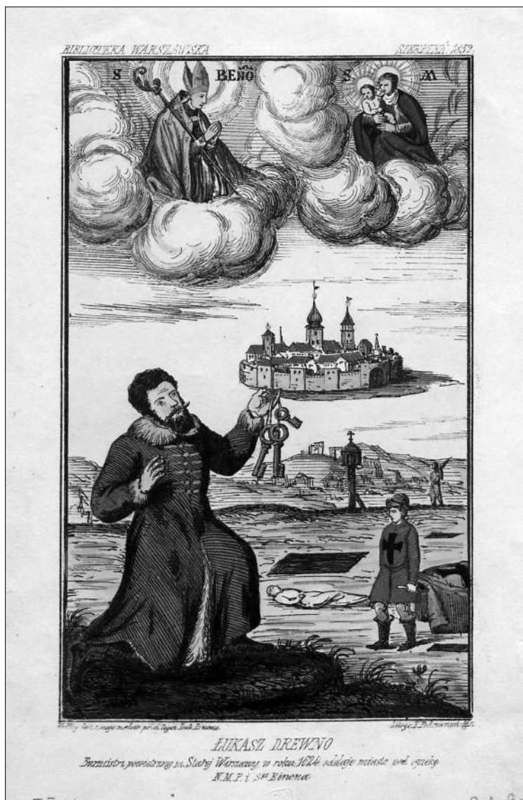
Fot. 3. Łukasz Drewno ofiaruje św. Benedyktowi klucze do miasta Warszawy, 1626 r.