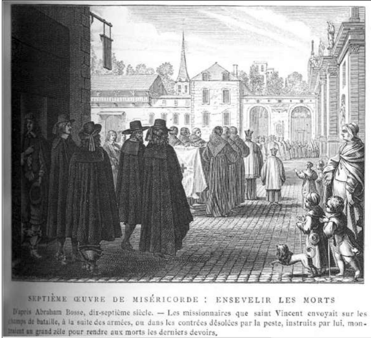
Fot. 1. Abraham Bose, Enterrer les morts