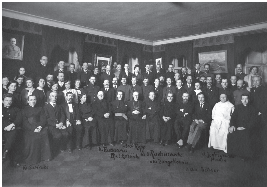
Uczestnicy zjazdu Chrześcijańskiej Demokracji w Piotrogradzie