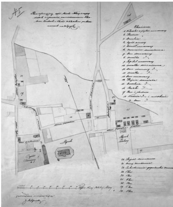
Ryc. 3. Grunty i budynki stanowiące własność kościelną (pomisjonarską) w Mławie (1866)