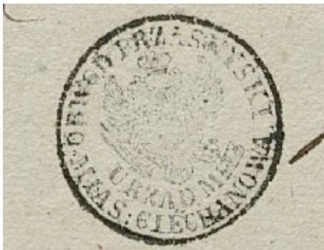
Ryc. Pieczęć Urzędu Miejski Miasta Ciechanowa (dokument z 1840 r.)