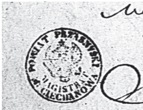
Ryc. Pieczęć Magistratu Miasta Ciechanowa (dokument z 1852 r.)