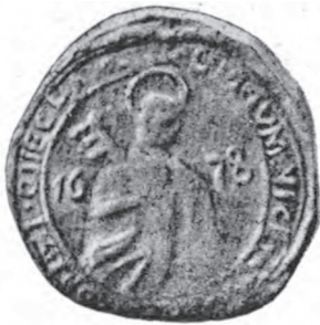
Ryc. Pieczęć wójtowska Ciechanowa