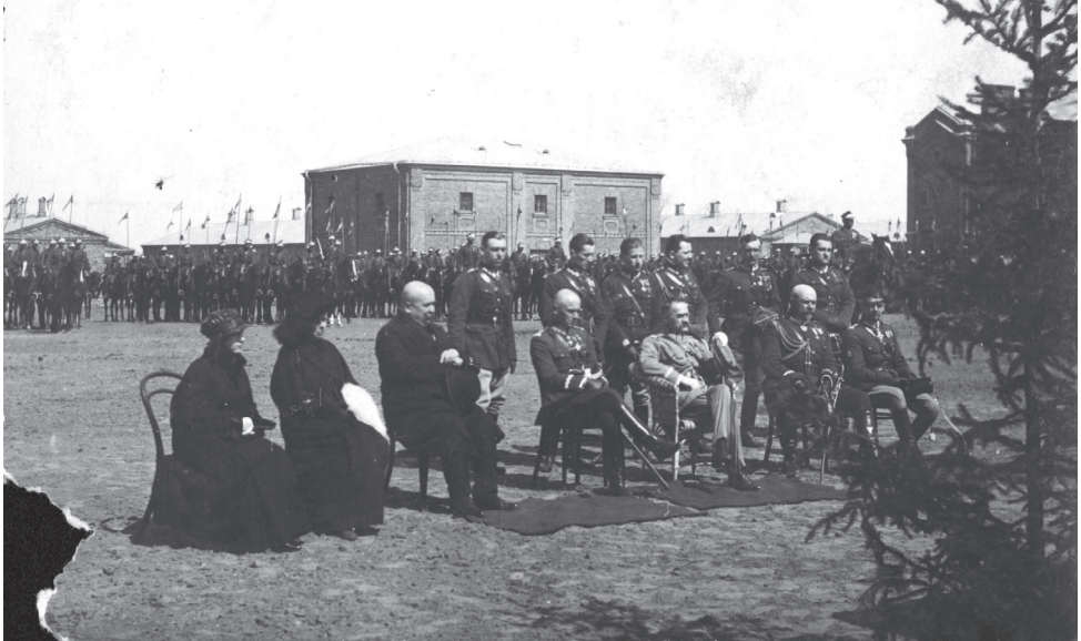
Fot. Wizyta Marszałka Józefa Piłsudskiego w ciechanowskich koszarach w dniu święta pułkowego 11 p.uł. leg., Ciechanów, 26.04.1924 r.