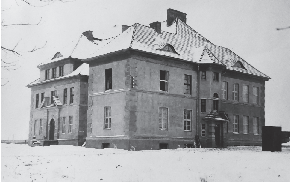
Fot. Nowo wybudowany Sierociniec przy ul. Sienkiewicza w Ciechanowie, 1926 r.