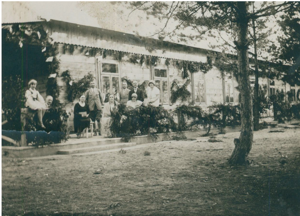
Fot. Dom kolonijny dla dzieci w Ościślowie, maj 1930 r. Pośrodku siedzi prawdopodobnie Michalina Mościcka, żona Prezydenta RP