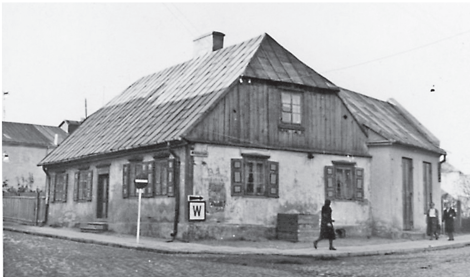
Fot. Dom przy ul. 3 Maja 2 w Ciechanowie w czasie okupacji