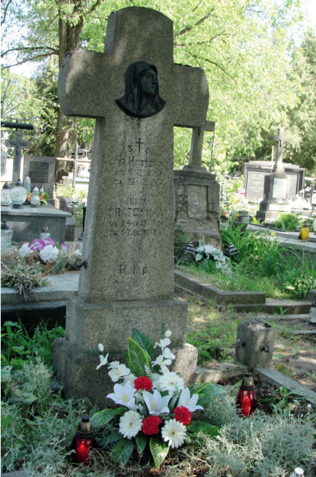
Fot. Grób Julii Kratowskiej na cmentarzu przy ul. Płońskiej w Ciechanowie