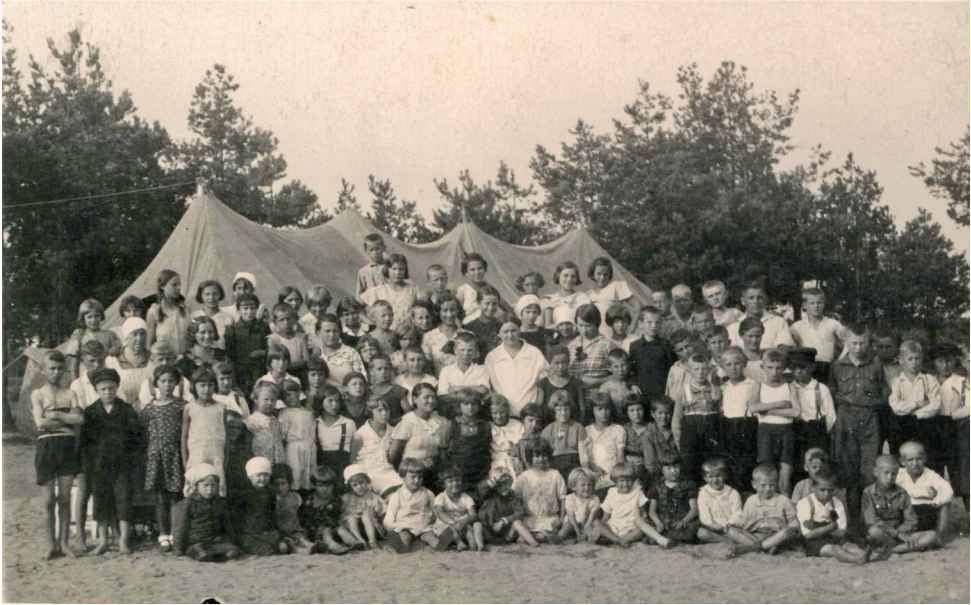
Fot. Dzieci kolonijne w lesie ościsłowskim, lata 30. XX w.