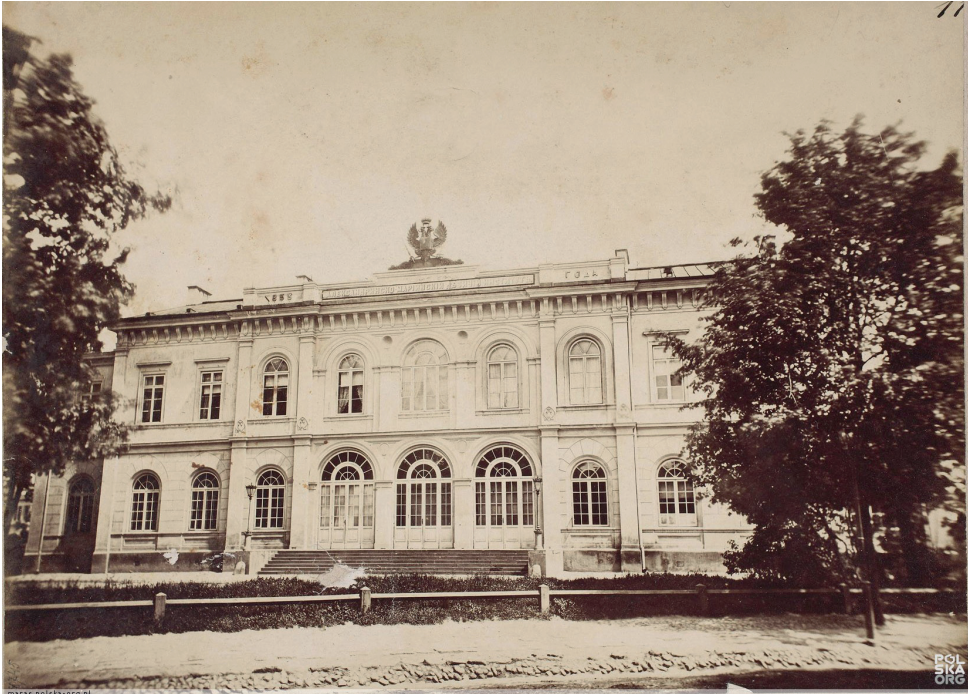
Fot. Gmach Aleksandryjsko-Maryjskiego Instytutu Wychowania Panien w Warszawie, 1865 r.