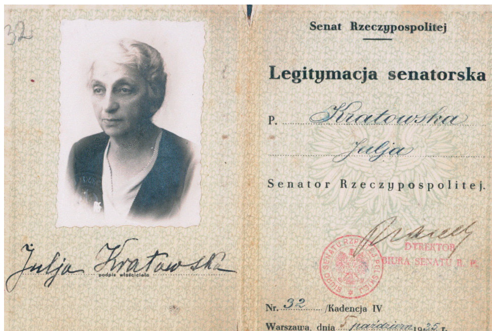
Fot. Legitymacja senatorska Julii Kratowskiej, Warszawa 5 października 1935 r.