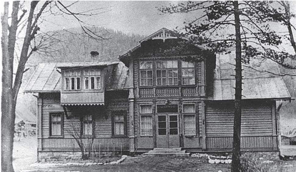
Fot. „Szarotka”, jedna z willi Prywatnego Gimnazjum Realnego w Zakopanem, ok. 1915 r.