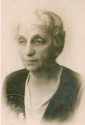
Fot. Julia Kratowska w 1935 r. Fotografia z legitymacji se- natorskiej

Źródło: zbiory Muzeum Szlachty Mazowieckiej (MSM), nr inw. MOC/D/323.