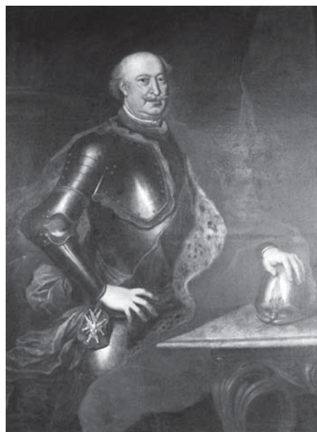
Fot. 2. Jan Tarło, obraz pędzla Augustyna Mirysa