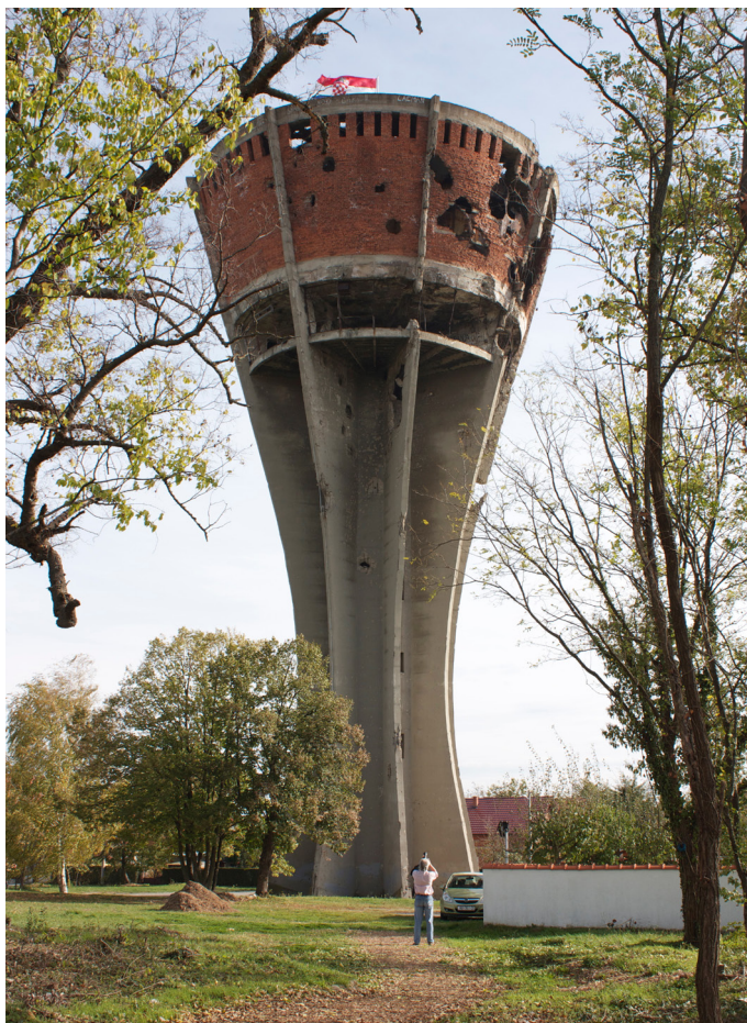
Fot. 9. Wieża ciśnień Hrvatski branitelj w Vukovarze

Również w gazetach chorwackich z czasów wojny lub okołowojeńnych można przeczytać o podobnych przypadkach, np. „Večernji list” opublikował artykuł, w którym opisana została sytuacja w miejscowości Stari Slankamen (na terenie dzisiejszej Serbii), przed wojną zamieszkiwanej przez Chorwatów (P.Z., 1992). Po 1991 r. wieś masowo zasiedlali Serbowie. Gdy jeszcze stanowili mniejszość, serbscy rodzice nie mogli się nadziwić, że ich dzieci wracają ze szkoły z pieśnią na ustach Mi smo garda hrvatska ( My jesteśmy Chorwacka Gwardia ), której nauczyli się od stanowiących w szkole większość dzieci chorwackich. Autor artykułu pisze: