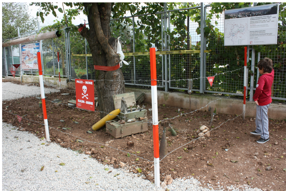
Fot. 7. Ekspozyty w Muzeum Tunel Spasa w Sarajewie