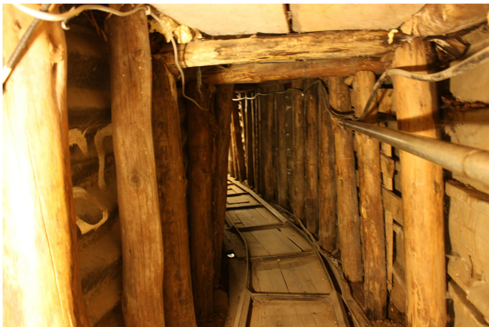
Fot. 6. Zachowany fragment „Tunelu życia” w Muzeum Tunel Spasa w Sarajewie