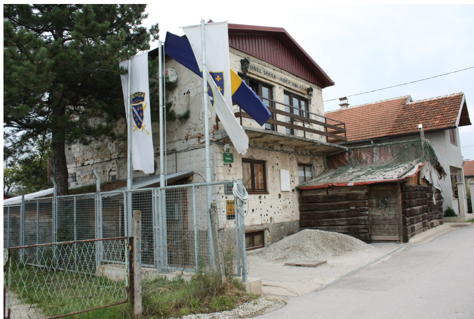
Fot. 5. Muzeum Tunel Spasa w Sarajewie

Powyższe przykłady ilustrują wytrwałość, odwagę i determinację zagrożonej populacji oraz wartości związane z aktywnością fizyczną. Mieszkańcy Sarajewa, ówczesnie jednego z najbardziej nowoczesnych miast Europy, kontynuowali nie tylko tradycje sportowe. W oblężonym Sarajewie, w podziemiach odbyły się np. wybory miss oblężonego Sarajewa ( Miss obkoljenog Sarajeva ), podczas których piękne kobiety na wybiegu trzymały transparent z napisem: „Don't let them kill us” („Nie pozwólcie im nas zabić”). Wydarzenie to zostało pokazane w filmie dokumentalnym o życiu w oblężonym mieście dziennikarza Billa Cartera (1995) pt. Miss Sarajevo .