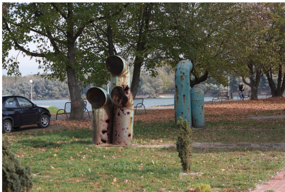
Fot. 8. Zniszczenia Vukovaru