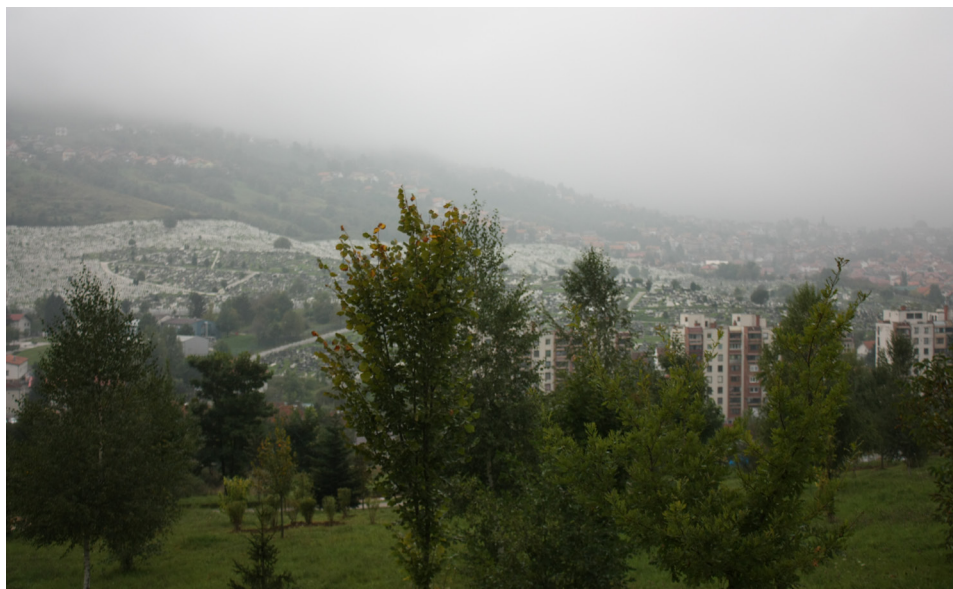
Fot. 2. Widok na cmentarze w Sarajewie