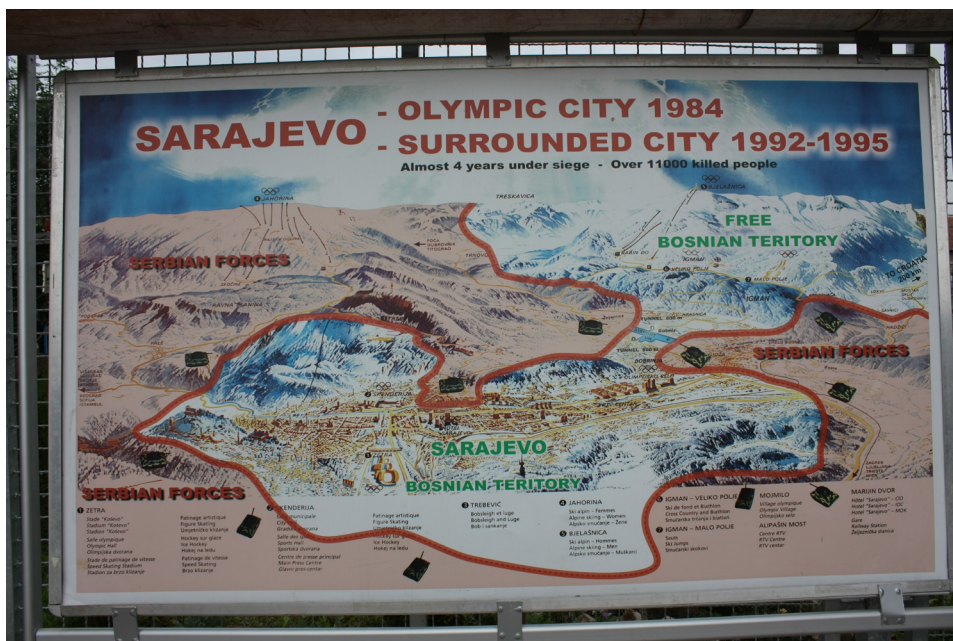
Fot. 1. Mapa oblężenia Sarajewa w Muzeum Tunel Spasa w Sarajewie

Na przekór niedogodnościom i ograniczeniom wielu sportowców chciało zachować poczucie tożsamości i namiastkę przedwojennego życia. W nocy, ukryci pośród ruin i w piwnicach, w miarę możliwości wykonywali ćwiczenia fizyczne. Część z nich dzięki determinacji, ucieczce z oblężonego miasta wzięła udział w zawodach zagranicznych. W czasie wojny zawodnicy z Bośni i Herce-