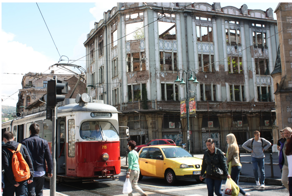
Fot. 4. Zniszczenia w Sarajewie