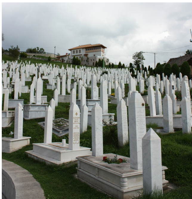
Fot. 3. Cmentarz w Sarajewie