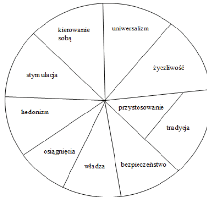
Rysunek 1. Koło wartości Schwartza