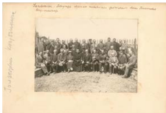
5. Uczestnicy otwarcia siedziby PTK i Muzeum Ziemi Sandomierskiej, Biblioteka Diecezjalna w Sandomierzu, Spuścizna ks. Andrzeja Wyrzykowskiego

5. Participants of the opening of the seat of PTK and the Museum of the Sandomierz Region, Diocesan Library in Sandomierz, Fr Andrzej Wyrzykowski's legacy