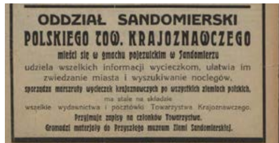
2. Ogłoszenie o gromadzeniu eksponatów do Muzeum Ziemi Sandomierskiej z 1920 r., „Ziemia Sandomierska” 1920, nr 1

2. Announcement calling for amassing exhibits for the Museum of the Sandomierz Region from 1920, Ziemia Sandomierska 1 (1920)