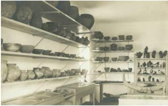
6. Sala ekspozycyjna z wystawą stałą Muzeum Ziemi Sandomierskiej, Zakład fotograficzny Franciszka Mańkiewicza w Sandomierzu, Muzeum Zamkowe w Sandomierzu, Dział Historyczny

6. Display room with the permanent exhibition at the Museum of the Sandomierz Region, Franciszek Mańkiewicz's Photo Studio in Sandomierz, Castle Museum in Sandomierz, Historical Department