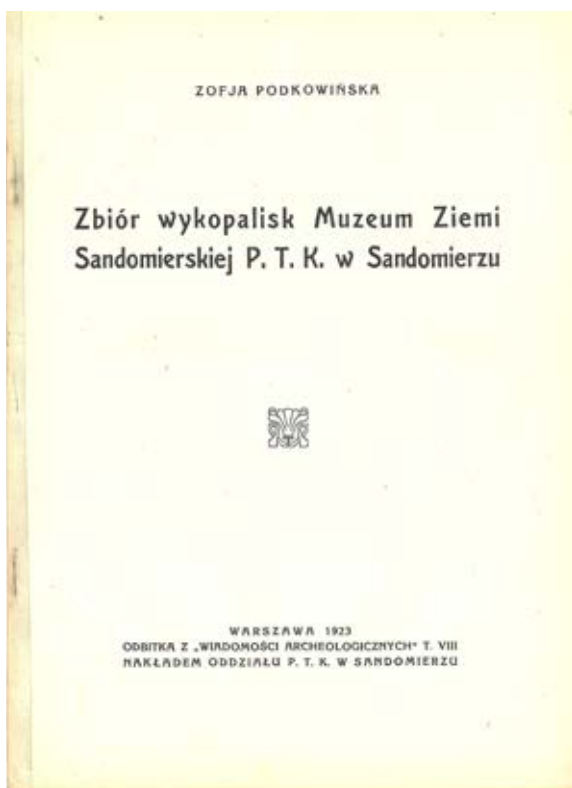
4. Nadbitka artykułu Zofii Podkowińskiej, Zbiór wykopalisk Muzeum Ziemi Sandomierskiej PTK w Sandomierzu

3. Stefan Przyłęcki's manor house in Sandomierz, the first premises of the Museum of the Sandomierz Region, Castle Museum in Sandomierz, Historical Department, Photo Janusz Kwiatkowski