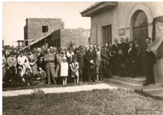
7. Odsłonięcie tablicy z okazji 400. rocznicy urodzin Jana Kochanowskiego na siedzibie PTK i Muzeum Ziemi Sandomierskiej, Biblioteka Diecezjalna w Sandomierzu, Spuścizna ks. Andrzeja Wyrzykowskiego

Znaczny wzrost liczby zwiedzających muzea sandomierskie (w latach 30.) wywołał dyskusję o utworzeniu kolejnego muzeum, publikowaną w czasopiśmie samorządowo-społecznym „Ziemia Sandomierska”. Jako wizytówka miasta miało być ulokowane w budynku ratusza, z ekspozycją złożoną z depozytów przekazanych przez muzea. Proponowano prezentację wyłącznie zabytków charakterystycznych dla dziejów ziemi sandomierskiej, co wychodziłoby naprzeciw turystom mniej wymagającym. Wsparł ten pomysł sekretarz sandomierskiego oddziału PTK Józef Pietraszewski, który w artykule O muzeum