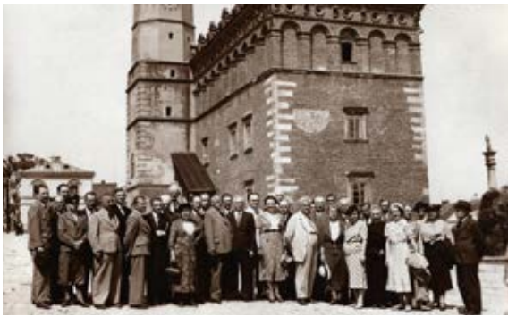
8. Uczestnicy XIV Zjazdu Delegatów Związku Muzeów w Polsce, Sandomierz, 28 czerwca 1938 r.

8. Participants of the 14 th Congress of Delegates of the Association of Museums in Poland, Sandomierz, 28 June 1938