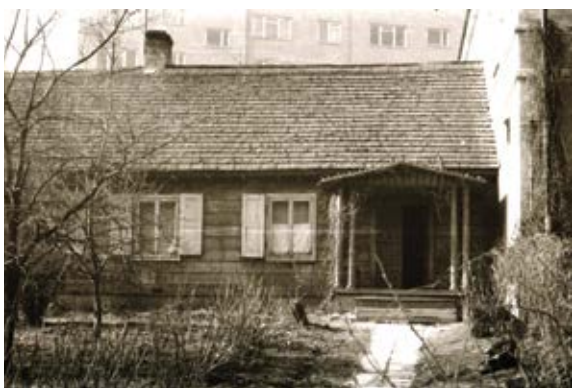
3. Dworek Stefana Przyłęckiego w Sandomierzu, pierwsza siedziba Muzeum Ziemi Sandomierskiej, Muzeum Zamkowe w Sandomierzu, Dział Historyczny

3. Stefan Przyłęcki's manor house in Sandomierz, the first premises of the Museum of the Sandomierz Region, Castle Museum in Sandomierz, Historical Department