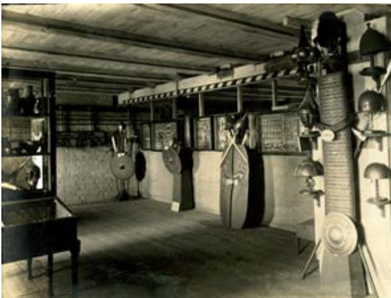
9–10. Fragment ekspozycji kolekcji Theodora Josepha Blella na podstryszu Wielkiej Komturii na Zamku Średnim, Marienburg Baujahr 1914, fot. 12; 1917, fot. 24