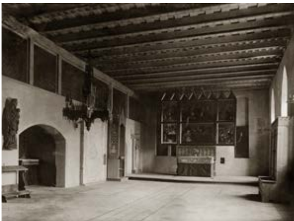
5. Kaplica św. Wawrzyńca na przedzamczu wraz z eksponowanym tam do 1945 r. Polptykiem Grudziądzkim (obecnie zbiory Muzeum Narodowego w Warszawie), Marienburg Baujahr 1916, fot. 39

5. St Lawrence's Chapel in the Outer Castle with the Grudziądz Polyptych displayed there until 1945 (currently at the National Museum in Warsaw), Marienburg Baujahr 1916, Photo 39