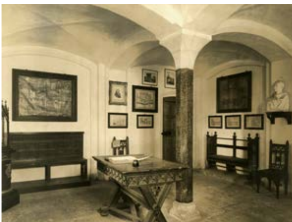
6. Wnętrze tzw. Izby Schöna w górnej kondygnacji piwnic Pałacu Wielkich Mistrzów na Zamku Średnim, z ołtarzykiem z połowy XVII w. (w gablocie po prawej); nadbudowa ołtarzyka w postaci krucyfiksu z figurą Chrystusa stanowi obecnie stratę wojenną, podstawa w zbiorach Muzeum Zamkowego w Malborku, Marienburg Baujahr 1917, fot. 38

5. St Lawrence's Chapel in the Outer Castle with the Grudziądz Polyptych displayed there until 1945 (currently at the National Museum in Warsaw), Marienburg Baujahr 1916, Photo 39