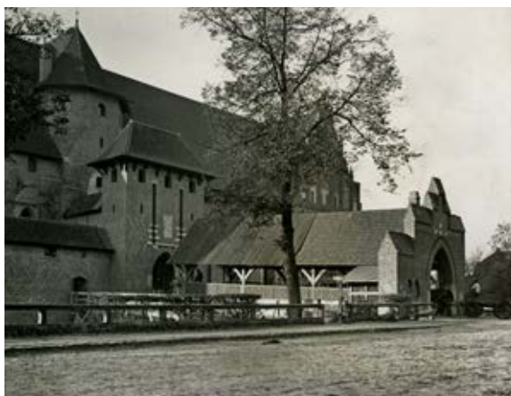
2. Brama główna zamku malborskiego, Marienburg Baujahr 1909, fot. 49

1. Project's logo, designed by J. Kacperska