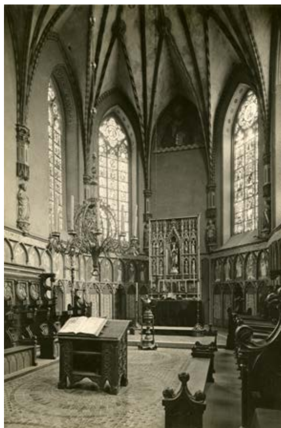
4. Kościół Najświętszej Marii Panny na Zamku Wysokim, widok w kierunku wschodnim, Marienburg Baujahr 1913, fot. 3

3. The interior of the Grand Refectory in the Middle Castle, the Hamburg Altar in the background, Marienburg Baujahr 1916, Photo 13