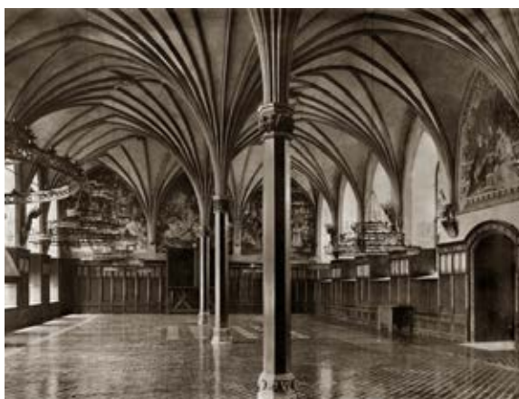
3. Wnętrze Wielkiego Refektarza na Zamku Średnim, w głębi Ołtarz Hamburgski, Marienburg Baujahr 1916, fot. 13

2. The main gate to the Malbork Castle, Marienburg Baujahr 1909, Photo 49