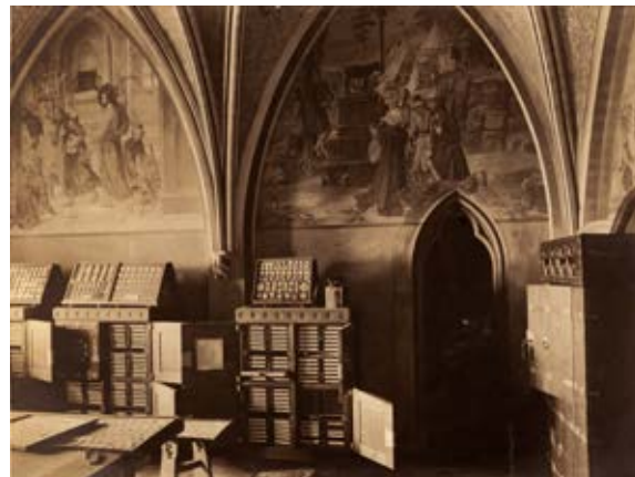
7–8. Gabinet numizmatyczny wraz z dedykowaną mu biblioteką specjalistyczną w komnatkach dostojników krzyżackich na Zamku Wysokim, Marienburg Baujahr 1917, fot. 4, 6