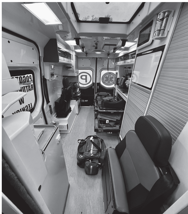
Ryc. 3. Wnętrze ambulansu. Ograniczona przestrzeń i mnogość sprzętu medycznego znacząco utrudniają opiekę nad pacjentem w ciężkim stanie

Transport pacjenta powinien być wykonywany najszybszą i najbezpieczniejszą drogą. Bardzo dobrym rozwiązaniem jest powiadomienie ośrodka docelowego (pracowni diagnostycznej) o tym, iż wyruszyliśmy i przewidywanym czasie dotarcia. Pozwoli to na przygotowanie się personelu do przyjęcia pacjenta i skróci czas oczekiwania na przekazanie.