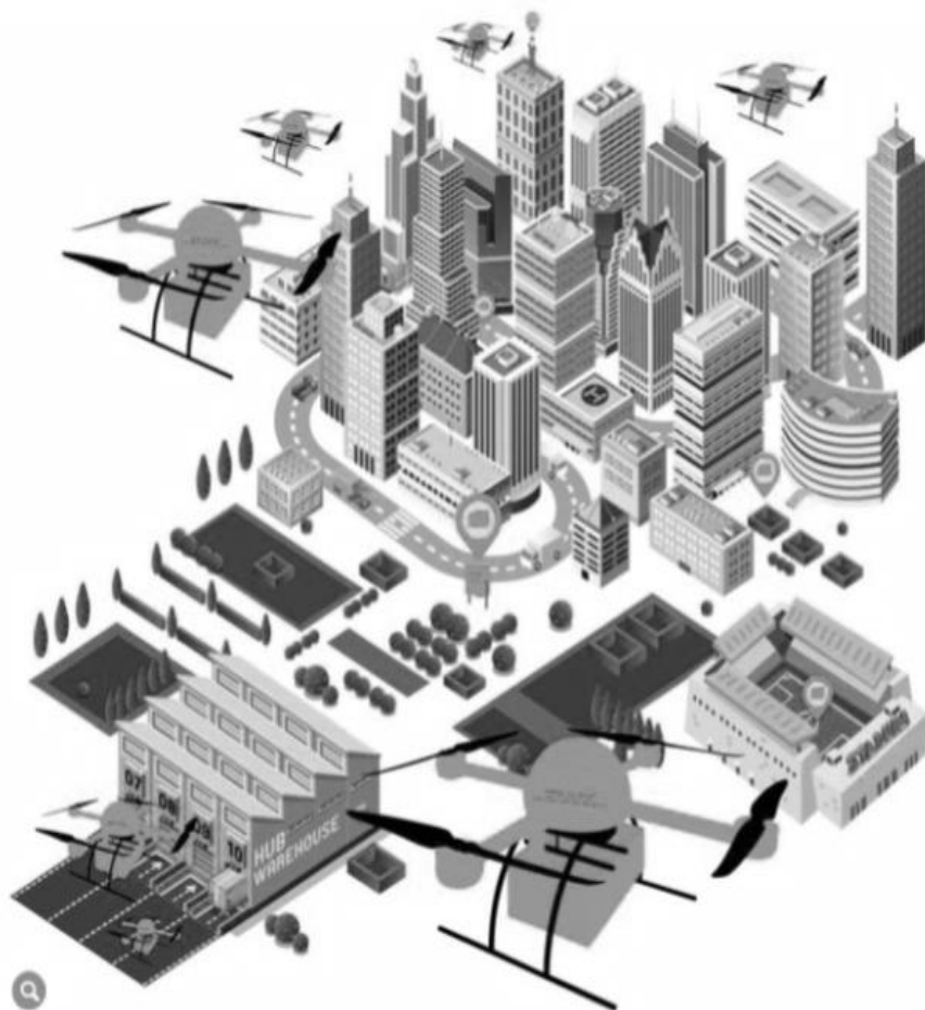
Rysunek nr 1. Wizualizacja wykorzystania dronów w logistyce.