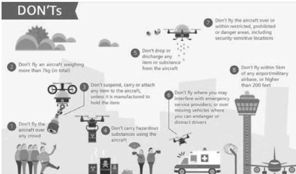
Rysunek nr 2. Lataj bezpiecznie RPAS.