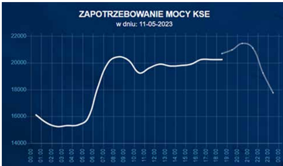
Rysunek 3. Dobowy wykres zmian zapotrzebowania na moc w krajowym systemie elektroenergetycznym

Ponadto poczynione uprzednio założenie, że fotowoltaika przez kilka godzin może pokryć całkowicie zapotrzebowanie na energię elektryczną w Polsce jest całkowicie nierealne. Jak wynika z Rys. 3, około dwudziestej i dwudziestej pierwszej godziny doby w systemie elektroenergetycznym pojawia się tzw. wieczorny szczyt zapotrzebowania. Wówczas produkcja fotowoltaiki wynosi dokładnie zero, a zapotrzebowanie na moc jest relatywnie największe i musi w praktyce zostać pokryte prawie w całości przez elektrownie ciepłone, co prawda wspomagane nieco przez elektrownie wodne zbiornikowe, elektrownie szczytowo-pompowe, elektrownie wiatrowe (o ile wtedy wieje dostatecznie silny wiatr) oraz import energii z krajów ościennych (zwykle po bardzo wysokich cenach).