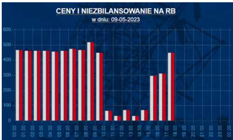
Rysunek 5. Informacja o hurtowych cenach energii elektrycznej w poszczególnych godzinach doby w dniu 9 maja 2023

Gdyby mocy zainstalowanej w polskiej fotowoltaice było dwa razy więcej, nie byłoby już w zasadzie żadnych możliwości, aby jej nadmiar w jakikolwiek sposób spożytkować. Zresztą tego typu sytuacja miała już miejsce po raz pierwszy w historii w dniu 23 kwietnia, a następnie 30 kwietnia, a także 2 lipca 2023 i zapewne nie jeden raz jeszcze się w przyszłości powtórzy. Wówczas Polskie Sieci Elektroenergetyczne S. A. (PSE) musiały ogłosić stan zagrożenia dostaw energii elektrycznej na terenie całego kraju, ponieważ tylko w takiej sytuacji mogły wydać nakaz odłączenia od sieci elektroenergetycznej wybranych farm fotowoltaicznych i elektrowni wiatrowych.