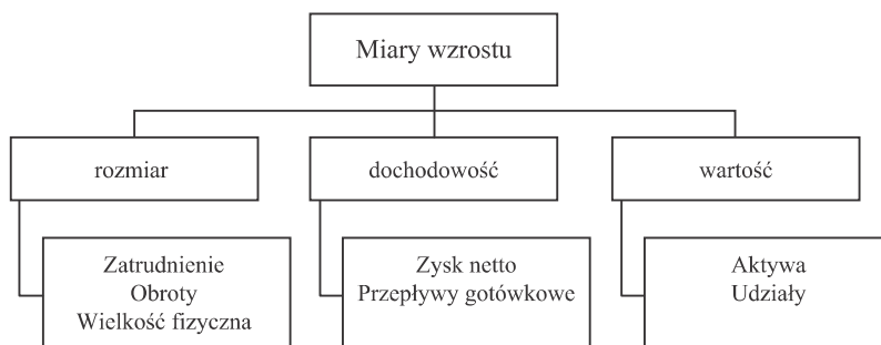
Rys. 2. Miary wzrostu przedsiębiorstwa. Źródło: opracowanie własne na podstawie: A. Willem i H. Crijsna. (1997). Measuring Company Growth: The Effects of Different Growth Periods, Growth Criteria and Portfolio Structures on the Identification of High Growers . Referat wygłoszony na: Konferencja RENT XII. Lyon; J.E. Wasilczuk. (2005). Wzrost małych i średnich przedsiębiorstw – aspekty teoretyczne i badania empiryczne . Gdańsk: Politechnika Gdańska.

Także wzrost przedsiębiorstwa może być różnie definiowany, a wybór definicji będzie determinował mierniki/zmienne zależne tego zjawiska. W przypadku wzrostu przedsiębiorstwa literatura dostarcza szeregu propozycji mierników, które zostały zebrane przez Willema i Crijsna (1997) oraz Delmara (2006). Ci pierwsi sklasyfikowali pojawiające się propozycje miar wzrostu, wymieniając cztery ich kategorie: rozmiar ( dimension ), dochodowość ( profitability ), wartość ( value ) oraz jakość ( quality ) (rysunek 2), z których każda jest obarczona wadami. Przedstawiona klasyfikacja obejmuje także jakość, która jednak, według autorki, powinna być zaliczana do miar rozwoju firmy, a nie jej wzrostu 1 . Najczęściej wybieranym przez badaczy miernikiem wzrostu przedsiębiorstwa jest zatrudnienie w firmie. Jest to miara łatwa do międzynarodowych porównań, a także łatwa do pozyskania. Przedsiębiorcy chętniej ujawnią liczbę zatrudnionych niż dane finansowe, nawet jeżeli będą je pamiętali.