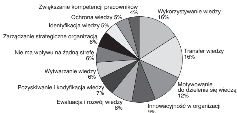
Rys. 2. Zestawienie (postrzeganego) łącznego wpływu wszystkich warstw intranetu na poszczególne sfery rozwoju zarządzania wiedzą i kapitału intelektualnego.

Rysunek 2 prezentuje zestawienie (na podstawie częstości deklarowania przez respondentów postrzeganego występowania danego powiązania) łącznego wpływu wszystkich czynników (we wszystkich ośmiu warstwach intranetu) na poszczególne sfery rozwoju zarządzania wiedzą i kapitału intelektualnego. Wyniki te określono poprzez zebranie wszystkich zaznaczonych czynników wchodzących w skład poszczególnych warstw.